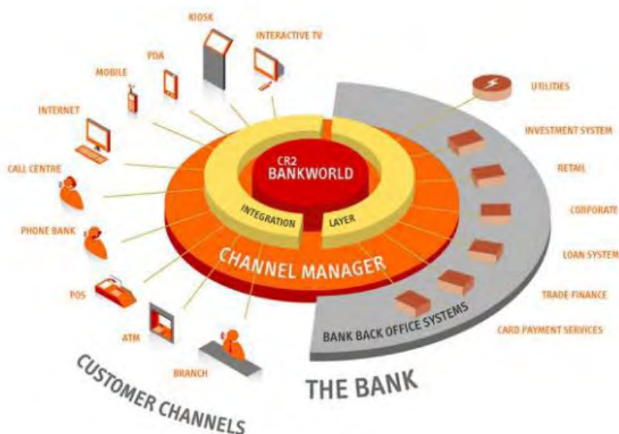
Εικόνα 2: Το μέλλον της ηλεκτρονικής τραπεζικής

Το αυτόματο ταμειακό μηχάνημα ιριδοσκόπησης προστίθεται στα μηχανήματα ταυτοποίησης των πελατών μέσω των χαρακτηριστικών που είναι αδύνατο να μεταβληθούν. Σύντομα η νέα γενιά αυτόματων ταμειακών μηχανών θα εμφανιστούν στην καθημερινή ζωή και για την πραγματοποίηση οποιασδήποτε συναλλαγής θα απαιτείται η ανίχνευση των ματιών του συναλλασσόμενου. Το σύστημα λοιπόν, φωτογραφίζει τα μάτια και μετατρέπει το μοντέλο της ίριδας του σε χρωματισμένη περιοχή γύρω από την κόρη του ματιού ένα είδος κώδικα που είναι μοναδικός για κάθε χρήστη, όπως συμβαίνει με τα δακτυλικά αποτυπώματα. Υπάρχουν ωστόσο άλλες συσκευές που μπορούν να αναγνωρίσουν το πρόσωπο, τη φωνή, την υπογραφή, την οσμή του σώματος ή το μέγεθος της παλάμης του χρήστη. Οι τράπεζες μέχρι στιγμής χρησιμοποιούν για την απόδειξη γνησιότητας τη χρεοπιστωτική κάρτα και τον τετραψήφιο αριθμό PIN. Έχει διαπιστωθεί ότι αντικείμενα όπως οι «έξυπνες κάρτες», οι μαγνητικές κάρτες, τα απλά κλειδιά μπορούν να απολεσθούν, να κλαπούν, να αντιγραφούν ή να ξεχαστούν. Η ταυτοποίηση μέσω της βιομετρικής (Μυτρίδης, 2000) είναι δύσκολο να παραβιαστεί καθώς βασίζεται στην αναγνώριση ενός αναπόσπαστου μέρους της ανθρώπινης ύπαρξης.