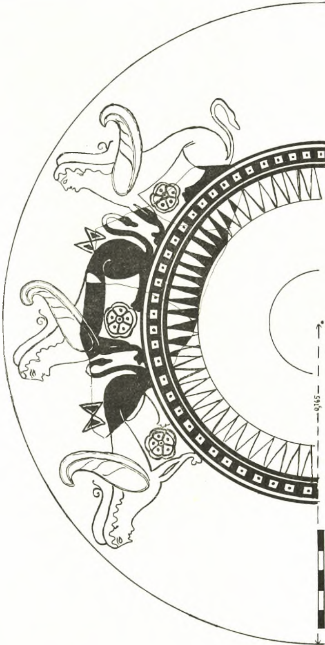
Είχ. 5. 'Η επί του δσφρέκου είκόνος 4 παράστασις κατά συμπλήρωσιν.