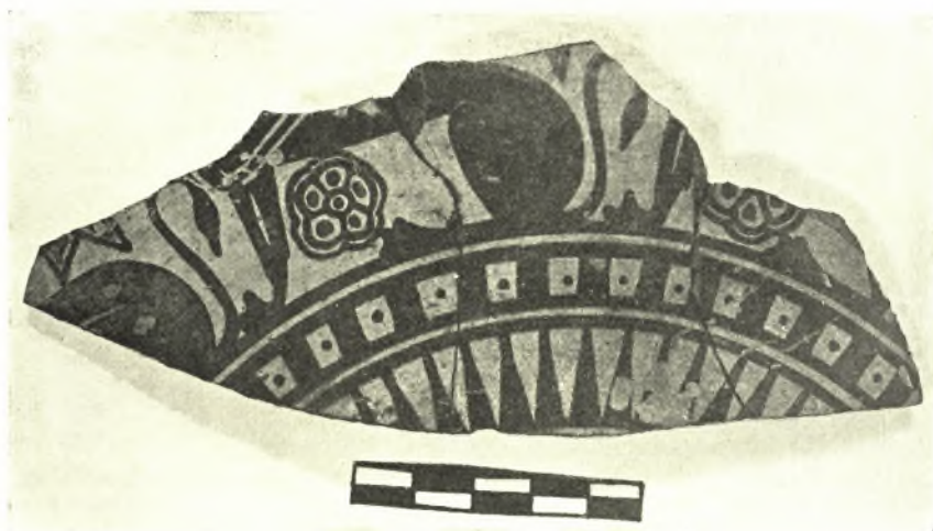
Εἰκ. 4. Ναυκρατικὸν ὄστρακον ἐκ Καβάλας.

Ναυκρατικῶν (Χιακῶν (;) εἰκ. 4-5), Λακωνικῶν ἀγγείων, ἀξιοσημείωτα εἶναι καὶ τὰ ἐξῆς μικροεργήματα : δύο κεφαλαὶ πηλίνων εἰδωλίων τῆς πολοφόρου θεᾶς καὶ ἄλλα τμήματα προφανῶς τῆς ἰδίας κρατούσης ἐπὶ τοῦ στήθους περιστεράν, ἡμίτομον καρποῦ ροιᾶς, εἰδώλια ζῶων καὶ πέλεκυς ἀμφίστομος ὀστείνως διάτρητος (Artemis Orthia πίν. CLXIII 6 καὶ πίν. CLXVI 2). Καὶ ὅσον ἀφορᾷ μὲν εἰς τὴν θρυμματώδη τῶν εὐρημάτων κατάστασιν, αὕτη εἶναι γνωστὴ ἐκ παρομοίων εὐρημάτων βόθρων καὶ θυσιῶν, τὸ ὅτι ὅμως ἐλάχιστα μεγάλα μέρη ἀγγείων ἠδυνήθημεν ν' ἀποτελέσωμεν ἐκ πολλῶν συνανηκόντων ὀστράκων, ὀφείλεται εἰς τὸ γεγονός, ὅτι δυνατὸν μέρος τοῦ περιεχο-