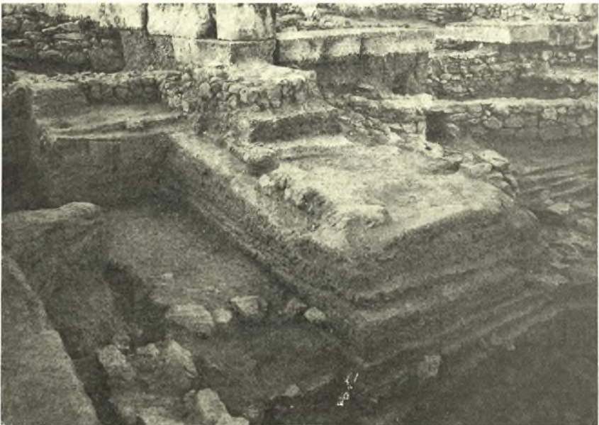
Εἰκ. 5. Νοτίως τῆς ἀρχαίας οἰκίας Βωμός(ς) καὶ τόπος θυσιῶν Προπείσιστράτεια. Ἀριστερὰ τοῖχος τοῦ πρώτου ναΐσκου.