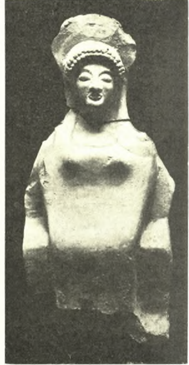
Εἰκ. 11. Πήλινον εἰδῶλιον ἐκ τῆς «ἱερᾶς οἰκίας».

τοῦ πρώτου ἀρχαϊκοῦ Τελεστηρίου, ἀποδεικνύουν ὅτι καὶ τὸ ἱερὸν τοῦτο δωματίον εἶνε σύγχρονον πρὸς τὸ πρῶτον ἀρχαϊκὸν Τελεστήριον.