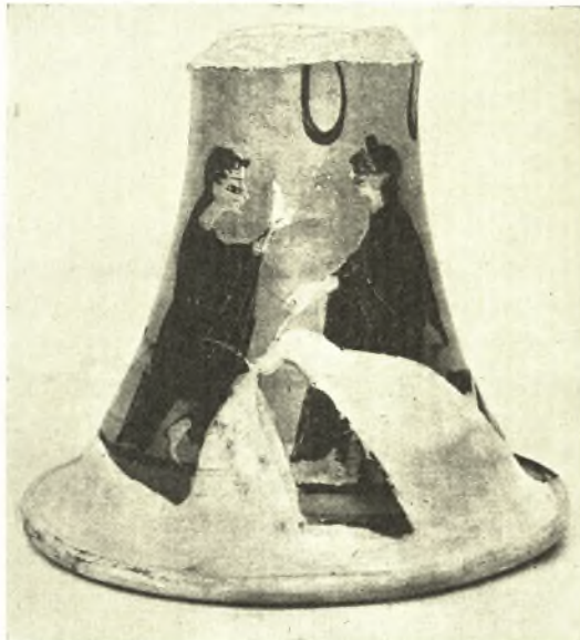
Εἰκ. 13. Ἡ ὀπισθία ὄψις τῆς βάσεως τοῦ ἄγγείου τῆς εἰκόνας 12.