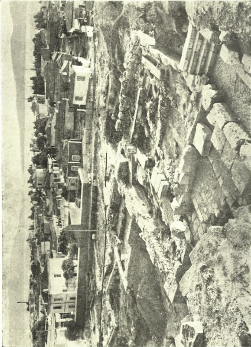
Εἰκ. 2. Ἡ «ιερά οἰκία» ἐκ ΒΔ.