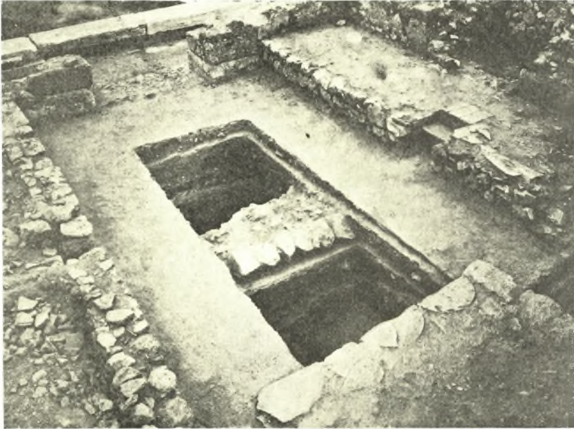
Εἰκ. 14. Σκαφή ἐντὸς τοῦ Μιθραίου.

Μικρὰ σκαφή ἔγινεν ἐπίσης πρὸς ἔρευναν τοῦ ὑπεδάφους τοῦ Μιθραίου, τὸ ὁποῖον ἐκτίσθη ἐπὶ τοῦ τοίχου τῆς ἀνατολικῆς πλευρᾶς τοῦ περιβόλου τῆς