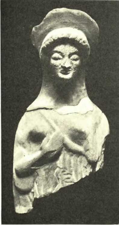
Εἰκ. 10. Πήλινον εἰδῶλιον ἐκ τῆς «ἱερᾶς οἰκίας».

του, παρὰ τὴν βορειοδυτικὴν γωνίαν του, ὅστις ἐχρησιμοποιήθη, ὡς φαίνεται ἐκ τῶν μελανομόρφων ἀγγείων καὶ ἀρχαϊκῶν εἰδωλίων, τὰ ὅποια εὐρίσκονται ἐκεῖ, καὶ κατὰ τὸν ἕκτον αἰῶνα. Τεμάχια γραπτῶν πήλινων κεραμίδων στέγης, τῶν ὁποίων τὸ σχῆμα καὶ ἡ κόσμησις εἶνε ὅμοια πρὸς τὰς γραπτὰς κεραμίδας