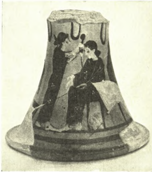
Εἰκ. 12. Βάσις ἄγγείου μὲ σκηνὴν κοσμήσεως γυναικός.

Ἐκ τῶν μικρῶν εὐρημάτων σπουδαιότερα εἶνε τὰ πῆλινα ἀρχαῖκὰ εἰδώλια κορῶν (εἰκ. 8 - 11), καὶ τὰ μελανόμορφα ἄγγεῖα