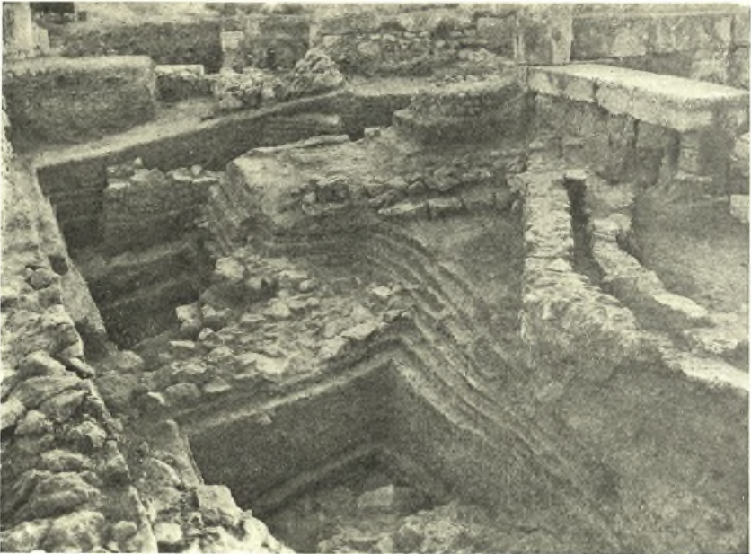
Εἰκ. 4. Σκαφή ἐντὸς τῆς ἐπιχώσεως ἀνατολικῶς τῆς ἀρχαίας οἰκίας. Λεῖψανα γεωμετρικῶν καὶ παλαιότερων κτισμάτων ἐντὸς τῆς ἐπιχώσεως.