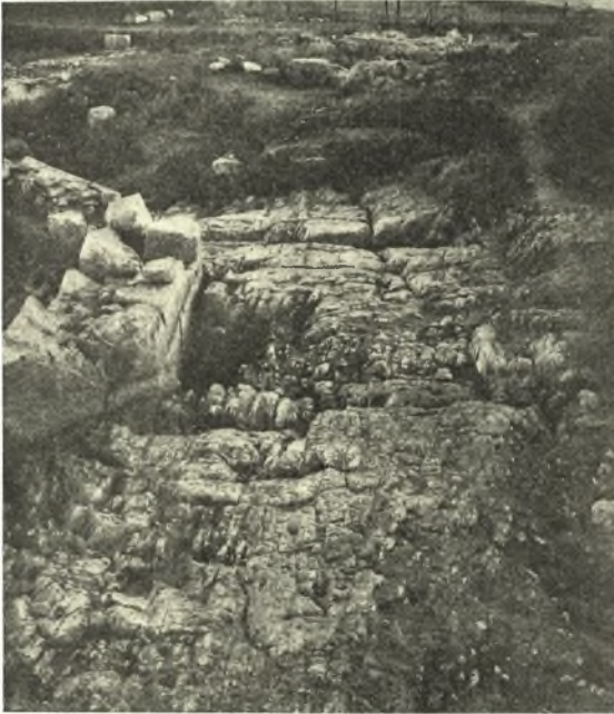
Εἰκ. 7. Ἡ ἀρχαία παρά τὸν περίβολον τῆς ἱερᾶς οἰκίας ὁδός.

Ἐντὸς τοῦ ὀγδόου αἰῶνος φαίνεται ὅτι εἰς τὸν χώρον τῆς οἰκίας ἠσκεῖτο ἤδη λατρεία.