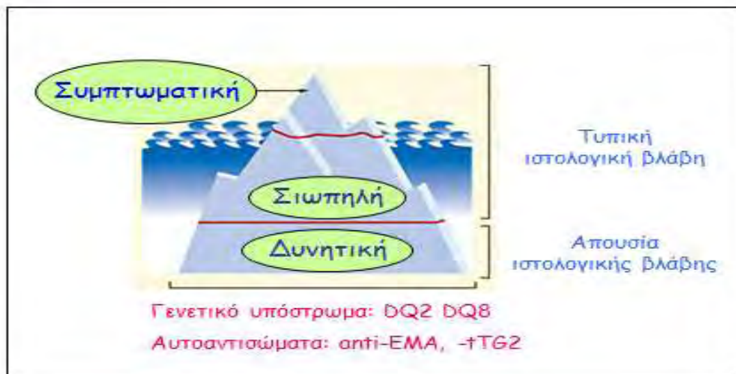
Εικόνα 2: Θεωρία του παγόβουνου στην κοιλιοκάκη 6

Η όροι λανθάνουσα και σιωπηρή κοιλιοκάκη χρησιμοποιούνται στην ιατρική ορολογία για άτομα τα οποία έχουν γονίδια που προδιαθέτουν στην κοιλιοκάκη, αλλά δεν έχουν αναπτύξει τις κλινικές εκδηλώσεις της κοιλιοκάκης.