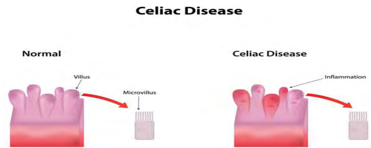
Εικόνα 1: Διατομή του λεπτού εντέρου (φυσιολογικές λάχνες / κοιλιοκάκη) 21