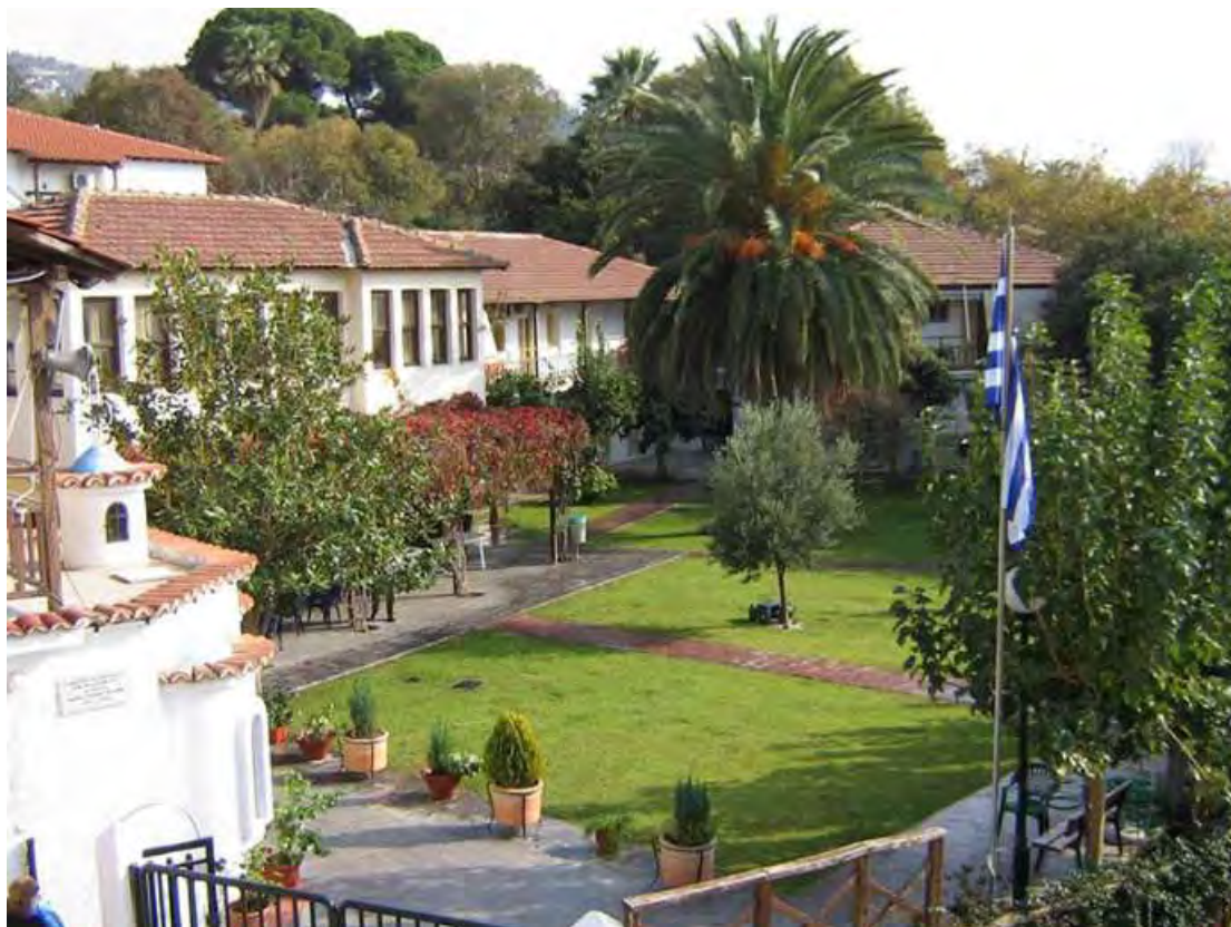
Εικόνα 1. Αποψη του εξωτερικού χώρου του Γηροκομείου Βόλου

Το γηροκομείο αποτελεί έναν χώρο φιλοξενίας και περίθαλψης ηλικιωμένων ανδρών και γυναικών. Στεγάζεται στην περιοχή της Αγίας Παρασκευής Βόλου, στις παρυφές του Πηλίου σε ένα όμορφο φυσικό περιβάλλον (βλ. εικόνα 1). Στις προσφερόμενες υπηρεσίες προς τους ηλικιωμένους συγκαταλέγονται η μόνιμη περίθαλψη και η στέγαση ανθρώπων με κινητικά προβλήματα, αλλά και αυτοεξυπηρετούμενων. Επιπλέον, παρέχει προσωρινή περίθαλψη και στέγαση για χρόνο που θα ζητήσει ο ηλικιωμένος ή το οικείο περιβάλλον του.