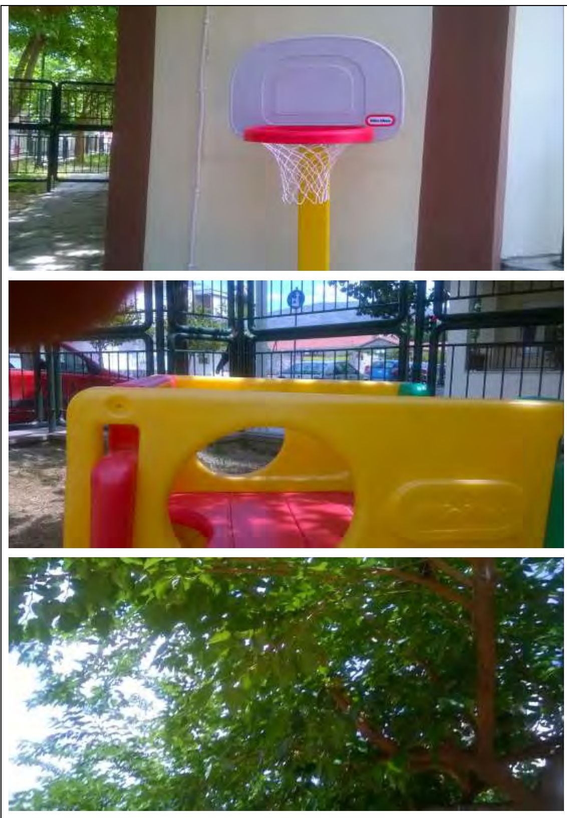
εικόνα 15 : Φωτογράφιση της αυλής από τα παιδιά