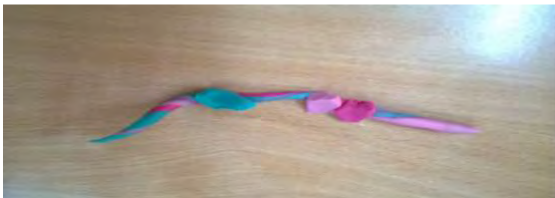
Εικόνα 13: Ουράνιο τόξο.