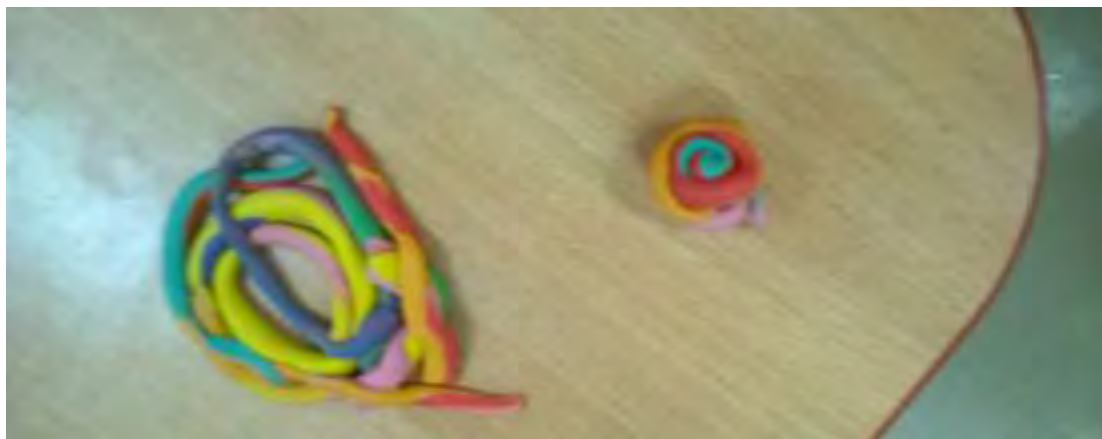
Εικόνα 8: Σαλιγκάρια.