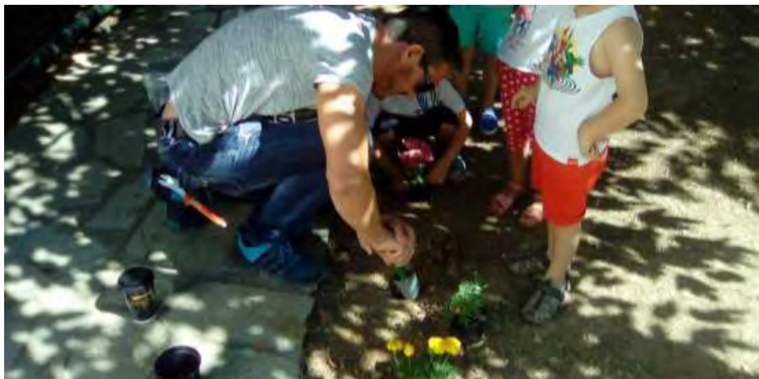
Εικόνα 34: Συνδρομή του επιστάτη στο σκάψιμο.