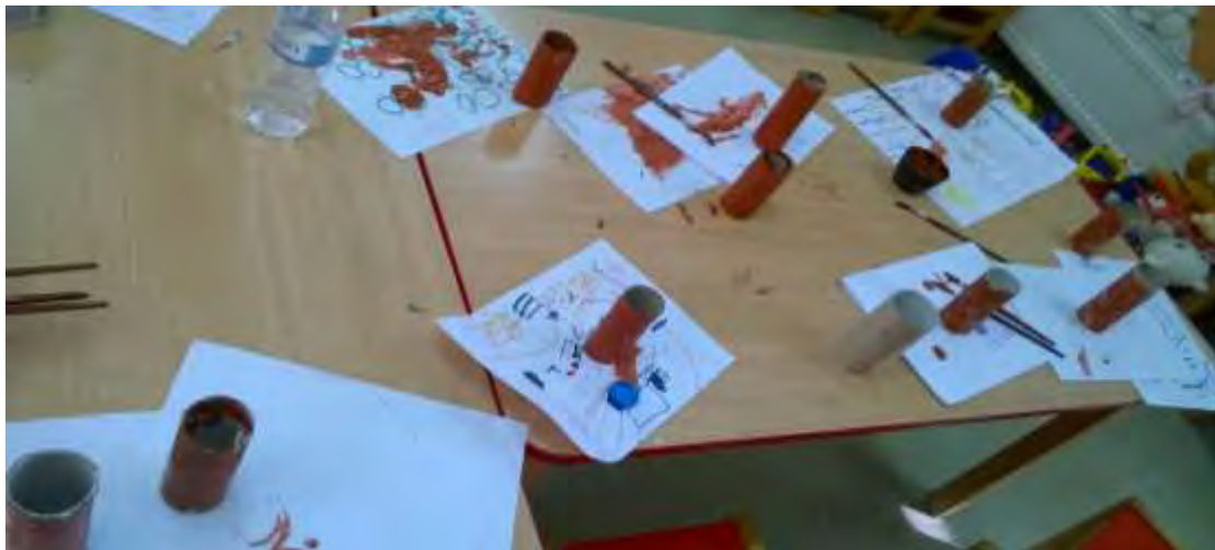
Εικόνα 20 : Κατασκευή δέντρων.

Στη συνέχεια, έβαψαν ρολά από χαρτί για να φτιάξουν τα δέντρα της αυλής (εικόνα 20).