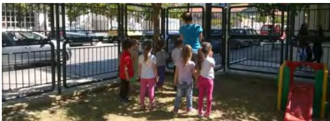
Εικόνα 5: Περίπατος και καταϊγισμός ιδεών.