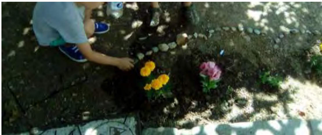
Εικόνα 37: Τα παιδιά οριοθετούν τον κήπο τους με πετρούλες.