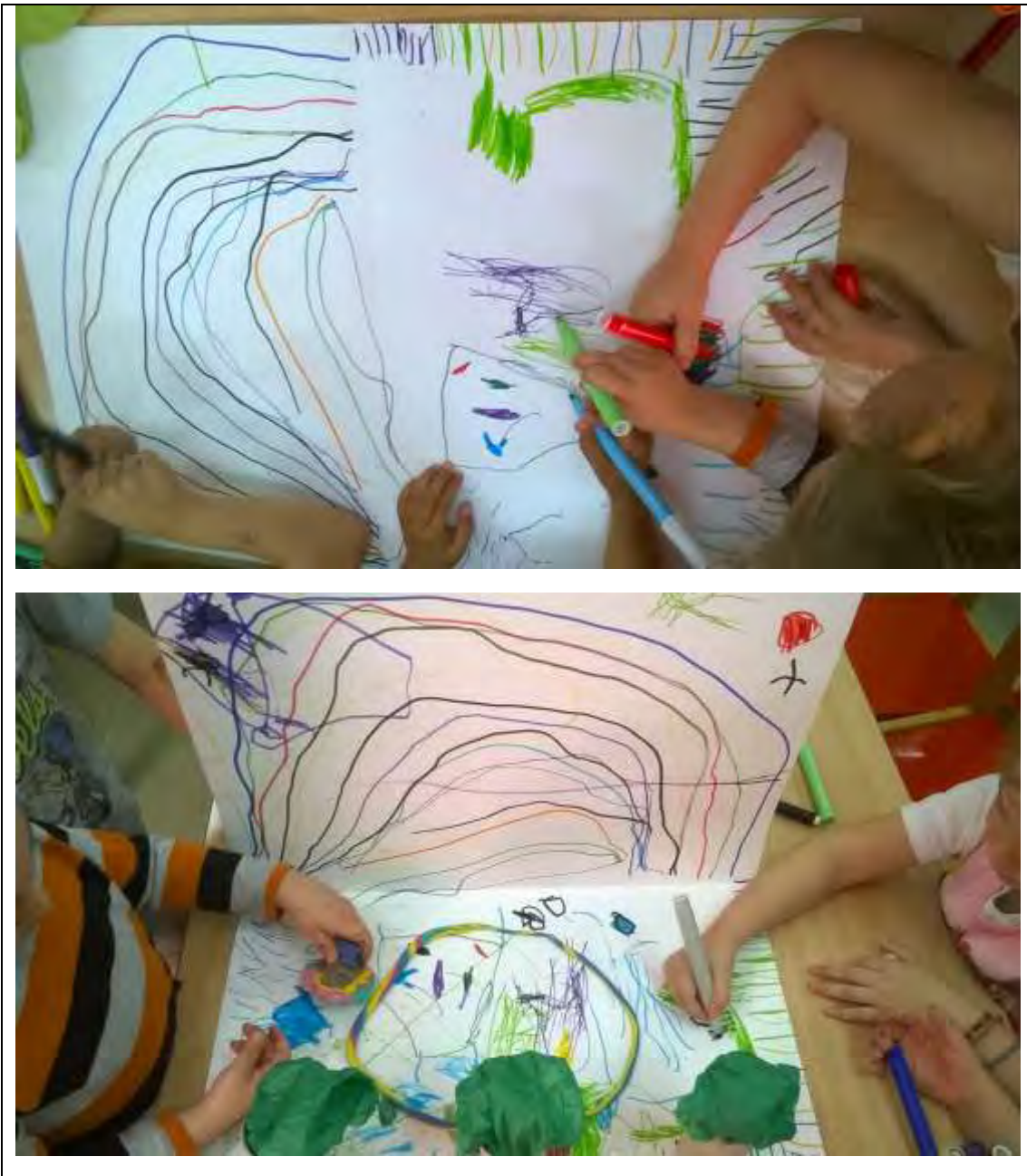
εικόνα 18 : Δοκιμαστική μακέτα

άρχισαν να ζωγραφίζουν: - Η πόρτα που είναι; -Χορτάρι δεν θα έχει; -Να βάλουμε την πισίνα στη μέση για να χωρέσει -Αυτό εδώ είναι το τραμπολίνο (εικόνα 18).