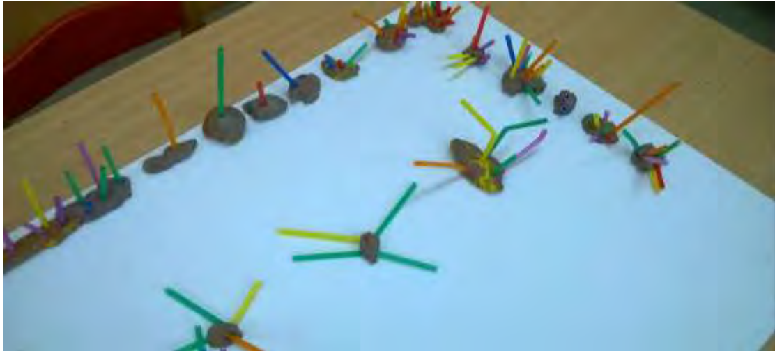
Εικόνα 19: Χρωματιστά κάγκελα.

Αρχικά, δόθηκαν στα παιδιά χρωματιστά καλαμάκια, τα οποία, αφού τα έκοψαν, τα στερέωσαν με πλαστελίνη περιμετρικά της μακέτας, αναπαριστώντας τα χρωματιστά κάγκελα (εικόνα 19).