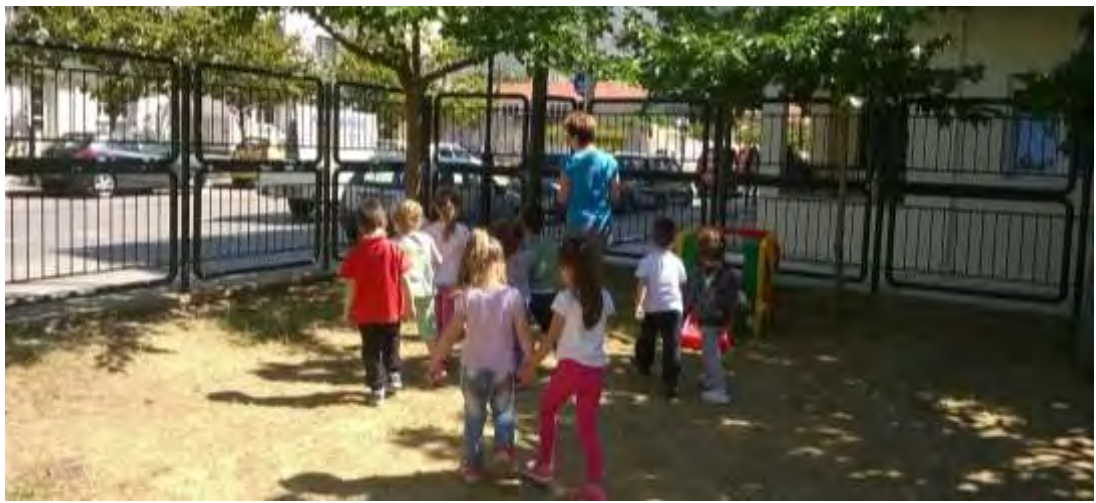
εικόνα 16 : Περίπατος στην αυλή

Όσον αφορά την έκφραση των ιδεών των παιδιών κατά τη διάρκεια του περίπατου στην αυλή, οι ιδέες των παιδιών παρουσίασαν διαφοροποίηση σε σχέση με την έκφρασή τους μέσα στην τάξη: τα παιδιά, όντας στον εξωτερικό χώρο, συνειδητοποίησαν με ποιόν τρόπο τον χρησιμοποιούν, έκαναν συσχετίσεις και εξέφρασαν τις επιθυμίες τους, θέλοντας να συμβάλλουν στην εκ νέου διαμόρφωση του άμεσου περιβάλλοντός τους, την αυλή του σχολείου τους (εικόνα 16). Τα παιδιά, με την μέθοδο του καταγισμού ιδεών, που έλαβε χώρα μέσα στην τάξη, ζήτησαν μια βιβλιοθήκη, ένα ουράνιο τόξο, χελιδόνια, τα οποία υπήρχαν στον χώρο της τάξης, ενώ, βγαίνοντας στον εξωτερικό προαύλιο χώρο, μέσω της συλλογικής ζωγραφικής στο δάπεδο της αυλής, ανέπτυξαν και άλλες διαφορετικές ιδέες (εικόνα 17).