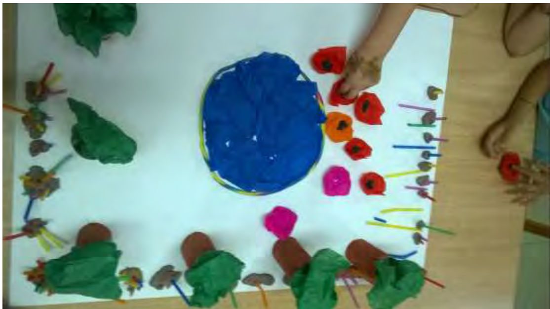
Εικόνα 22: Λουλούδια.

Κατασκευάστηκαν λουλούδια από γκοφρέ, τα οποία κολλήθηκαν πάνω στη μακέτα (εικόνα 22).