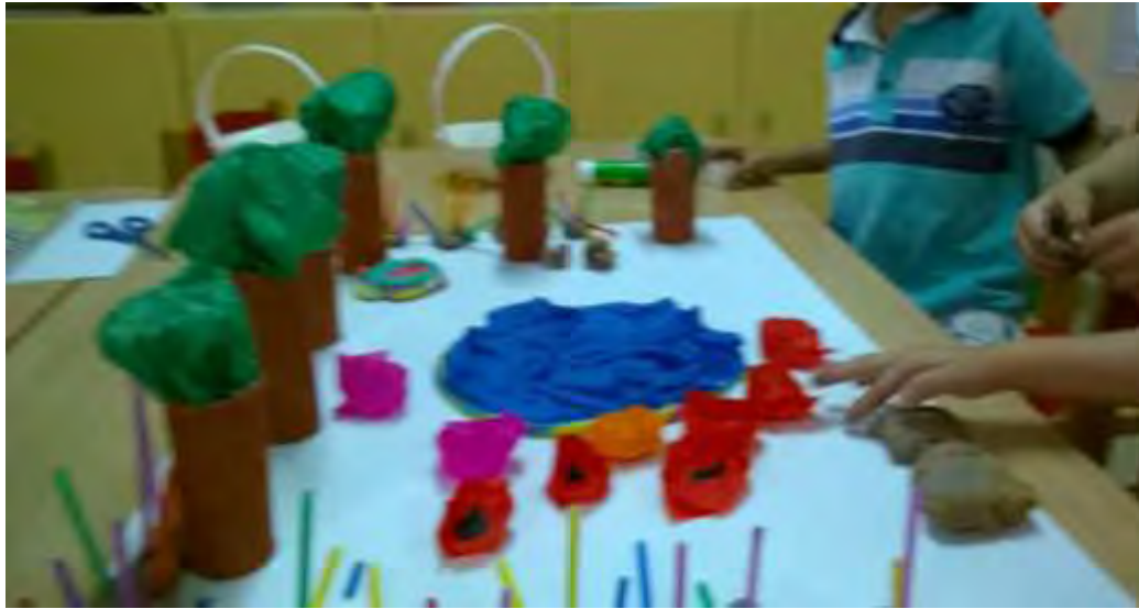
Εικόνα 25: Μαξιλάρια βιβλιοθήκης.

Τα παιδιά έφτιαξαν μαξιλάρια από πλαστελίνη, για να κάθονται να διαβάζουν τα βιβλία της βιβλιοθήκης (εικόνα 25).