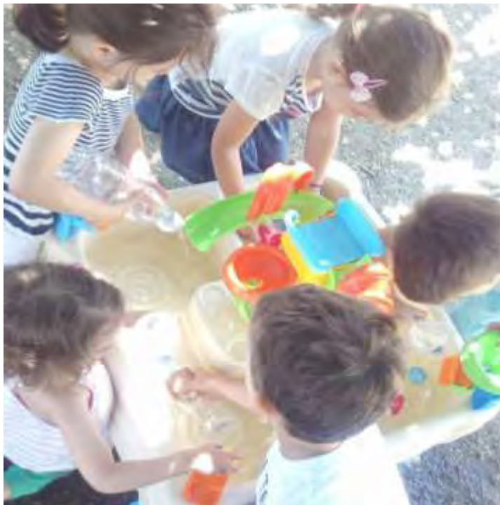
Εικόνα 40: Παιχνίδι με το τραπέζακι νερού.