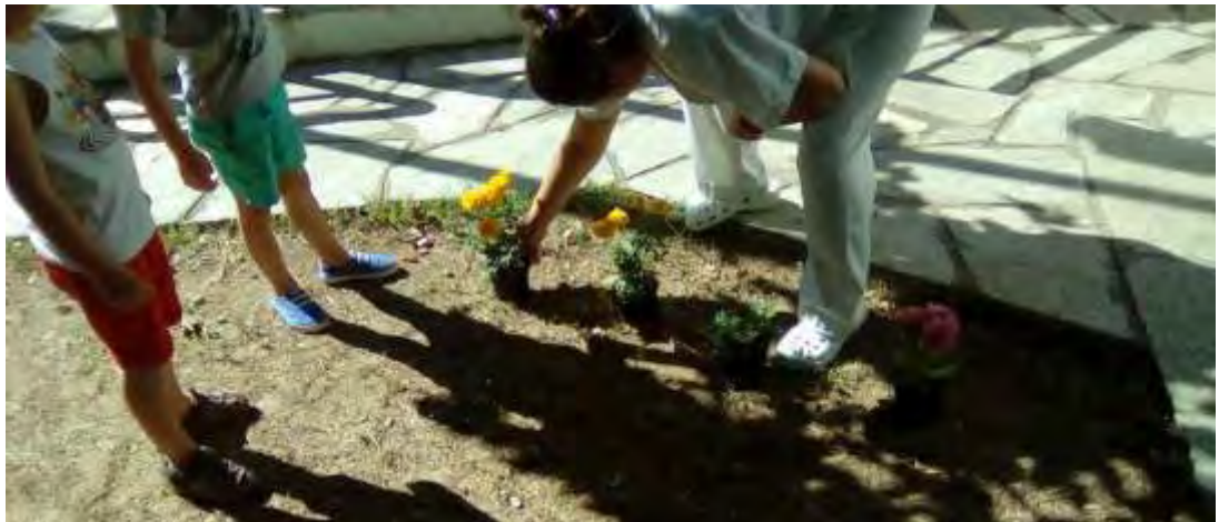
Εικόνα 33: Συνδρομή της μαγείρισσας στο φύτεμα λουλουδιών.

κάποιο παιδί πάτησε κατά λάθος ένα από τα φυτά, δημιουργήθηκε η ανάγκη για κάποιο είδος προστασίας του παρτεριού. Έτσι, προέκυψε η ιδέα να μαζέψουν πέτρες από την αυλή, για να οριοθετήσουν τον μικρό κήπο (εικόνα 37). Στη συνέχεια, έγινε η διαπίστωση ότι το χώμα είναι ξερό και με τη βοήθεια της μαγείρισσας, η οποία προμήθευσε τα παιδιά με κουβά και ένα μπουκάλι, τα παιδιά πότισαν τα καινούρια φυτά, αλλά και μια ήδη υπάρχουσα τριανταφυλλιά, με δική τους πρωτοβουλία (εικόνα 38).