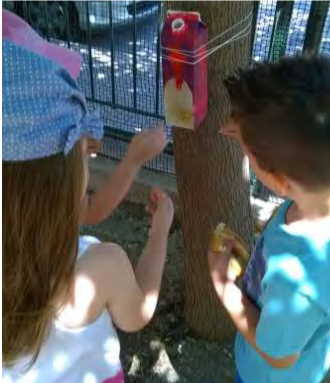
Εικόνα 42: Τα παιδιά τοποθετούν κομμάτια ψωμιού στις ταΐστρες