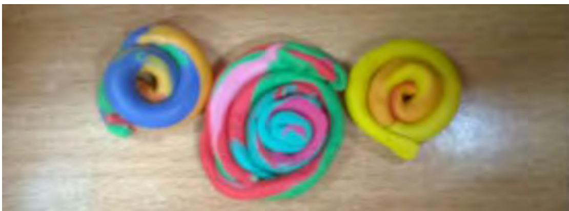
Εικόνα 9: Σαλιγκάρια.