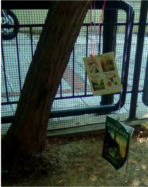
Εικόνα 43: Βιβλιόδεντρο.