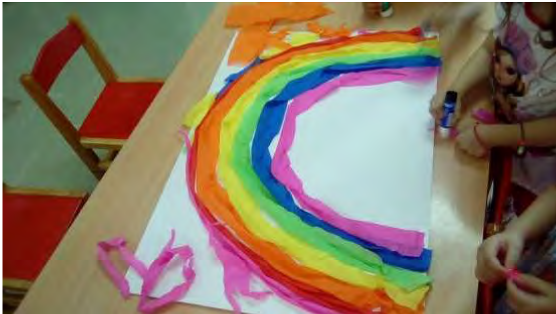
Εικόνα 26: Ουράνιο τόξο.

Σε ένα δεύτερο μακετόχαρτο, το οποίο αναπαριστούσε τον εξωτερικό τοίχο, κατασκευάστηκε το ουράνιο τόξο με χαρτί γκοφρέ (εικόνα 26).