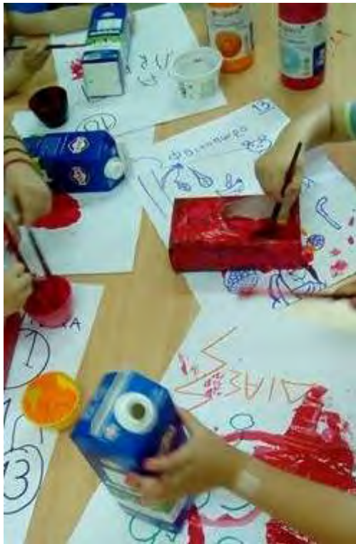
Εικόνα 41: Βάψιμο ταϊστρών.

Ακόμα, τοποθέτησαν σε διάφορα σημεία της αυλής, μπολάκια με νερό για τα ζώα ή πουλιά, που το είχαν ανάγκη.