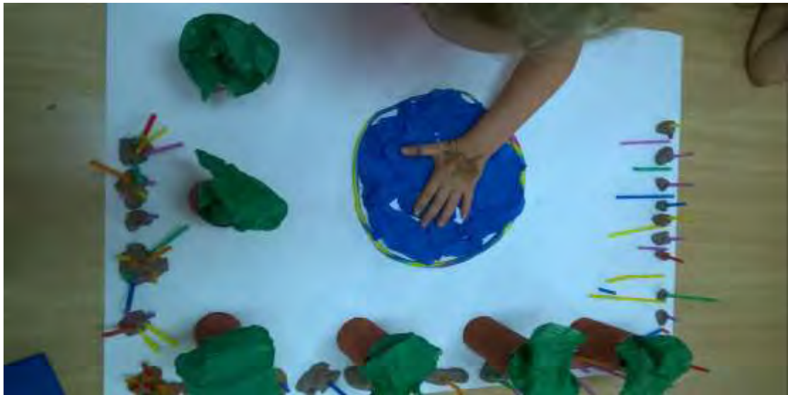
Εικόνα 21 : Δέντρα και πισίνα.

Προστέθηκε μια πισίνα από πλαστελίνη στη μέση της μακέτας, την οποία γέμισαν με μπλε χαρτί γκοφρέ (εικόνα 21).