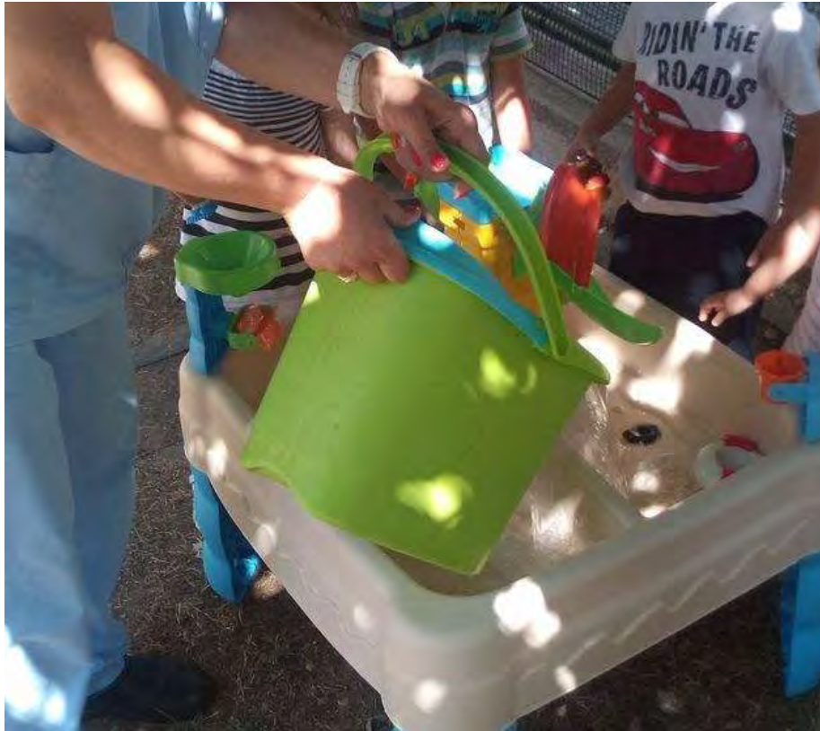
Εικόνα 39: Συνδρομή της καθαρίστριας στην παροχή νερού.