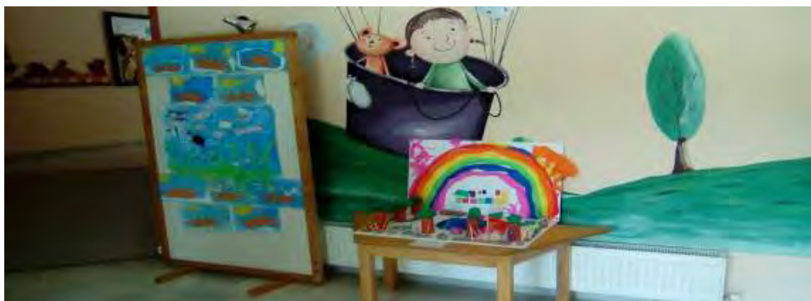
Εικόνα 29: Έκθεση της μακέτας των παιδιών στην είσοδο του παιδικού σταθμού.