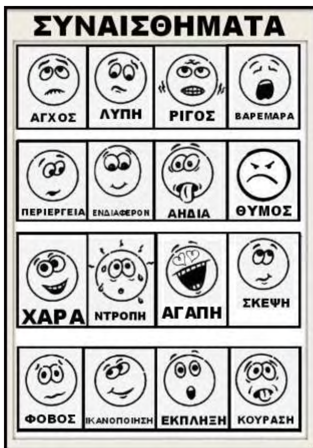
Εικόνα 3 : τα emoticons που χρησιμοποιήθηκαν κατά την διάρκεια συνέντευξης

Οι κάρτες με τα emoticons απλώθηκαν στο πάτωμα και τα παιδιά διάλεξαν από ένα. Τότε, η εκπαιδευτικός- ερευνήτρια ρώτησε για κάθε ένα από αυτά: «Πώς αισθάνεται το παιδάκι;», «Εσείς αισθανθήκατε το ίδιο (χαρά, λύπη, κούραση, φόβο, νύστα, αγάπη, κ.α.) με όλα αυτά που κάναμε για την αυλή μας;»