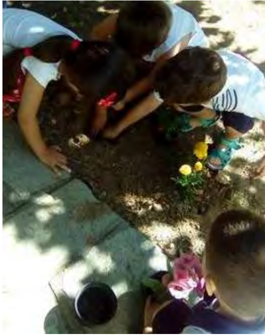
Εικόνα 35: Τα παιδιά απομακρύνουν τα χώματα.