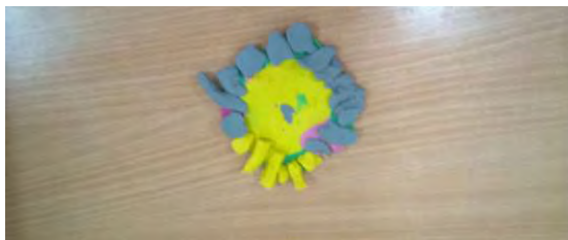
Εικόνα 12: Λουλούδι.