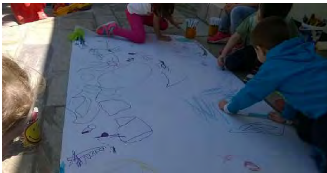
εικόνα 17 : Συλλογική ζωγραφική