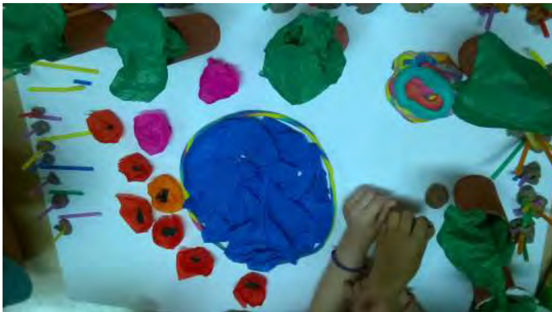
Εικόνα 32 : κατασκευή μακέτας

παιδιών, ενισχύοντας την διάθεσή τους για συμμετοχή στο πρόγραμμα και μετατρέποντας κάθε παιδί σε συνιδιοκτήτη του κοινού οράματος (εικόνα 32). Η βιωματική εμπλοκή των παιδιών στην διαμόρφωση της καινούριας αυλής, μέσα από την υλοποίηση του οράματός τους, εξέφρασε την δέσμευσή τους απέναντι στον χώρο που τα περιβάλλει άμεσα, δίνοντάς τους τη δυνατότητα να τον επηρεάσουν, να αλλάξουν το σκηνικό του καθημερινού παιχνιδιού τους, αλλά και της καθημερινής σχολικής ζωής τους, γενικότερα.