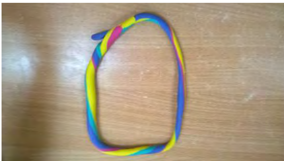
Εικόνα 14: Πισίνα.