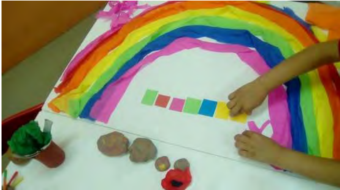
Εικόνα 27: Βιβλιοθήκη.

Τέλος, προστέθηκαν τα βιβλία της βιβλιοθήκης στον εξωτερικό τοίχο, φτιαγμένα από μικρά κομμάτια χαρτόνι (εικόνα 27).