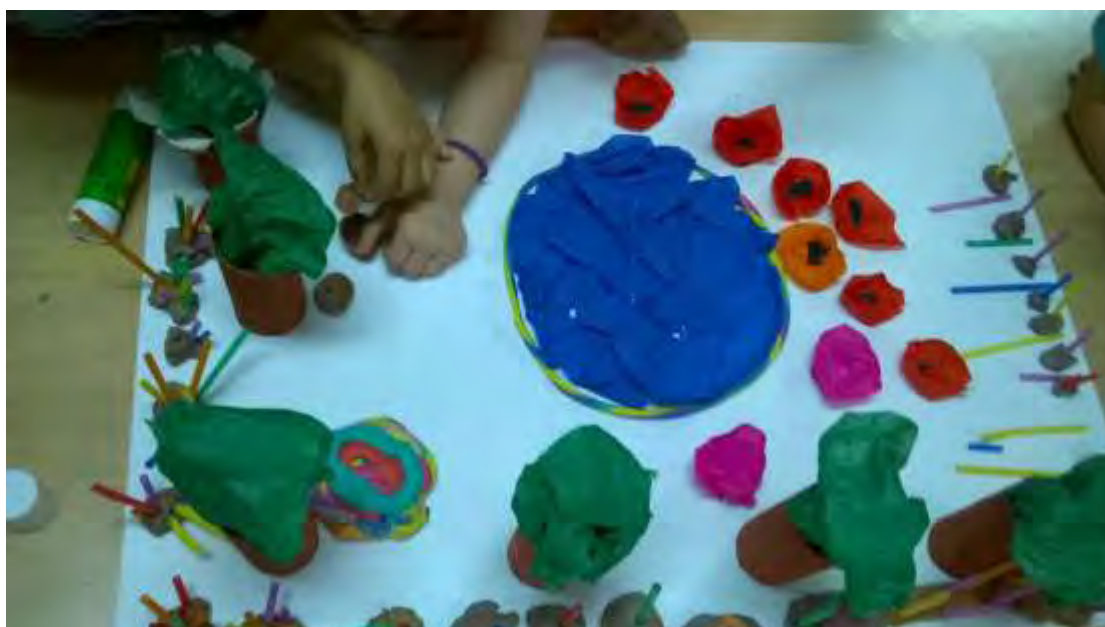
Εικόνα 24: Ταΐστρες για τα ζώα.

Τοποθετήθηκαν οι ταΐστρες για τα ζώα από πλαστελίνη (εικόνα 24).