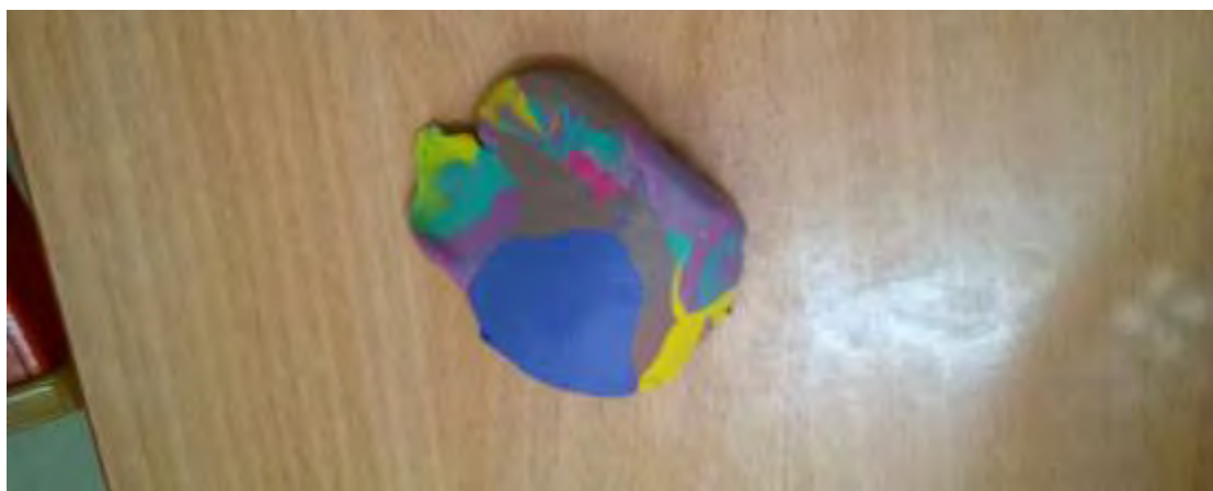
Εικόνα 11: Τραμπολίνο με τσουλήθρα.