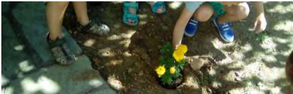
Εικόνα 36: Τα παιδιά φυτεύουν.