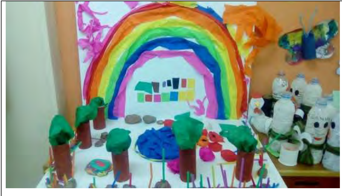
εικόνα 28: Ολοκληρωμένη μακέτα.