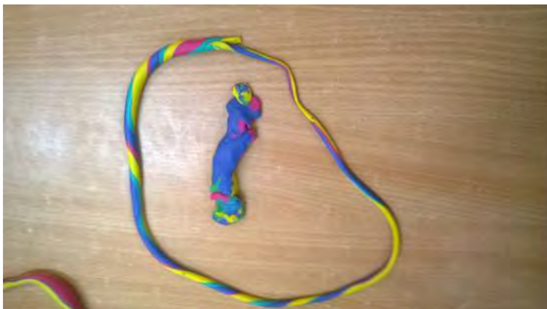
Εικόνα 10: Πίσίνα με ψάρι.