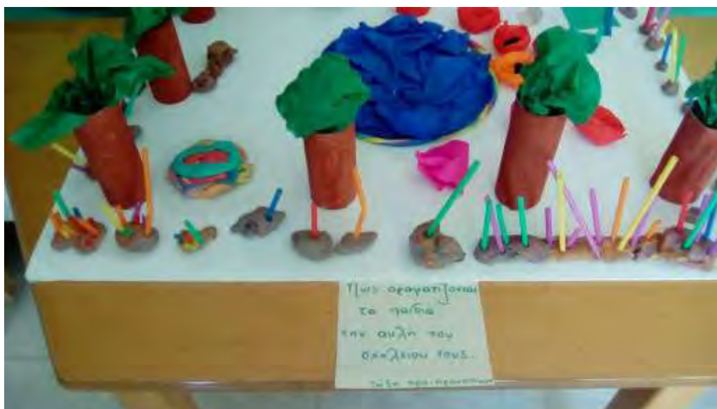
Εικόνα 30: Επεξηγηματικό σημείωμα.