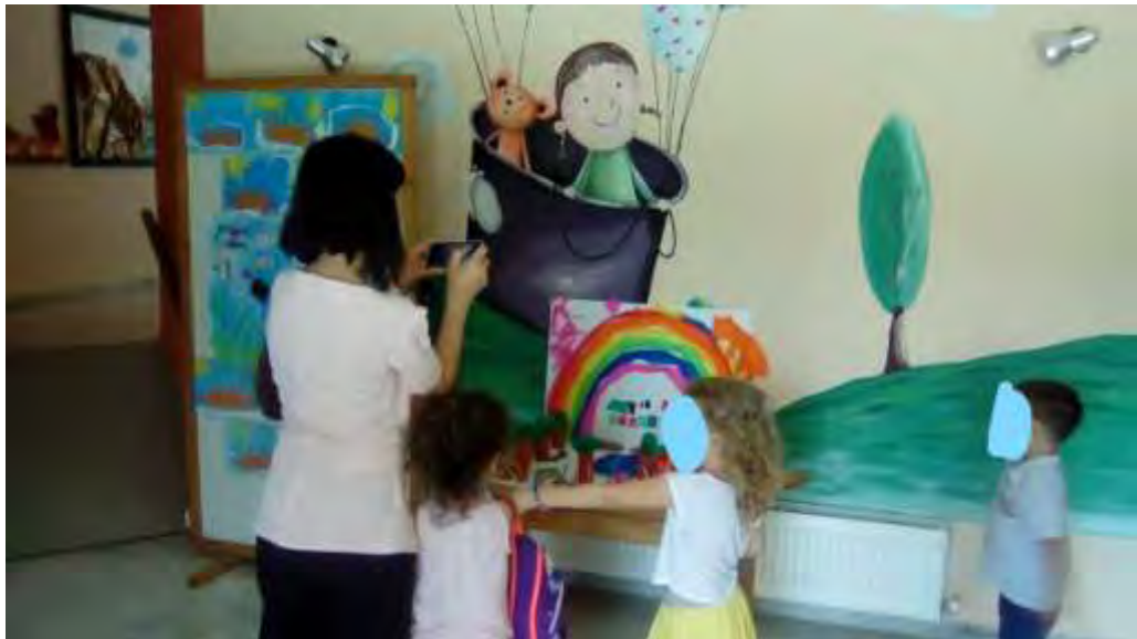
Εικόνα 31 : έκθεση της μακέτας στην είσοδο του σχολείου και παρουσίασή της από τα παιδιά

Κατά τη διάρκεια του β' κύκλου, αφού είχαν εξοικειωθεί με την κατασκευή της μακέτας, τα παιδιά είχαν συνεχώς καινούριες ιδέες, τις οποίες πρόσθεταν με αυτοπεποίθηση πάνω στη μακέτα, φτιαγμένες κυρίως από πλαστελίνη: «αυτά είναι τα μαξιλάρια», «αυτή είναι η τροφή για τα ζώα». Επίσης, τα παιδιά με ενθουσιασμό απαντήσαν στους γονείς, όταν τα ρώτησαν «τι είναι αυτό», βλέποντας στην είσοδο του σχολείου τη μακέτα, που απεικονίζει το όραμά τους για την αυλή, θεωρώντας προσωπικό τους επίτευγμα την κατασκευή της μακέτας. «Εδώ είναι οι καναπέδες, τα βιβλία μας...» (εικόνα 31).