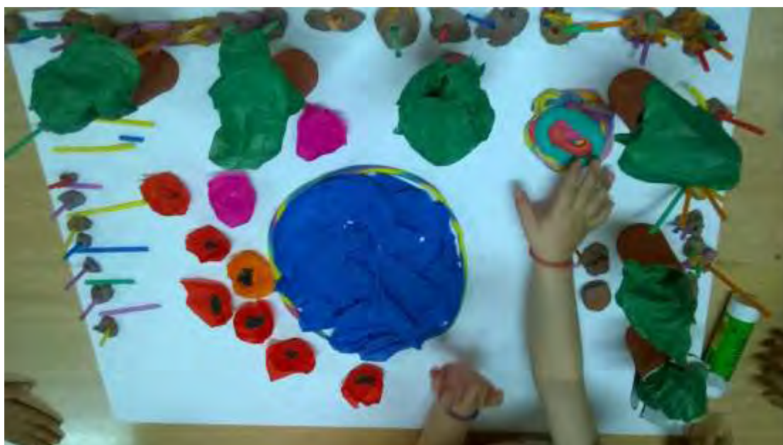
Εικόνα 23: Τραμπολίνο.

Προστέθηκε ένα τραμπολίνο από πλαστελίνη κάτω από το δέντρο «για να έχει σκιά», όπως είπε ένα παιδί (εικόνα 23).