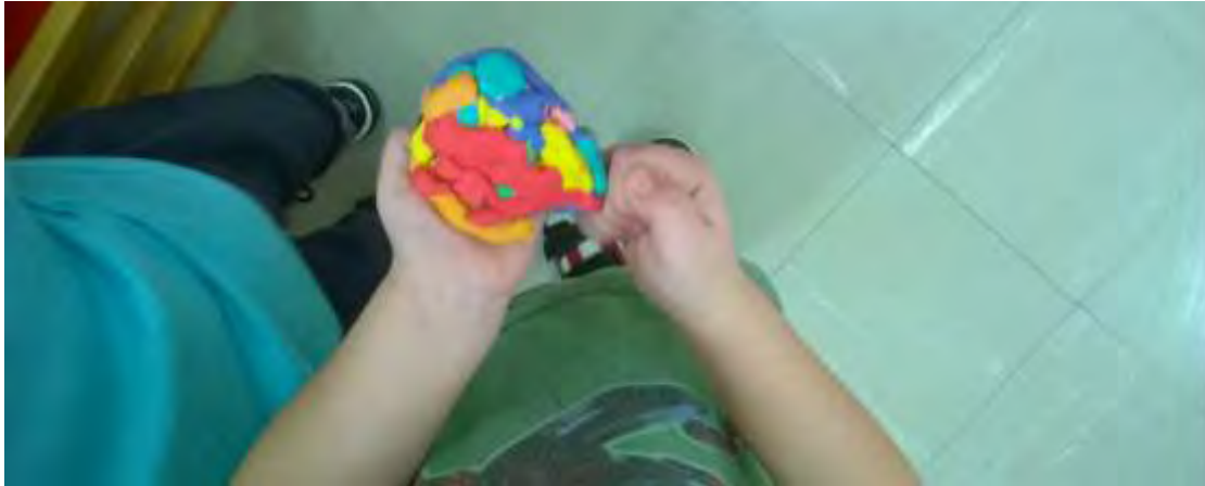
Εικόνα 7: Τραμπολίνο.

Δόθηκε η δυνατότητα στα παιδιά να παρουσιάσουν τις ιδέες τους χρησιμοποιώντας πλαστελίνη, η οποία, λόγω της πλαστικότητάς της, διευκολύνει την έκφραση των παιδιών (εικόνες 7 έως 14).