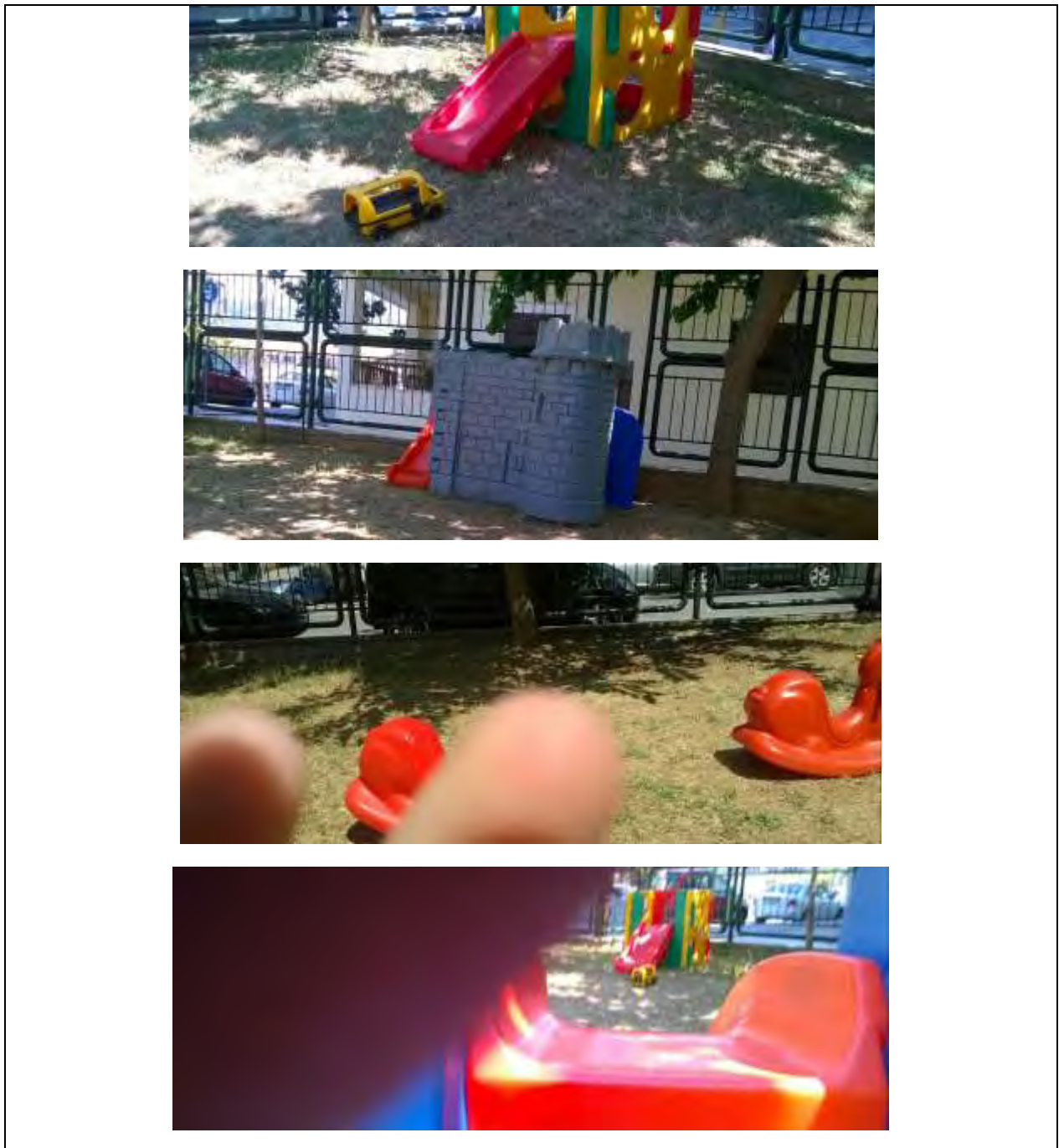
Εικόνα 4: Φωτογράφιση από τα παιδιά.

φωτογραφίες αυτή, με ό,τι περιέχει. Από τα 10 παιδιά, της ερευνητικής ομάδας, συμμετείχαν τα 7, αφού τα 3 δεν επιθυμούσαν να συμμετέχουν. Τα παιδιά ήταν πρόθυμα να βγάλουν φωτογραφίες, αλλά φάνηκε πως δεν είναι εξοικειωμένα με τη λήψη φωτογραφιών. Τα περισσότερα φωτογράφησαν την τσουλήθρα και το κάστρο που υπήρχε στην αυλή (εικόνα 4). Σταδιακά, τα παιδιά φάνηκαν να εξοικειώνονται με τη διαδικασία της φωτογράφισης.