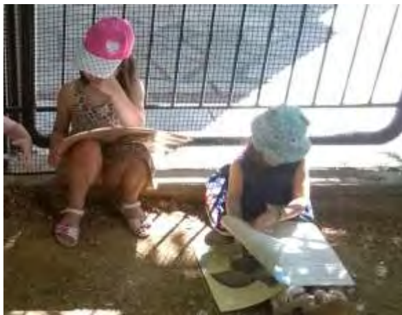
Εικόνα 44: Τα παιδιά διαβάζουν.