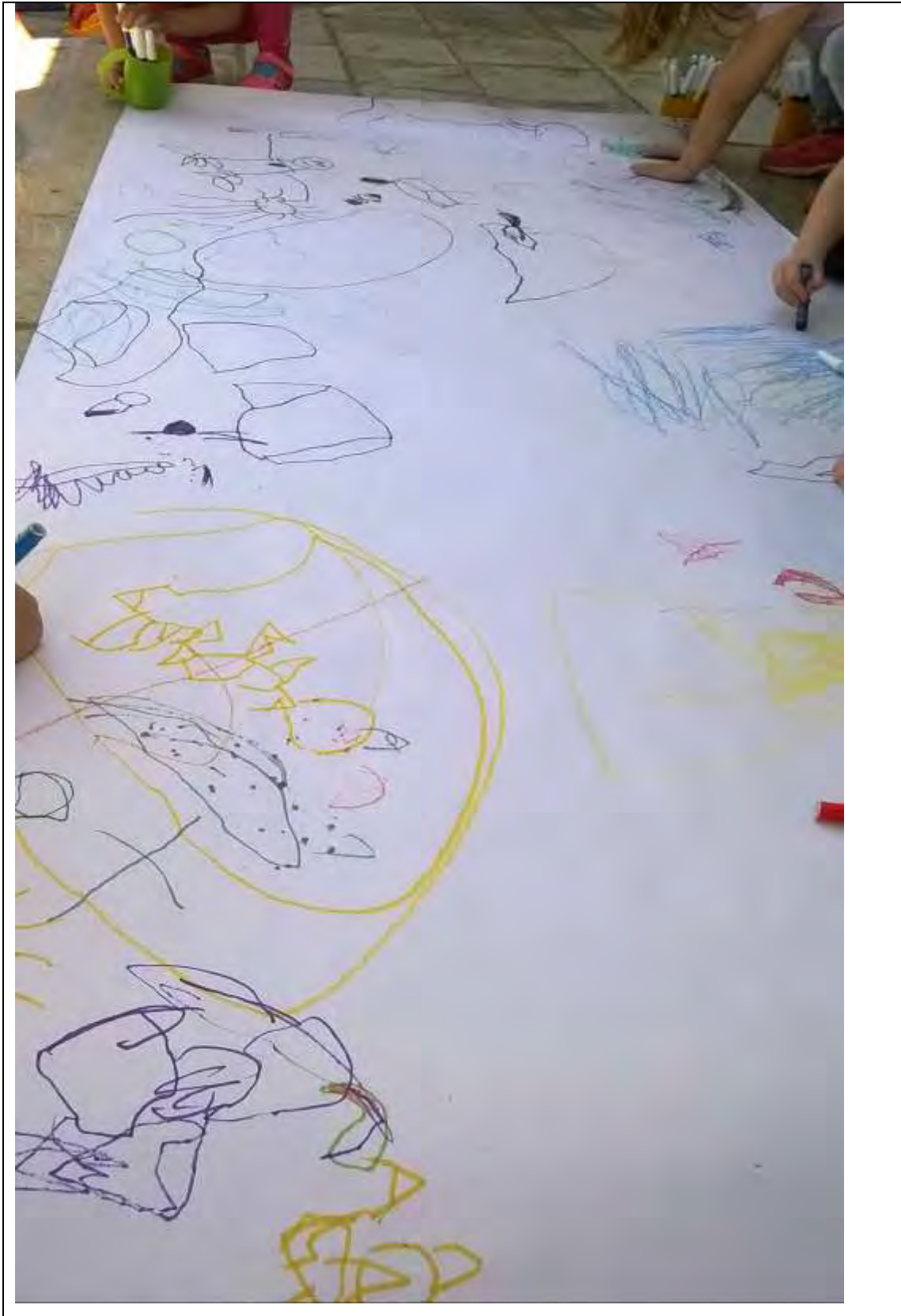
Εικόνα 6: Συλλογική ζωγραφική