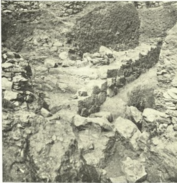
Εἰκ. 2. Ἐπιπέδους τῶν ἐρειπίων.