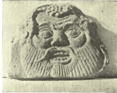
Εἰκ. 18. Ἀκροκέραμος

κέραμοι, εἰς οὓς κατέληγον, ἦσαν κεκοσμημένοι ἐναλλάξ διὰ προτομῶν Σιληνῶν καὶ δι' ἀνθεμίων. Τὸ μέγα πλῆθος τούτων εὐρέθη νοτιῶς καὶ ἀνατολικῶς τοῦ οἰκοδομήματος. Ἡ προτομὴ τοῦ Σιληνοῦ, τὴν ὁποίαν ἀπεικονίζω (εἰκ. 18) ἀνευρέθη μετ' ἄλλων ὁμοίων πρὸς ἀνατολὰς καὶ πλησίον τοῦ τοίχου Σ. Νομίζω ὅτι ἤδη ἀπὸ τοῦδε δυνάμεθα νὰ ἀποδώσωμεν ἴσως τὴν κεράμωσιν ταύτην εἰς τὸ μεγαλύτερον τοῦτο οἰκοδόμημα καὶ νὰ τάξωμεν αὐτὸ εἰς τὸ 2 ον ἡμισυ τοῦ 6 ου π.Χ. αἰῶνος, τοὺς χρόνους δηλαδὴ τοὺς ὁποίους μᾶς δίδει ἡ προτομὴ τοῦ Σιληνοῦ. Ἡ χρονολογία αὕτη συμβιβαζομένη ἀπολύτως πρὸς τὴν τοιχοδομίαν ἐνισχύεται καὶ ὑπὸ μιᾶς ἄλλης παρατηρήσεως : εἰς τὴν γωνίαν μεταξὺ τῶν τοίχων Β καὶ Σ, ἔνθα τὸ φυσικὸν ἔδαφος εἶχεν ἀνασκαφῆ διὰ τὴν θεμελίωσιν τῶν δύο τούτων τοίχων (εἰκ. 6), συνέλεξα ὄλον τὸ ὑπάρχον χῶμα μετὰ τῶν ἐν αὐτῷ ὑπαρχόντων ὀλίγων ὄστρακων, τὰ ὁποῖα προφανῶς ἦσαν παλαιότερα τοῦ οἰκοδομήματος· ἦσαν δὲ ταῦτα τεμάχια ἐκ μεγάλων πίθων τοῦ 7 ου αἰ. καὶ ἐν μόνον μελαμβαφῆς μικρὸν ὄστρακον — τὸ νεώτατον πάντων, οὐχὶ ἀπολύτως χρονολογίσιμον ἀλλὰ δυνάμενον νὰ ἀνήκη εἰς μελανόμορφον ἀγγεῖον.