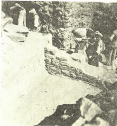
Εἰκ. 7. Ὁ τοίχος Β καὶ ἡ μετὰ τοῦτον προέκτασις τοῦ τοίχου Σ.

μέχρι μεγάλων λίθων γρανίτου, τῶν ὁποίων αἱ ἀκμαί, οὐχὶ κανονικοῦ σχήματος δὲν ἐφάπτονται ἀμέσως πρὸς τὰς τῶν γειτονικῶν λίθων ἀλλ' ἀφήνουν κενὰ πληρούμενα συνήθως δι' ἐπαλλήλων κανονικῶν πλακιδίων ἢ καὶ ἀκανονίστων μικρῶν λίθων.