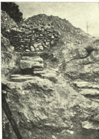
Εἰκ. 12. Τοῖχος ἀνατολικοῦ τμήματος.

Ἡ τοιαύτη καταστροφή, εἰς ἣν οὐκ ὀλίγον συνήργησε καὶ ἡ ἀπὸ τῆς