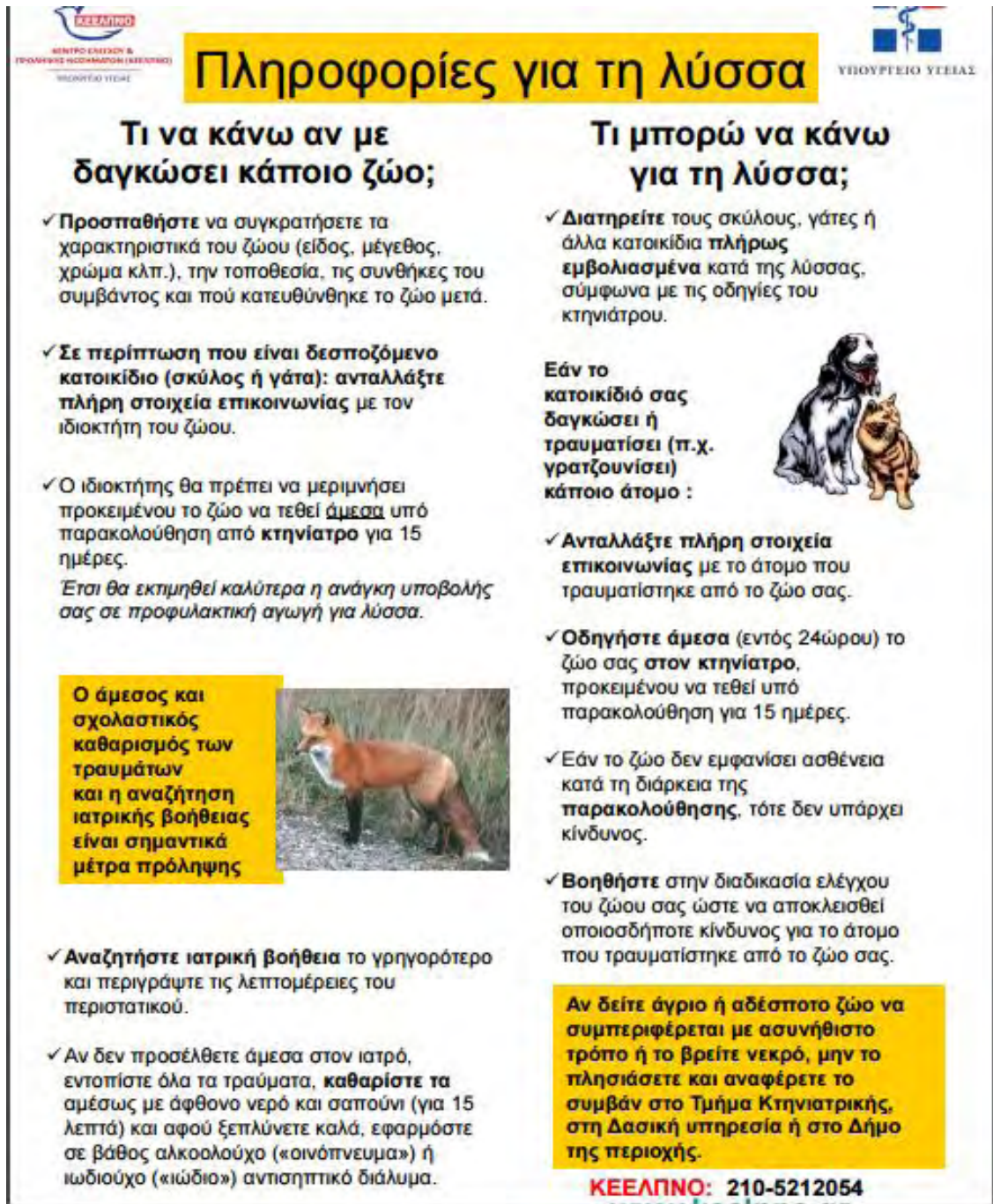
Εικόνα 1. Ενημερωτική αφίσα για τη Λύσσα, ΚΕΕΛΠΙΝΟ

Τα έτη 2013 και 2014 εφαρμόστηκε πρόγραμμα εμβολιασμού κατά της λύσσας με τη χρήση εμβολίων-δολωμάτων μετά από εναέρια ρίψη σε 24 δημοτικά διαμερίσματα, όπου θεωρήθηκε ότι τα ζώα βρίσκονταν σε αυξημένο κίνδυνο να μολυνθούν και να νοσήσουν. Η συνολική επιφάνεια της περιοχής που καλύφθηκε από τη ρίψη εμβολίων-δολωμάτων ήταν περίπου 60.000 χλμ 2 . Η μέση πυκνότητα των εμβολίων-δολωμάτων που διανεμήθηκαν ήταν 22-25 εμβόλια-δολώματα χλμ 2 .