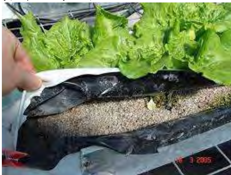
Εικόνα 32. Χρησιμοποίηση βρωμιούχου μεθυλίου σε μαρούλια.

Το βρωμιούχο μεθύλιο χαρακτηρίστηκε ως ουσία που καταστρέφει το όζον της ατμόσφαιρας, καταστρέφοντας το στρώμα που εμποδίζει την υπεριώδη ακτινοβολία να φτάσει στην επιφάνεια της γης. Το 1992 το βρωμιούχο μεθύλιο μπήκε στη λίστα των υπό έλεγχο ουσιών του πρωτοκόλλου του Μόντρεαλ και αποφασίστηκε η σταδιακή μείωση της παραγωγής του ώστε το 2005 να πάψει να χρησιμοποιείται στις ανεπτυγμένες χώρες και το 2015 να σταματήσει η χρησιμοποίησή του στις αναπτυσσόμενες (Σταμόπουλος, 2008).