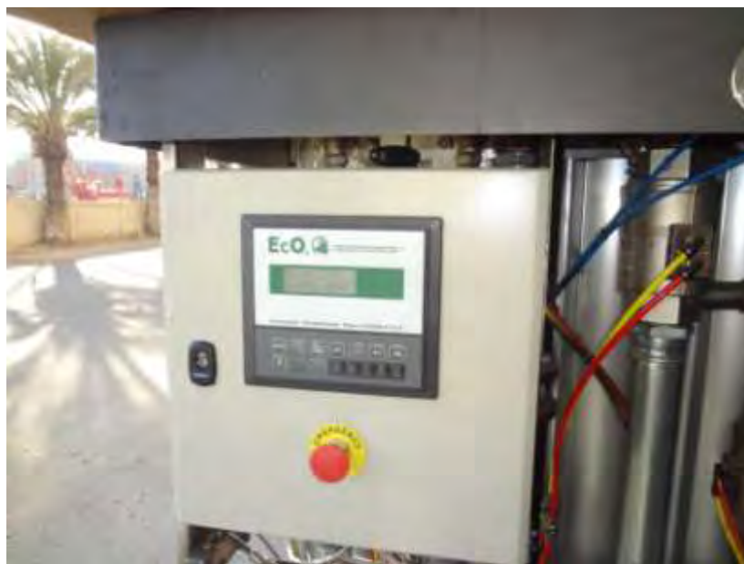
Εικόνα 20. Δημιουργία κενού με παραγωγή CO 2