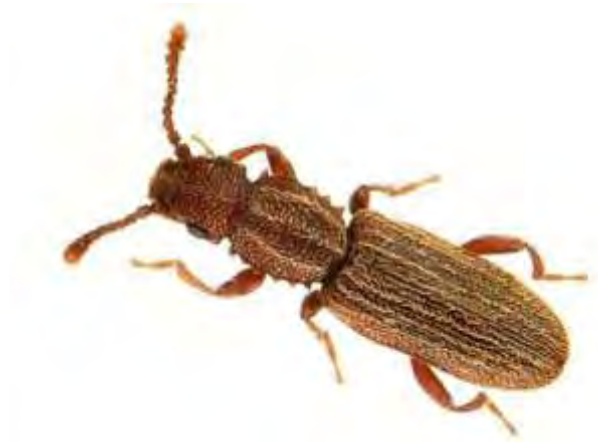
Εικόνα 6. Ακμαίο Oryzaephilus surinamensis .

σπόρων, ενώ είναι δυνατόν να καταστρέψουν κριθάρι ζυθοποιίας και σπόρους που προορίζονται για σπορά (Σταμόπουλος, 1999).