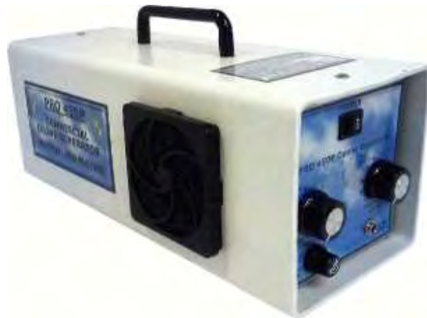
Εικόνα 19. Μηχάνημα δημιουργίας κενού.