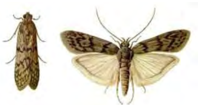
Εικόνα 12. Ακμαίο Ephestia (Anagasta) kuehniella .

Προσβάλλει άλευρα, σπόρους (σίτου, αραβοσίτου), ξηρούς καρπούς, όσπρια, πίτουρα και τη γύρη στις κυψέλες των μελισσών. Στους σπόρους προκαλεί μεγάλα εκτεταμένα φαγώματα. Τέλος μπορεί να μπλοκάρει και τις μηχανές στις αλευροβιομηχανίες με τους πυκνούς ιστούς που πλέκει.