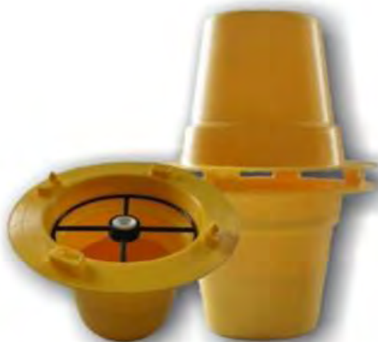
Εικόνα 30. Παγίδα τύπου Pitfall.

Υπάρχουν δύο τύποι παγίδων κυρίως για τα κολεόπτερα και τις έρπουσες προνύμφες. Η παγίδα από κυματοειδές χαρτόνι είναι ειδική παγίδα για κολεόπτερα σε σιλό ή σωρούς σιτηρών. Ο δεύτερος τύπος έχει σχήμα δειγματοληπτικής σόντας κι έτσι μπορούμε να τη βυθίσουμε σε διάφορα βάθη μέσα στο προϊόν προϊόν που βρίσκεται σε σωρούς (π.χ. σπόροι σιτηρών). Οι παγίδες για τα βαδίζοντα έντομα πρέπει να τοποθετούνται πάνω στο προϊόν (σωρούς, σάκους) ή κάτω από τα μηχανήματα ή τις παλέτες.