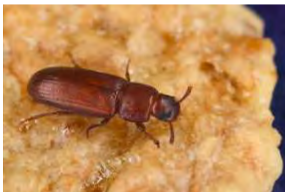
Εικόνα 1. Ακμαίο Tribollium castaneum .

Είναι ένας από τους σημαντικότερους εχθρούς των αποθηκευμένων προϊόντων και απαντάται σε οικίες, σε βιομηχανίες τροφίμων αλλά και σε μεγάλους αποθηκευτικούς χώρους. Το έντομο αυτό είναι κατά κύριο λόγο έντομο των θερμών κλιμάτων. Τα προϊόντα τα οποία μπορούν να προσβάλουν είναι μπιζέλια, φασόλια, δημητριακά, αμύγδαλα, αλεύρι σιταριού, σιμιγδάλι, σπασμένους σπόρους σιτηρών, ξηρά λαχανικά, σοκολάτα, κακάο κ.α. . Οι ζημιές είναι σημαντικότερες όσο η σχετική υγρασία των σπόρων είναι υψηλότερη. Μπορούν να δώσουν μια δυσάρεστη γεύση και οσμή στο προϊόν από την έκκριση ουσιών από τους αδένες τους. (Baldwin, 2010). Το είδος αυτό προσβάλλει σχεδόν όλα τα είδη τροφίμων, κυρίως όμως βρίσκεται σε τρόφιμα φυτικής προέλευσης, με μεγάλη περιεκτικότητα σε άμυλο. Μπορεί επίσης να προκαλέσει ζημιές και σε προϊόντα που βρίσκονται σε ράφια καταστημάτων. Να αναφερθεί ότι το έντομο αυτό αναπτύσσεται καλύτερα και ταχύτερα σε σπασμένους παρά σε ολόκληρους σπόρους όπου η παρουσία του περισπερμίου φαίνεται ότι αποτελεί σημαντικό εμπόδιο για την είσοδο στο εσωτερικό τους (Aitken, 1975).