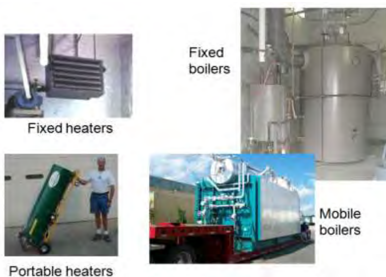
Εικόνα 21. Απεντόμωση με την μέθοδο υψηλών θερμοκρασιών.

Για την επίτευξη ικανοποιητικών αποτελεσμάτων, συνιστάται η απεντόμωση να διενεργείται κατά τη θερμή περίοδο του έτους, οπότε η εξωτερική θερμοκρασία είναι αρκετά υψηλή (30-35°C). Αντίθετα, κατά την ψυχρή περίοδο, η επίτευξη υψηλών θερμοκρασιών μέσα στις αποθήκες για επιτυχή απεντόμωση αποβαίνει δύσκολη και δαπανηρή. Η απεντόμωση με θερμότητα δεν δίνει καλά αποτελέσματα για προϊόντα υγρά, συμπαγή ή συσκευασμένα σε κιβώτια, δέματα κ.λ.π. καθώς δυσχεραίνονται η διείσδυση της θερμότητας μέσα τους και η επίτευξη των επιθυμητών θερμοκρασιών απεντόμωσης. Στις περιπτώσεις αυτές, μπορεί να εφαρμοστεί η διοχέτευση θερμού ρεύματος αέρα.