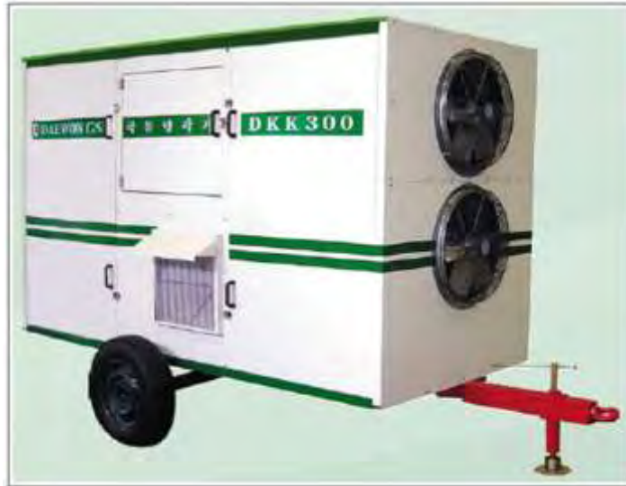
Εικόνα 22. Απεντόμωση με χρήση χαμηλών θερμοκρασιών.