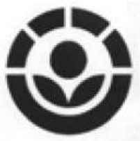
Εικόνα 24 Ειδική σήμανση προϊόντων στα οποία έχει γίνει χρήση ακτινοβολίας

Η απεντόμωση βρώσιμων γεωργικών προϊόντων με ακτινοβολία, έχει τύχει μερικής εφαρμογής από ετών σε μερικές χώρες (Η.Π.Α., Ρωσία κ.α.) με ικανοποιητικά αποτελέσματα. Στην Ελλάδα έχουν γίνει δοκιμές από το βιολογικό εργαστήριο του «Δημόκριτου» για την απεντόμωση ξερών σύκων. (Εμμανουήλ και Μπουχέλος, 1996).