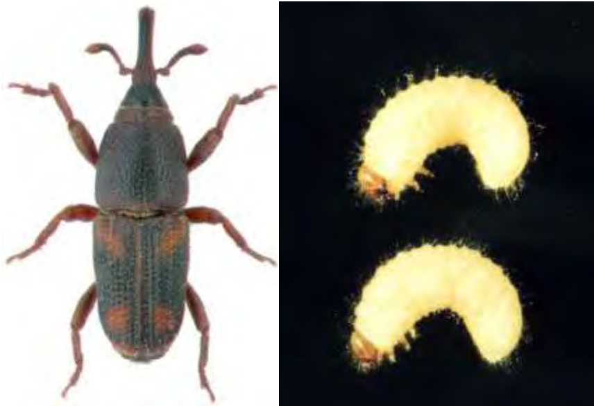
Εικόνα 11. Αριστερά ακμαίο Sitophilus oryzae , Δεξιά προνύμφη Sitophilus oryzae .