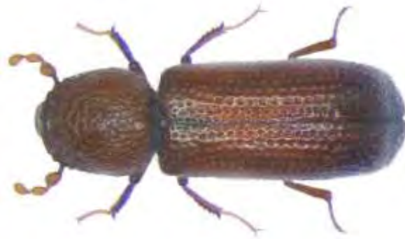
Εικόνα 9. Ακμαίο Rhyzopertha dominica .