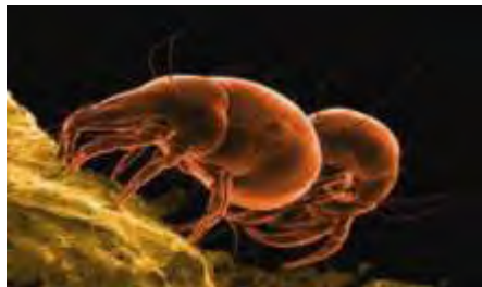
Εικόνα 18. Ακμαίο Acarus siro .

Εκτός από τα σιτηρά το άκαρι αυτό προσβάλλει ζωικές τροφές με υψηλή περιεκτικότητα σε πρωτεΐνες, ξηρά φρούτα και καπνό.