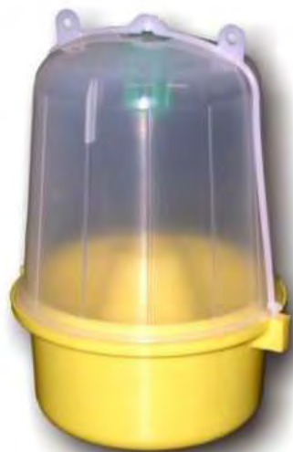
Εικόνα 29. Παγίδα τύπου McPhail.