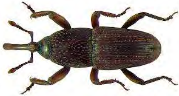
Εικόνα 10. Ακμαίο Sitophilus granaries .