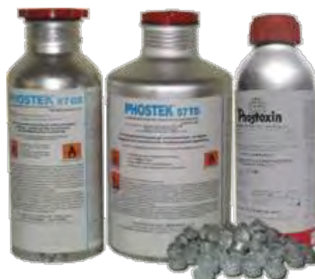
Εικόνα 31. Σκεύασμα Φωσφίνης

Πρόκειται για ένα άχρωμο αέριο, πολύ τοξικό με οσμή ασετιλίνης ή σκόρδου. Είναι ένα δηλητήριο που δεν προκαλεί χρόνια δηλητηρίαση αλλά μόνο οξεία, χωρίς να υπάρχει κάποιο αντίδοτο, γι' αυτό θα πρέπει να τηρούνται όλες οι προφυλάξεις κατά την εφαρμογή της, όπως το σφράγισμα της αποθήκης, η απομάκρυνση των ανθρώπων μέσα στο χρονικό διάστημα 3 ωρών από το άνοιγμα των κονσερβών και να μην υπάρχουν νερά στο χώρο της απεντόμωσης. Οι ιδιότητες της φωσφίνης μαζί με το χαμηλό μοριακό της βάρος (34,04) και με ειδικό βάρος (1,214) παρόμοιο με αυτό του αέρα, ευνοούν την ομοιόμορφη εξάπλωσή της στο χώρο και την εύκολη διείσδυσή της στα προϊόντα.