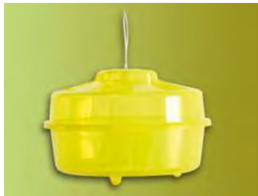
Εικόνα 27. Παγίδα με τροφικά ελκυστικά