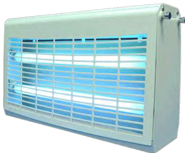
Εικόνα 28. Ηλεκτρική Παγίδα.