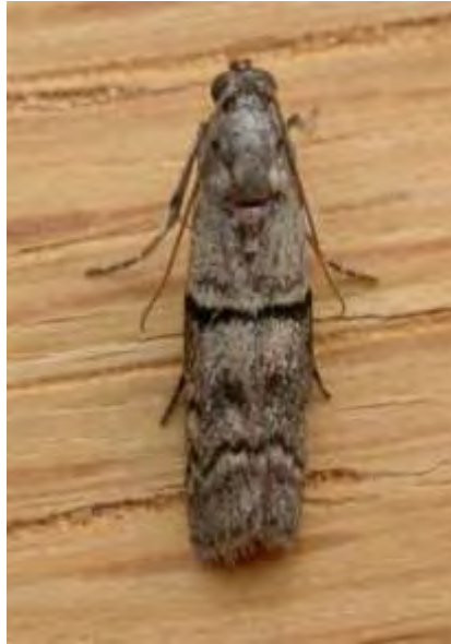
Εικόνα 13. Ακμαίο Ephestia elutella .