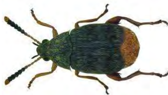
Εικόνα 15. Ακμαίο Acanthoscelides obtectus .

Προσβάλλει όλα τα είδη των οσπρίων αλλά ειδικότερα τα φασόλια και τη σόγια.