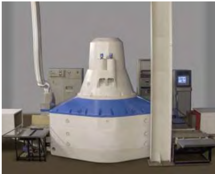
Εικόνα 25. Παραγωγή ακτινοβολίας για απεντόμωση.