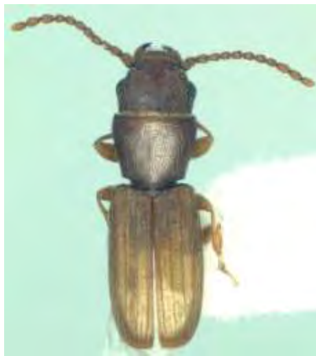
Εικόνα 8. Ακμαίο Cryptolestes spp..