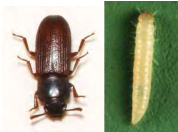
Εικόνα 2. Αριστερά ακμαίο Tribolium confusum , Δεξιά προνύμφη Tribolium confusum .