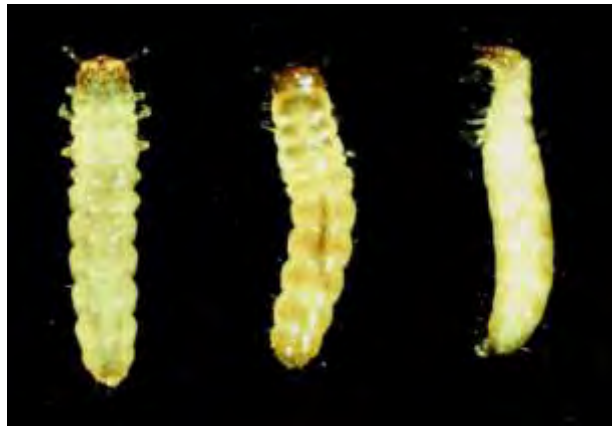
Εικόνα 7. Προνύμφες Oryzaephilus surinamensis .