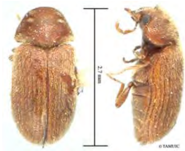
Εικόνα 17. Ακμαίο Stegobium paniceum .