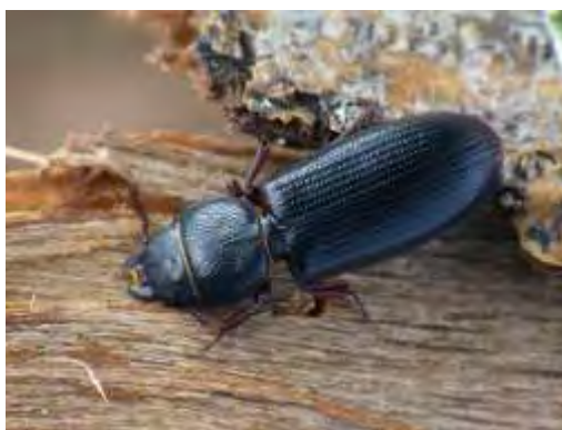
Εικόνα 3. Ακμαίο Tenebrioides (Trogosita) mauritanicus .