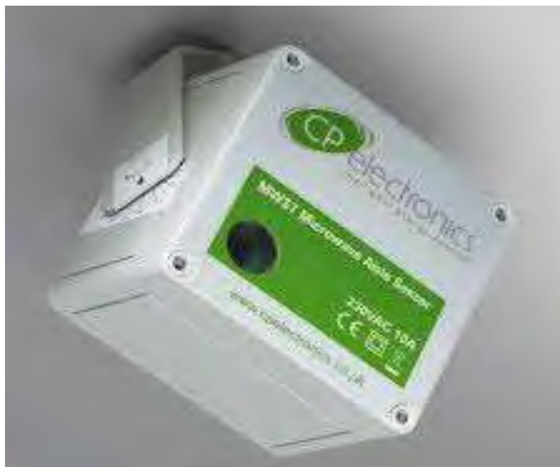
Εικόνα 23. Συσκευή παραγωγής ρεύματος υψηλής συχνότητας και μεγάλης έντασης.

Τα μηχανήματα αυτά είναι εφοδιασμένα με αυτόματους ρυθμιστές, με τους οποίους ρυθμίζεται η ένταση του δημιουργούμενου ρεύματος, ανάλογα με το προϊόν και το είδος του εντόμου.