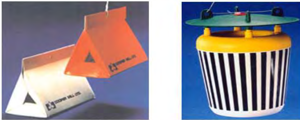
Εικόνα 26. Αριστερά παγίδα Τύπου «δέλτα», Δεξιά παγίδα Τύπου «χοάνης».

σκόνη. Οι παγίδες για ιπτάμενα έντομα είναι περισσότερο αποτελεσματικές όταν βρίσκονται κρεμασμένες στις γωνίες της κατασκευής και σε ύψος 2,20 – 2,50 μέτρα από το δάπεδο.