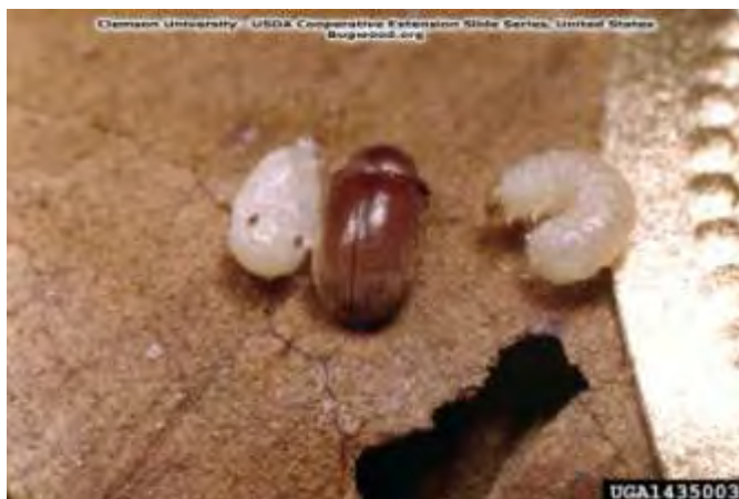
Εικόνα 16. Αριστερά πλαγγόνα, στο κέντρο ακμαίο, δεξιά προνύμφη Lasioderma serricorne .

Η προνύμφη καθώς και το ακμαίο κατατρώγουν τον καπνό στο βάθος των καπνοδεμάτων. Προσβάλλει κυρίως όλα τα προϊόντα του καπνού και του κακάο. Μικρές προσβολές συναντάμε σε όσπρια, ζυμαρικά, ελαιώδεις σπόρους, αυτοφυή φυτά κ.α.