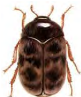
Εικόνα 4. Ακμαίο Trogoderma granarium .

Είναι πολύ σοβαρός εχθρός των αποθηκευμένων προϊόντων. Τα ακμαία δεν τρέφονται. Απαντώνται σε σιλό, αποθήκες και μύλους. Προσβάλλει όλους τους τύπους των σιτηρών, όσπρια και ξηρούς καρπούς. Τέλος είναι έντομο καραντίνας για πολλές χώρες.