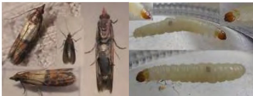
Εικόνα 14. Αριστερά ακμαίο Plodia interpunctella , Δεξιά προνύμφη Plodia interpunctella .

Βρίσκεται σε αποθήκες, μύλους, εργαστήρια επεξεργασίας τροφίμων κ.α. . Καταστρέφει τρώγοντας ξερές φυτικές ύλες και φρούτα, ξηρούς καρπούς, κακάο, σοκολάτες, γάλα σε σκόνη κ.α. .