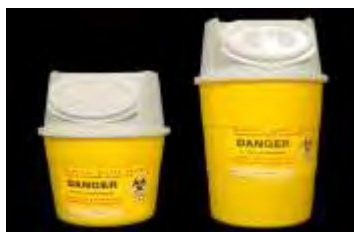
Εικόνα 1: Κουτί συλλογής αιχμηρών αντικειμένων ( http://www.asepta.gr/site/index )

Τα αιχμηρά αντικείμενα θα πρέπει να συλλέγονται σε αδιάτρητα, ανθεκτικά δοχεία, από κατάλληλο υλικό με καπάκι και ειδική σήμανση που πληροφορεί για το περιεχόμενο τους. Τα δοχεία αυτά είναι συνήθως κίτρινου χρώματος και στην εξωτερική τους πλευρά αναφέρουν την ημερομηνία και την προέλευση τους καθώς και το σήμα του βιολογικού κινδύνου. Σε περίπτωση που τα απόβλητα κατευθύνονται για αποτέφρωση η συσκευασία τους θα πρέπει να είναι χαρτοκυτίας και να φέρουν εσωτερική πλαστική επένδυση (εκτός PVC) τύπου HOSPITAL BOX (Coad, 1992).