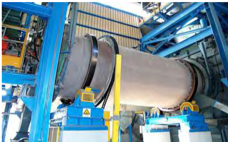
Εικόνα 3: Τμήμα καύσης ( http://www.eedsa.gr )

πυκνότητα, τη σύνθεση την ομοιογένεια κ.α. (Manyele et al. , 2011).