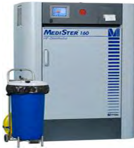
Εικόνα 4: Μηχάνημα αποστείρωσης των νοσοκομειακών αποβλήτων ( http://www.arvis.gr )