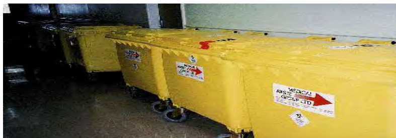
Εικόνα 2: Τροχήλατοι κάδοι ενδονοσοκομειακής μεταφοράς κλειστών σάκων απορριμμάτων

Στην ενδονοσοκομειακή μεταφορά τα απόβλητα μεταφέρονται από το χώρο παραγωγής τους μέχρι το χώρο της προσωρινής αποθήκευσής τους και η μεταφορά διενεργείται από έμπειρο και εκπαιδευμένο προσωπικό, με την χρησιμοποίηση ειδικών σημασμένων τροχήλατων κλειστού τύπου. Οι κάδοι θα πρέπει να διαθέτουν καπάκι και να χρησιμοποιούνται αποκλειστικά και μόνο για αυτόν τον σκοπό. Οποιαδήποτε μεταφορά σακών με τα χέρια απαγορεύεται και θα πρέπει να διενεργείται σε ξεχωριστό χρόνο με τη μεταφορά ασθενών ή άλλων υλικών. Για τη σωστή τήρηση υγιεινής των χώρων του νοσοκομείου, δεν θα πρέπει να γίνεται χρήση αγωγών απόρριψης αλλά ειδικών ανελκυστήρων αποβλήτων. Τέλος θα πρέπει να γίνεται καθημερινή απολύμανση των κάδων και η φύλαξη των γεμάτων σακών έτσι ώστε να μην συσσωρεύονται στους είναι οι διάδρομοι και το κλιμακοστάσιο του νοσοκομείου (Coad, 1992).