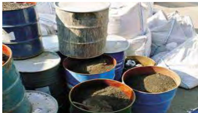
Εικόνα 5: Υπολείμματα από καύση νοσοκομειακών αποβλήτων ( http://www.eedsa.gr )

Τέλος για την μόλυνση του εδάφους δεν απαιτούνται ιδιαίτερα μέτρα, εκτός από τη συνεπή εφαρμογή του διαχωρισμού των απορριμμάτων ανά τύπο σύμφωνα με την Η.Π 37591/2031/1.10.2003 που καθορίζει τα μέτρα και τους όρους για τη διαχείριση ιατρικών αποβλήτων από υγειονομικές μονάδες.