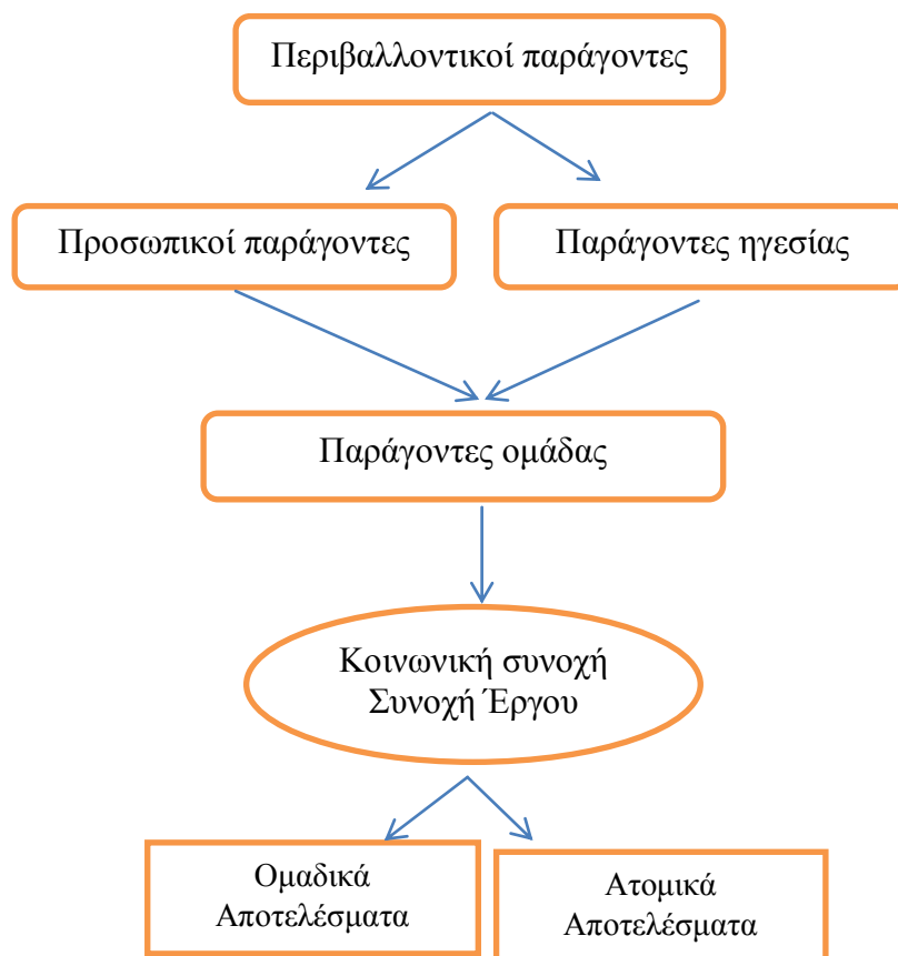
Σχήμα 1. Το Εννοιολογικό μοντέλο του Carron (1982)

Μεγάλο μέρος της έρευνας που πραγματοποιήθηκε σχετικά με τη συνεκτικότητα στον αθλητισμό διέπεται από ένα θεωρητικό μοντέλο που αναπτύχθηκε από τον Carron, το 1982 (Σχ.1).