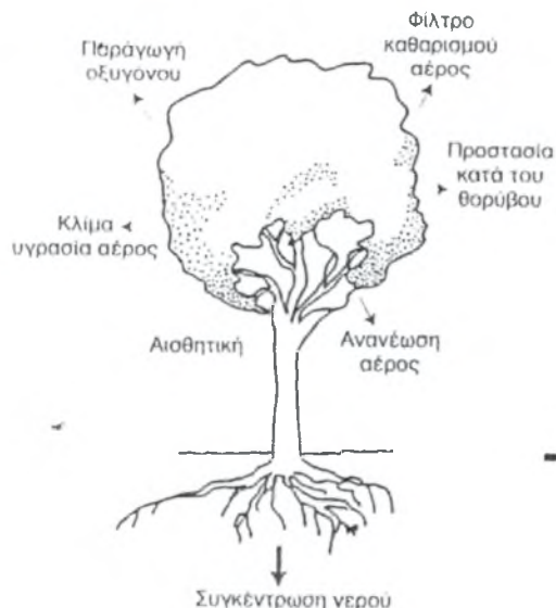
Σχήμα 2.1: Πολλαπλές υπηρεσίες δασικών οικοσυστημάτων