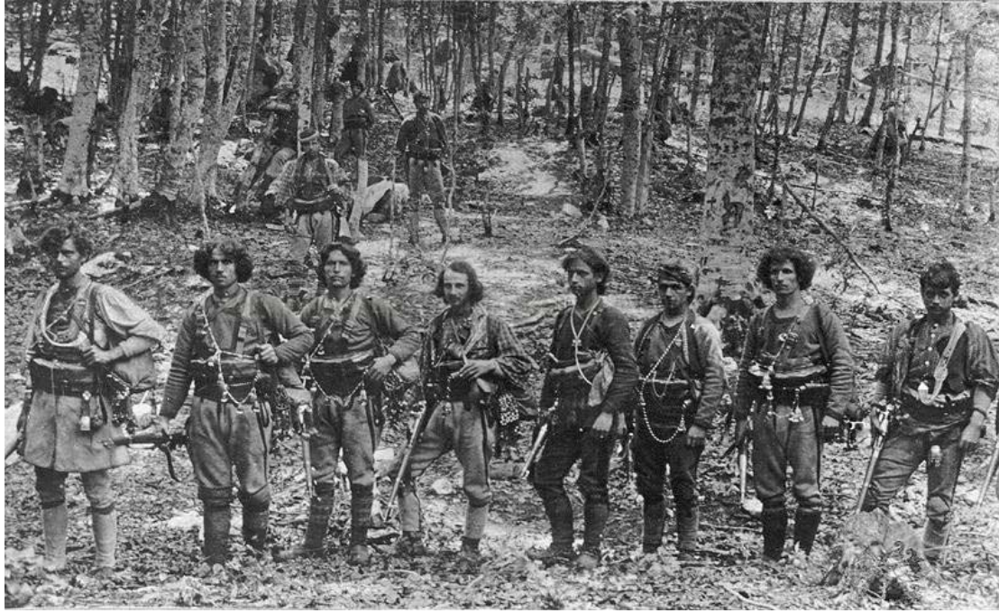
Εικόνα 6: Τσέτα ρουμανιζόντων το 1908 στη Βέροια (Ίδρυμα Μουσείου Μακεδονικού Αγώνα).