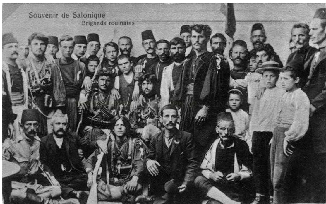
Εικόνα 5: Σώμα ρουμανιζόντων στη Θεσσαλονίκη κατά τη διάρκεια του Μακεδονικού Αγώνα.