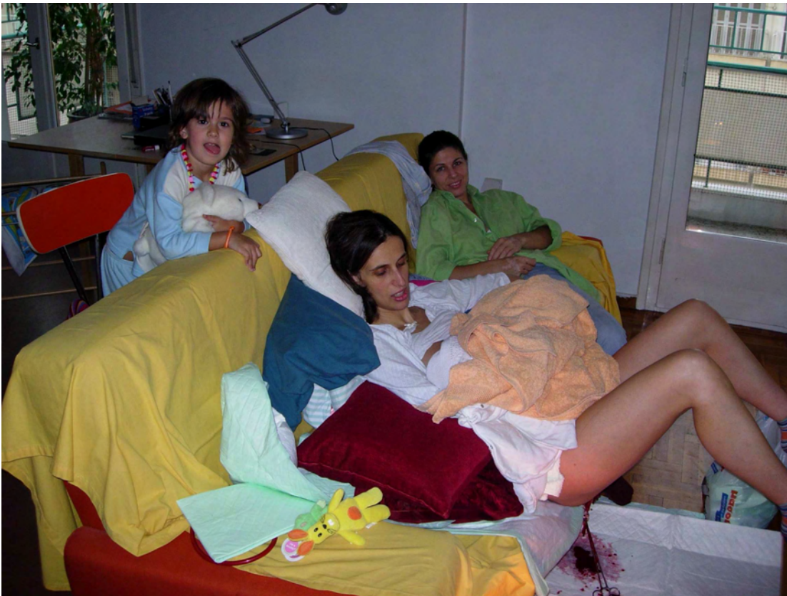
Η μαμά, η μαία η πρώτη κόρη και η δεύτερη στην αγκαλιά.