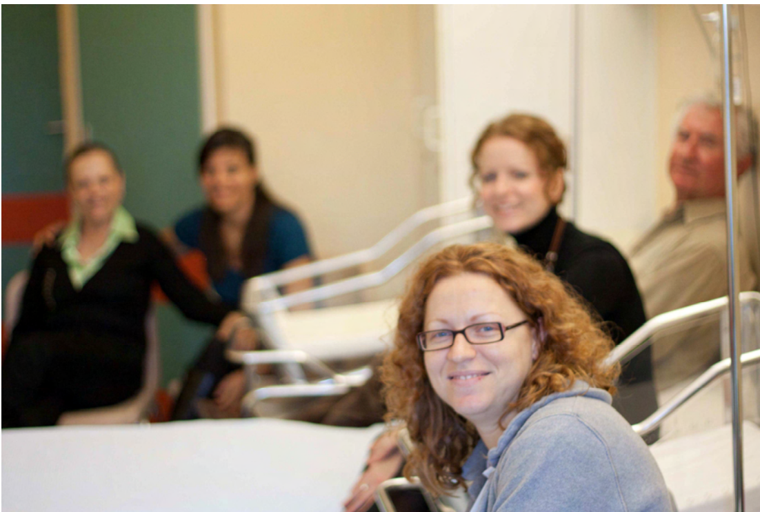
Η μαμά μετά τη γέννα στο νοσοκομείο