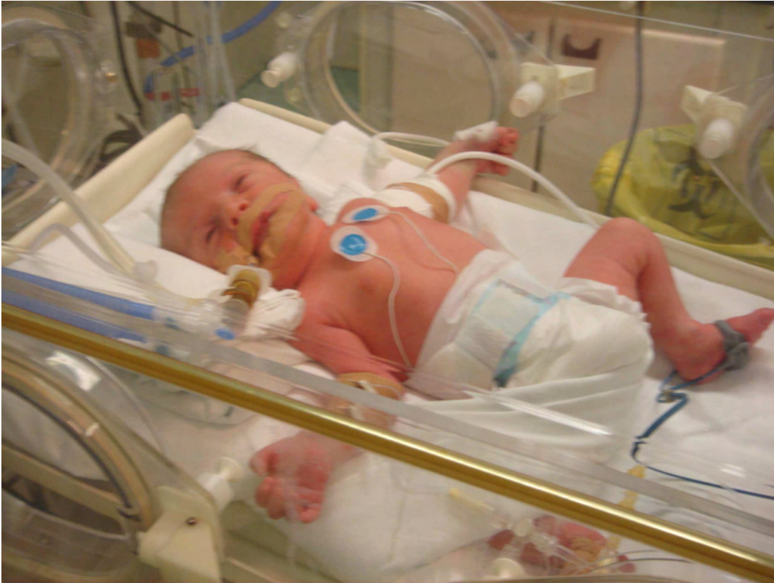
Λίγων ωρών σε άλλο νοσοκομείο από αυτό όπου βρίσκεται η μαμά