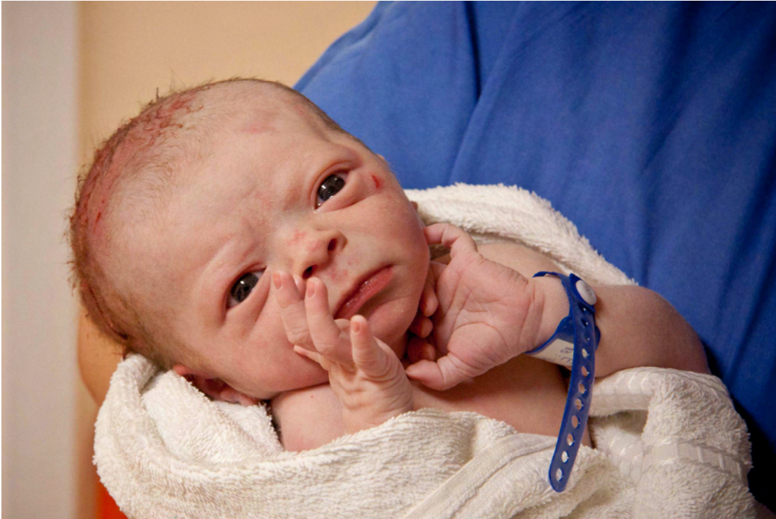
Μόλις γεννήθηκε, η μαία τον συστήνει στον μπαμπά και τους συγγενείς.