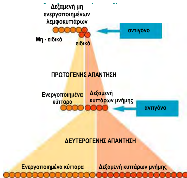
Σχήμα 1. Vaccines and Vaccinology Laurence Nicolas Spony / Dirk Knieps 2004.