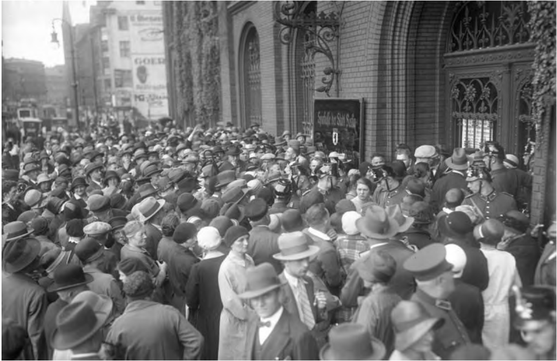
Εικόνα 3: Καταθέτες απαιτούν να αποσύρουν τις αποταμιεύσεις τους από μια τράπεζα στο Βερολίνο, στις 13 Ιουλίου του 1931.

Μετά το 1930, ωστόσο, η πολιτική αυτή απέτυχε, καθώς δεν ήταν δυνατόν να διατηρηθεί το υψηλό επίπεδο των δαπανών για δημόσια έργα. Τα επιτόκια αυξήθηκαν κάνοντάς το δύσκολο για τις ιδιωτικές και κρατικές επιχειρήσεις να διατηρήσουν τα προγράμματα δαπανών τους. Οι μισθοί τελικά άρχισαν να μειώνονται και η ομοσπονδιακή κυβέρνηση έπρεπε να αναλάβει ενεργό ρόλο μέσω της αύξησης των δημοσίων έργων. Παρόλα αυτά, δεν το έπραξε για μια σειρά λόγων, όπως ότι δεν υπήρχαν κατάλληλα δημόσια έργα να αναληφθούν και ότι η αύξηση των δαπανών για την κατασκευή, κάθε άλλο παρά βοηθάει το υπόλοιπο της οικονομίας μέσω «πολλαπλασιαστικών αποτελεσμάτων». Ο δανεισμός που απαιτούνταν για τη χρηματοδότηση των δαπανών της ομοσπονδιακής κυβέρνησης θα αύξανε τα επιτόκια, παραγκωνίζοντας ιδιωτικές δαπάνες των επιχειρήσεων, εμποδίζοντας την ανάκαμψη. Το 1930 ο γερουσιαστής Wagner ξαναπαρουσίασε το νομοσχεδίο του για την Σταθεροποίηση της Απασχόλησης μέσω της κατασκευής δημοσίων έργων έτσι ώστε να ανακουφιστεί η ανεργία, βλέποντας ως κύριο στόχο του νομοσχεδίου, την αύξηση των ομοσπονδιακών κατασκευαστικών δαπανών κατά $1.000εκ., χρηματοδοτούμενα από την πώληση ομολόγων. Συγκέντρωσε ένα μεγάλο αριθμό οικονομολόγων, και με πολύ λίγες εξαιρέσεις το νομοσχεδίο του είχε την υποστήριξή τους (Backhouse 1994).