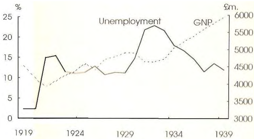
Εικόνα 1: Εθνικό Εισόδημα και Ανεργία στην Αγγλία, 1919-1939