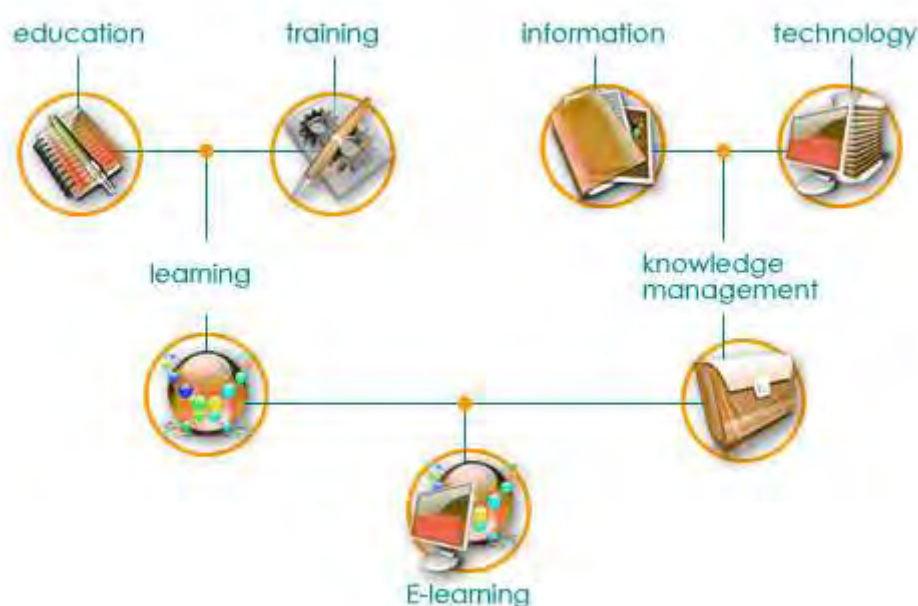
Εικόνα 4.1.1.: e-learning