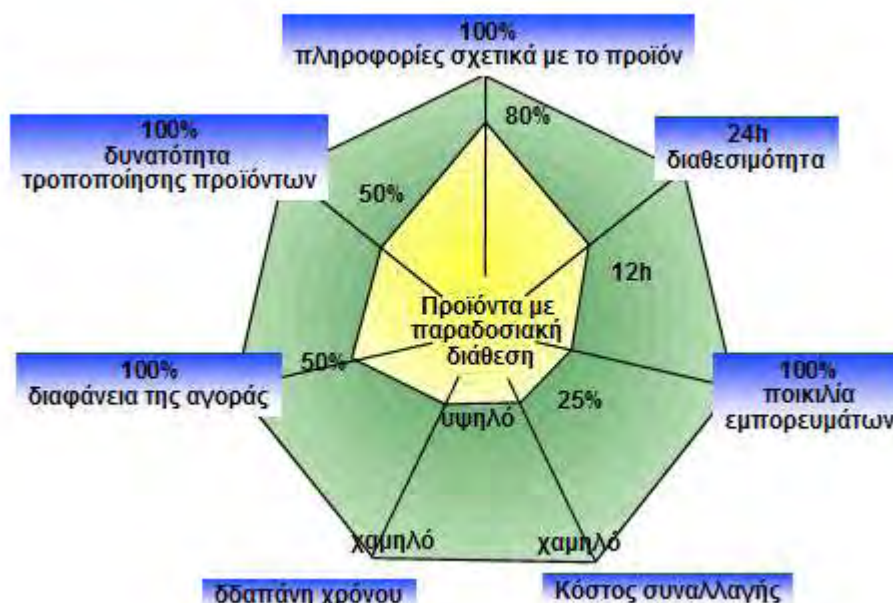
Σχήμα 3.6.1.: HE vs. Παραδοσιακή διάθεση

διαδικτύου. Τέλος, οι εμπορικές συναλλαγές μέσω ηλεκτρονικών αγορών συμβάλλουν στη διαφάνεια της αγοράς. Όλες οι πληροφορίες σχετικά με το προϊόν, οι τιμές, τα αποθέματα, οι τρόποι παράδοσης και εξόφλησης είναι διαθέσιμες στη πλατφόρμα έτσι ώστε ο κάθε ενδιαφερόμενος να έχει στη διάθεσή του όλες τις πληροφορίες που χρειάζεται.