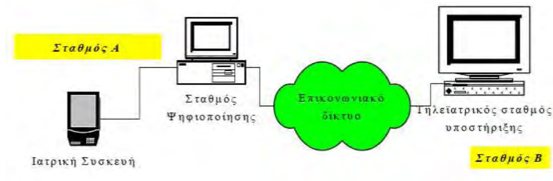
Σχήμα 6.4.1.: Η Τηλεϊατρική σχηματικά

(π.χ. αξιωματικός πλοίου). Επίσης, χρειάζεται μια δικτυακή υποδομή (LAN ή WAN) και το τεχνικό περιβάλλον, δηλαδή ο απαραίτητος τερματικός και ιατρικός εξοπλισμός.