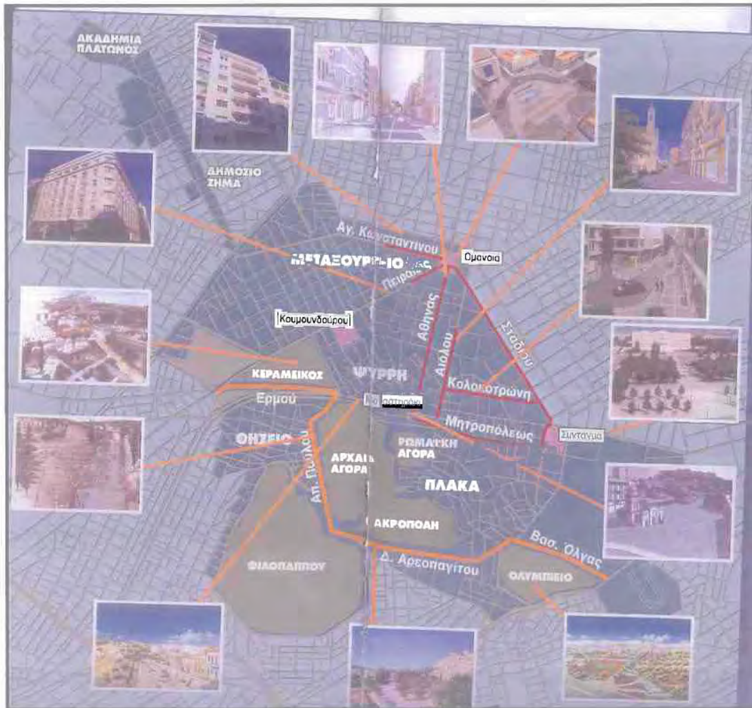
Χάρτης εργασιών του Οργανισμού Ενοποίησης Αρχαιολογικών Χώρων Αθήνας