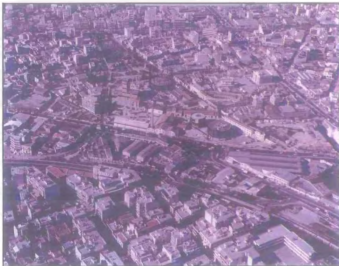
Σημερινή Κατάσταση της Περιοχής «Γκάζι»