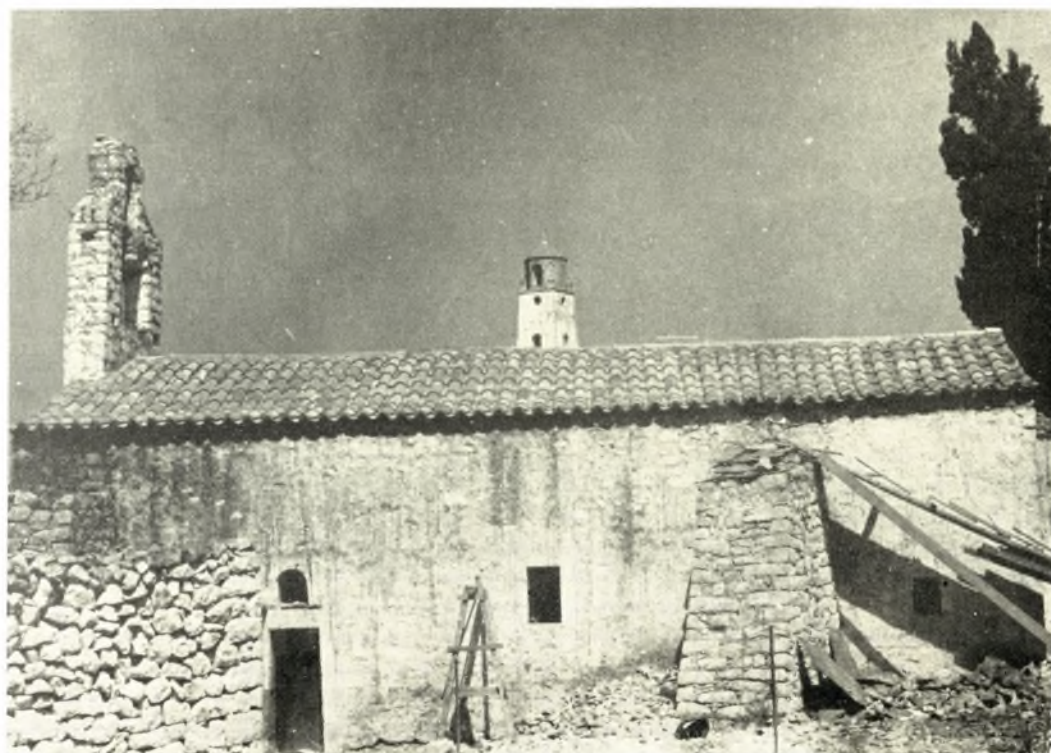
Λακωνία. Ναός Ἁγ. Ἰωάννου εἰς Ἀρεόπολιν: α. Πρόσοψις τοῦ ναοῦ πρὸ τῶν ἐργασιῶν, β. Ὁ ναός μετὰ τὴν στερέρωσιν