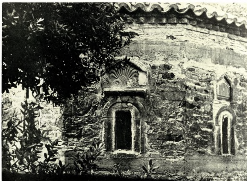
Λακωνία. 'Ι. Μονή 'Αγίων Τεσσαράκοντα ἐν Λακεδαίμονι: α. Τὸ καθολικόν, β. Τμήμα λακωνικῆς ἐπιτομβίου στήλης, ἐντειχισμένον εἰς τὸν ναόν