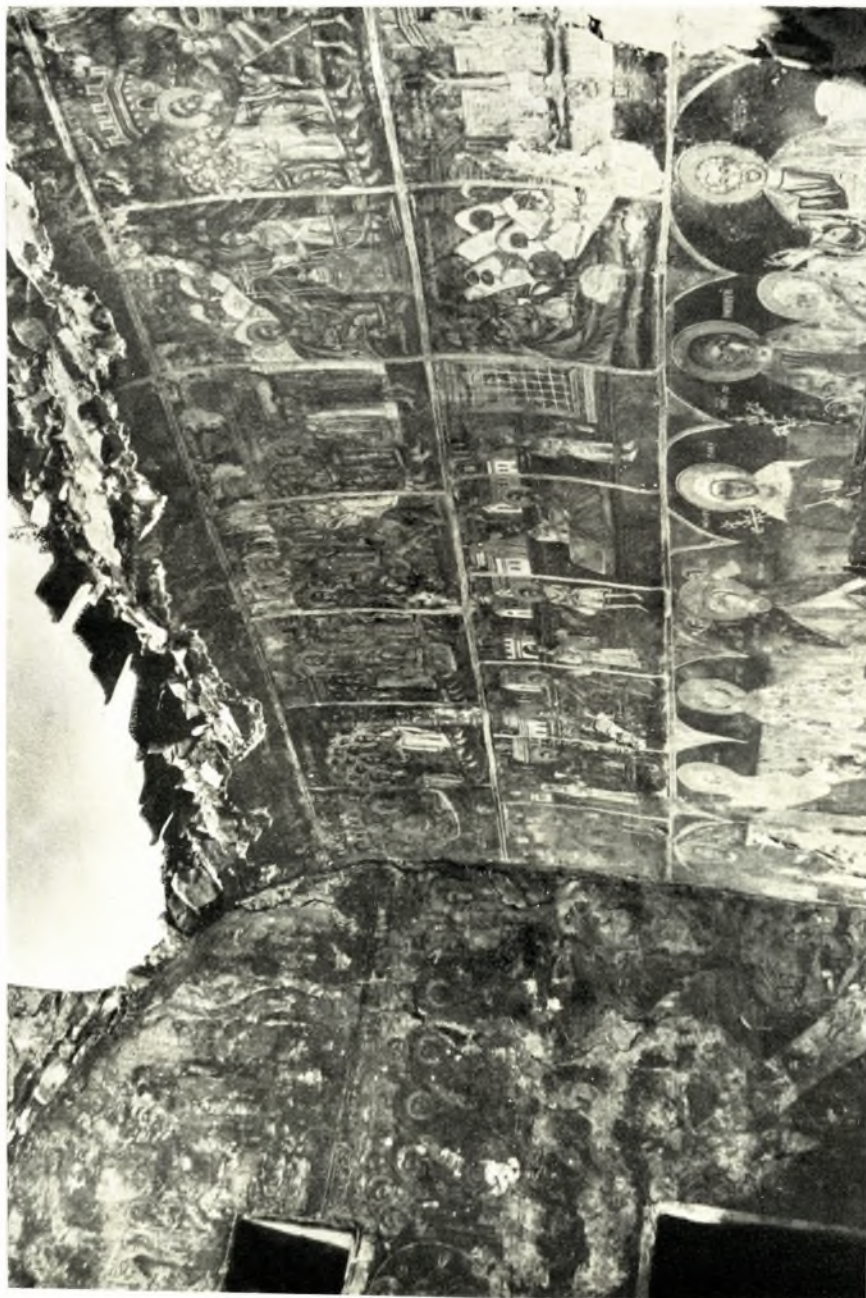
Λαρκωνία. Ναός Ἁγ. Ἰωάννου εἰς Ἀρεόπολιν. Τὸ ἑσωτερικὸν πρὸ τῶν ἐργαστιῶν στερεώσεως