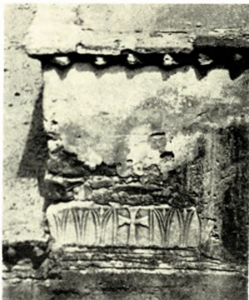
Λακωνία. Ἱ. Μονὴ Ἁγίων Τεσσαράκοντα ἐν Λακεδαίμονι: α. Ἀρχαῖον γλυπτὸν ἐντειχισμένον εἰς τὸ καθολικόν, β. Παλαιοχριστιανικὸν ἐπίθημα, ἐντειχισμένον εἰς τὸν ναὸν