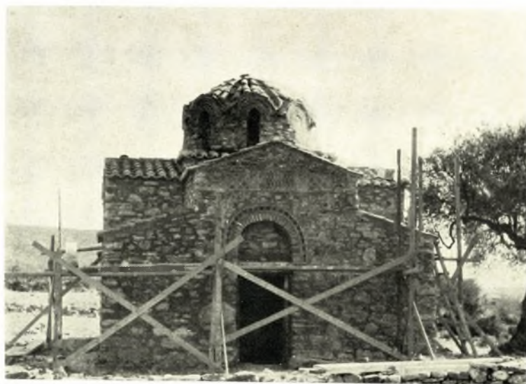
Λακωνία. Χρύσαφα. Ναός Ἁγ. Ἰωάννου: α - β. Ἡ πρόσοψις πρὸ καὶ κατὰ τὴν διάρκειαν τῶν ἐργασιῶν