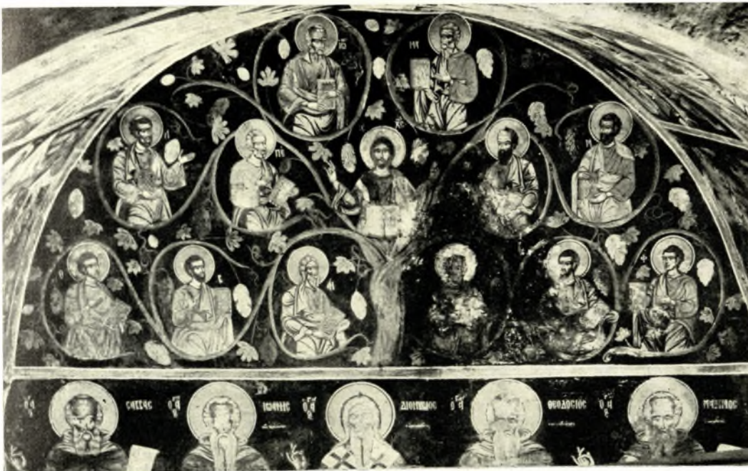
Ἀττική. Μονή Καισαριανῆς (Νάρθηξ): α. Ἡ Ρίζα τοῦ Ἰεσσαί, β. Ἡ Ἄμπελος