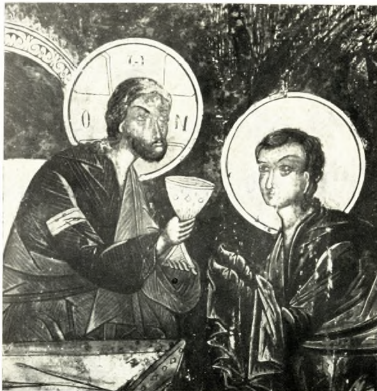
Ἀττική. Μονή Ἁγ. Ἰωάννου Θεολόγου: α. Ἡ Πλατυτέρα, β. Ἡ Θεία Κοινωνία. Λεπτομέρεια