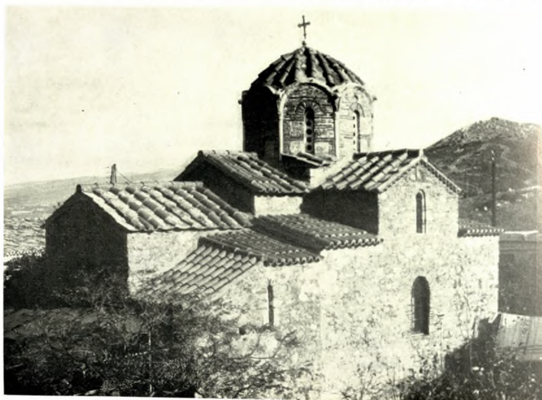
Ἄττική. Μονή Ἁγ. Ἰωάννου Θεολόγου: α. Ἡ Τράπεζα μετὰ τὰς ἐργασίας, β. Τὸ Καθολικόν