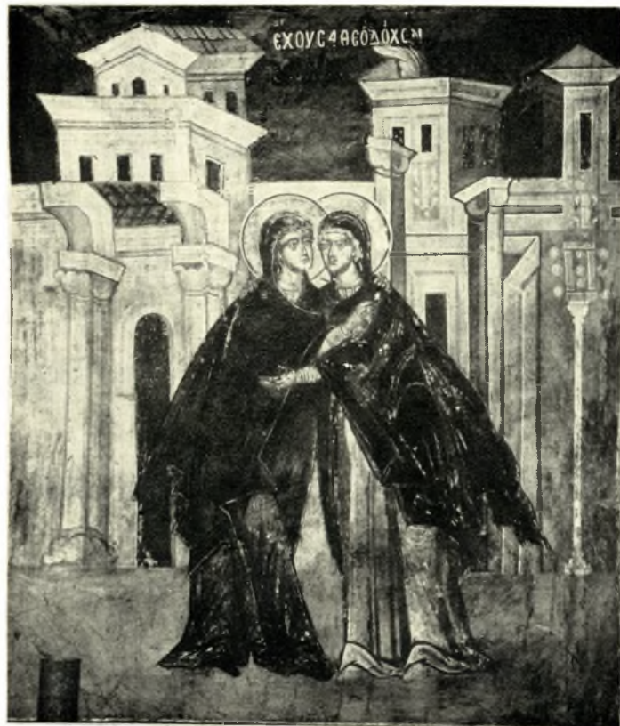
Ἄττική. Μονή Πετράκη: α - β. Ἐκ τῶν Οἰκῶν, πρὸ καὶ μετὰ τὸν καθαρισμὸν