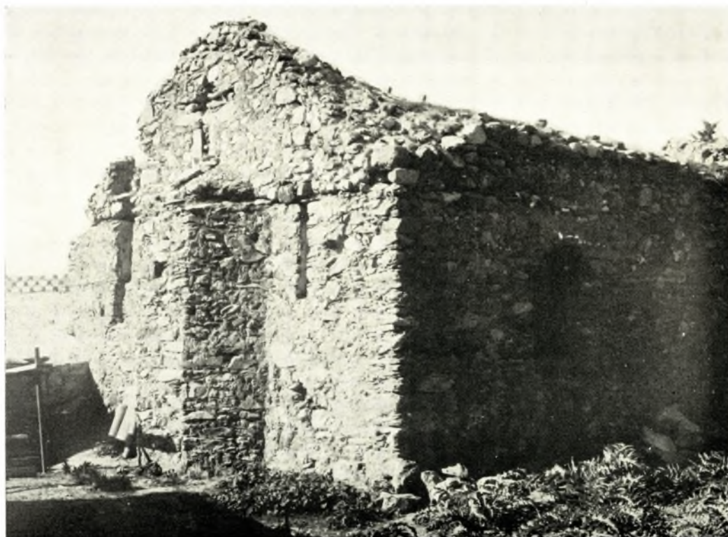
Ἄττικη: α. Σχέδια παλαιοχριστιανικοῦ κτίσματος εἰς ὁδὸν Πυθέου καὶ Κάρπου, β. Μονὴ Ἁγ. Ἰωάννου Θεολόγου. Ἡ Τράπεζα πρὸ τῶν ἐργασιῶν