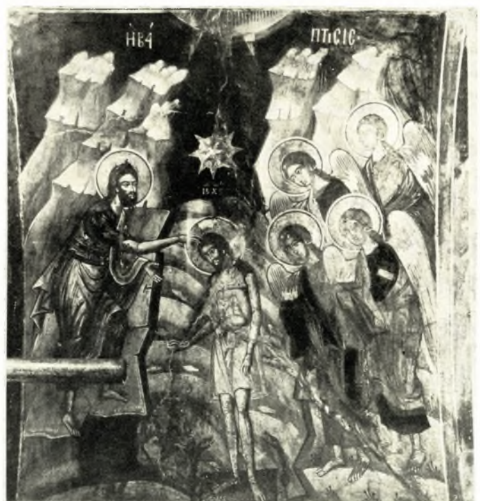
Ἀττική. Μονή Πετράκη: α - β. Ἡ Βάπτισις πρό και μετά τόν καθαρισμόν