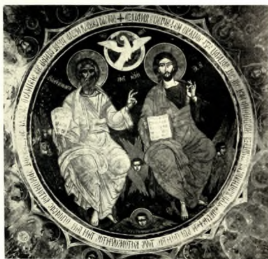
Ἄττική: α. Μονὴ Πετράκη. Ἐκ τῆς Οὐρανίου Λειτουργίας, μετὰ τὸν καθαρισμόν, β. Μονὴ Πετράκη. Ὁ Ἰούδας, μετὰ τὸν καθαρισμόν, γ. Μονὴ Καισαριανῆς (Νάρθηξ). Ἡ Ἁγ. Τριάς, μετὰ τὸν καθαρισμόν