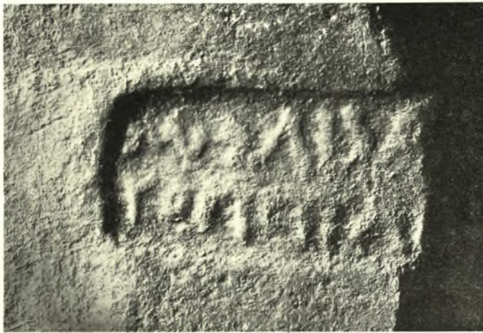
Εἰκ. 6. Ἐσφραγισμένη κέραμος ἐκ τῆς ἀνασκαπτομένης Ἡρακλείας τῆς Λύγκου λέγουσι «βασιλέως | Φιλίππου».

Μεταβὰς ἐγὼ εἰς Φλώριναν καὶ λαβὼν πίστωσιν 15 χιλ. δραχμῶν παρὰ τῆς φιλοπόλιδος ἀρχῆς τῆς πόλεως πρὸς ἐπανάληψιν τῆς ἀνασκαφῆς, ἐζήτησα πάλιν παρὰ τοῦ Ὑπουργείου καὶ ἔλαβον βοήθην τὸν ἐπιμελητὴν κ. Μπακαλάκη, εἰς ὃν καὶ ἀνέθηκα τὸ ἔργον, ἵνα ἐπιδοθῶ αὐτὸς εἰς ἐρεῦνας παρὰ τὸν Ἀλιάκμονα.