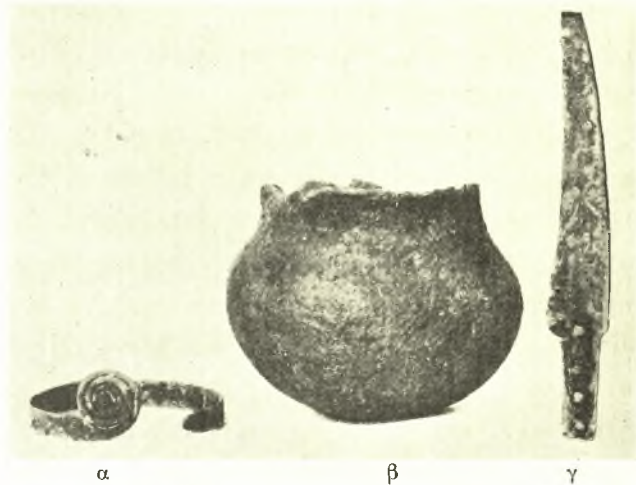
α β γ Εἰκ. 5. Εὐρήματα κατὰ τὸ χιλιόμετρον 27.100 τῆς σιδηροδρομικῆς γραμμῆς Καλαμπάκας - Βεροίας.