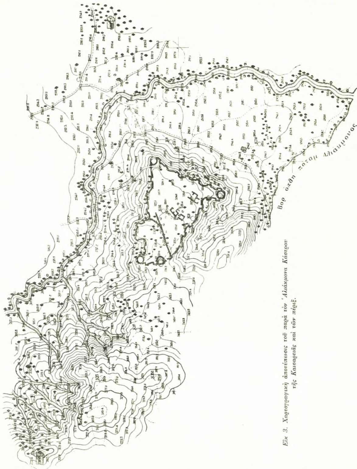
Εἰκ 3. Χαρτογραφικὴ ἀποτίπωσις τοῦ παρατὸν Ἀλιάκμονα Κάστρου τῆς Καισαρείας καὶ τῶν πέριξ.

ὁ Ἀλιάκμων καὶ οἱ χεῖμαρροι, ἀλλὰ καὶ ὁ Ἀλιάκμων εἶναι μακρὸς ἐν τῇ δυτικῇ Μακεδονίᾳ