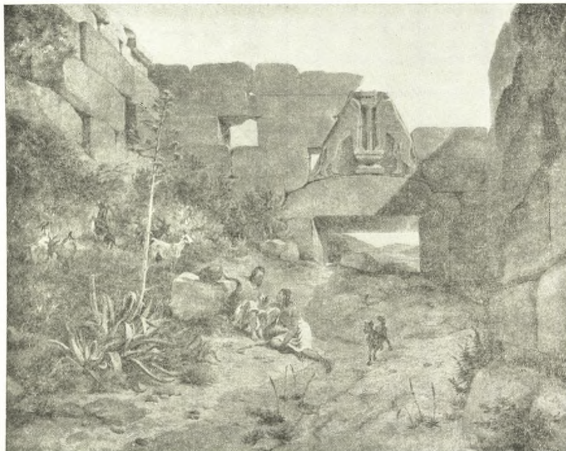
Εἰκ. 1. Ἡ πύλη τῶν Λεόντων πρὸ τῶν ἀνασκαφῶν τοῦ Schliemann κατὰ ζωγραφικὸν πίνακα τοῦ G. W. von Heideck ἐκ τῆς πινακοθήκης τοῦ Μονάχου, ἐκ CARL SCHUCHHARDT Die Burg, 1931 πίν. V.

Δυστυχῶς ἡ ἀναστήλωσις δὲν κατέστη δυνατὸν