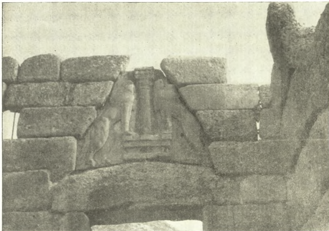
Εικ. 4. Τὸ ἄνω μέρος τῆς πύλης μετὰ τὴν ἀναστήλωσιν τῶν δύο λίθων τῆς δυτικῆς πλευρᾶς.