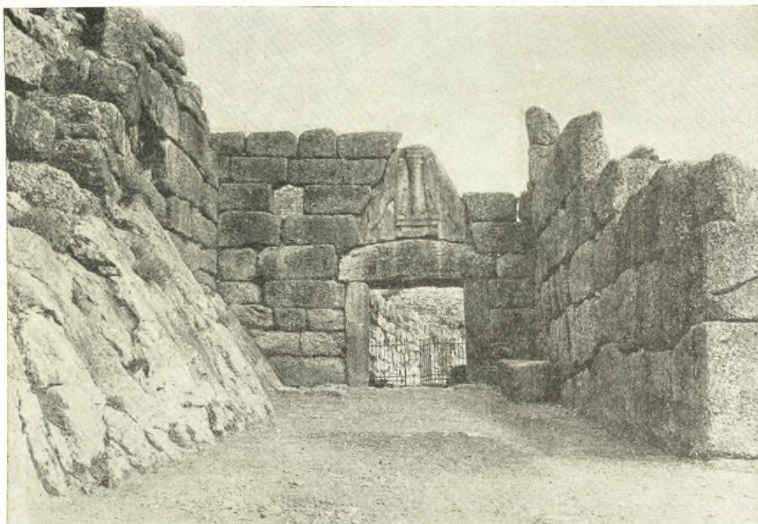
Εἰκ. 3. Ἡ πύλη ἐκ φωτογραφίας δημοσιευθείσης ὑπὸ Α. WACE Mycenae 1949 εἰκ. 72 α.

ὁ δεύτερος καλύπτει τμήμα μόνον τοῦ Λέοντος ἔξερχόμενος ἄνω τοῦ ἀναγλύφου καὶ κλείων τρόπον τινὰ τὸ τρίγωνον. Ὑπ' αὐτὰς τὰς προϋποθέσεις ἡ ἀναληφθεῖσα ἀναστήλωσις ὑπῆρξεν εὐχερής. Ἄλλ' ἡ ἐκτέλεσις ὑπῆρξε δυσκολωτάτη λόγῳ τοῦ μεγάλου ὄγκου τῶν λίθων (τὸ εἰδικὸν