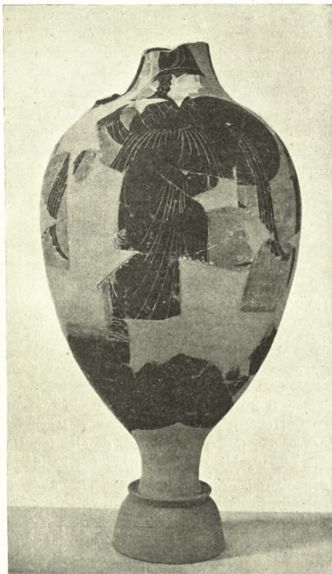
Εἰκ. 1. Παναθηναϊκὸς ἀμφορεύς ἐκ τοῦ Ὀλυμπείου. Προσθία ὄψις.

τοῦ λαιμοῦ πρὸς τὴν βάσιν, ἄλλη ἐπιγραφή πληροφορεῖ περὶ τοῦ ἀγωνοθέτου, καὶ συνεπῶς τοῦ ἔτους τῆς τελέσεως τῶν Παναθηναίων: