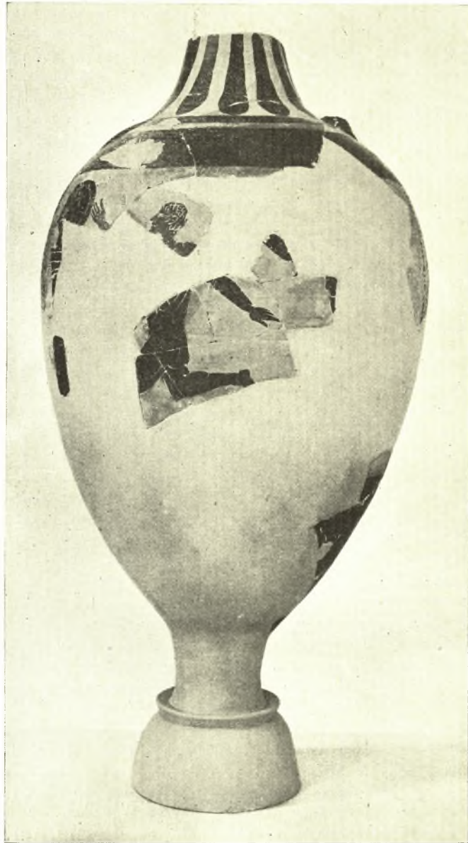
Εἰκ. 2. Παναθηναϊκὸς ἀμφορεὺς ἐκ τοῦ Ὀλυμπείου. Ὅπισθία ὄψις.

μεν ὑπ' ὄψιν τά: IG II 2 3430 [βασιλέα Καπ]παδοκί[ας καὶ τῆς|τραχείας] Κιλικίας 'Αρχέλαον]: 3425 βασιλεὺς Σιδονίων|Φιλοκλῆς: 3429 Δηϊόταρον Σινόριγος|Γαλ[α- τ]ῶν Τολισ[τ]οβαγίων|β[ασιλέα]: 654 1,2 ὁ Παιόνων β[ασ]ιλεὺς [Α]ἰδωλ[έω]ν.