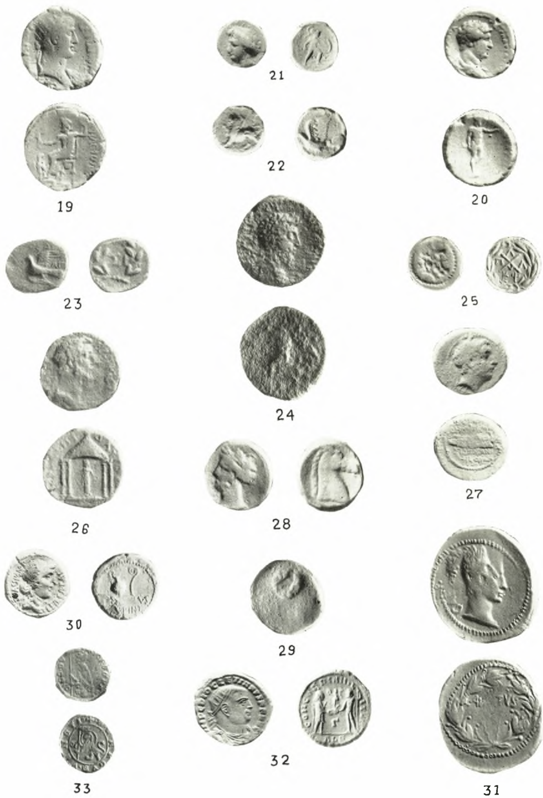
Νομίσματα ἀνασκαφῶν *Ἡλίδος.