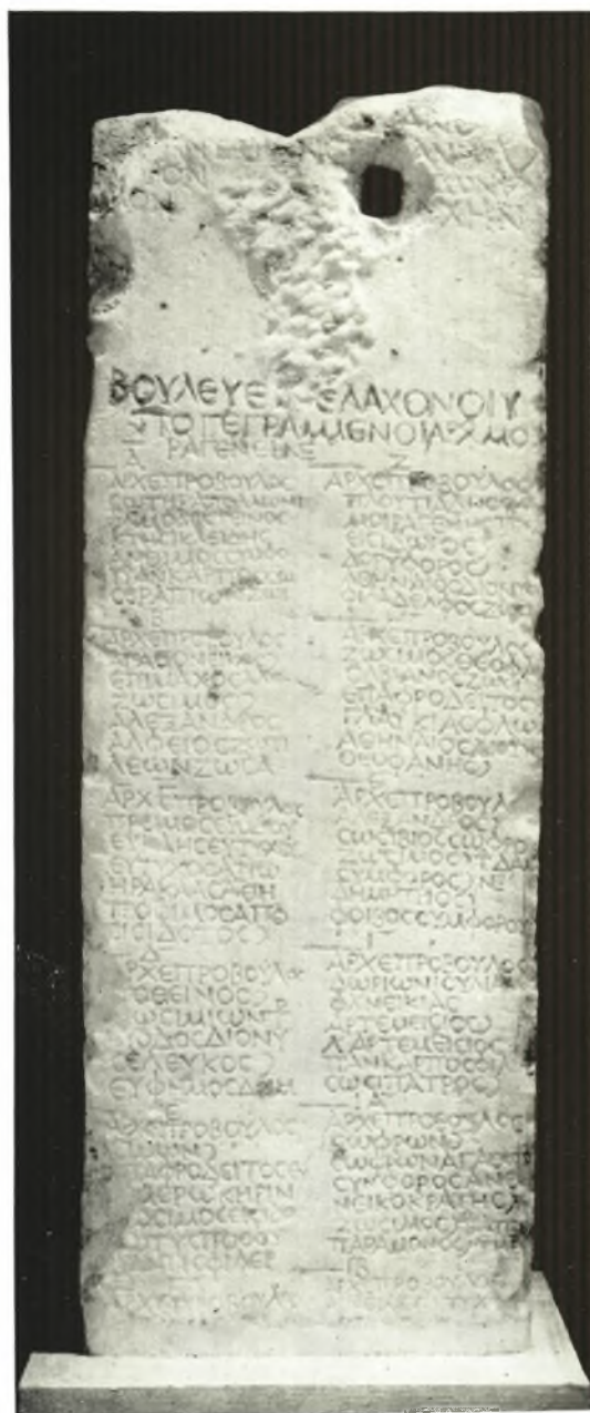
Ἐπιγραφή ἐκ Καρύστου.