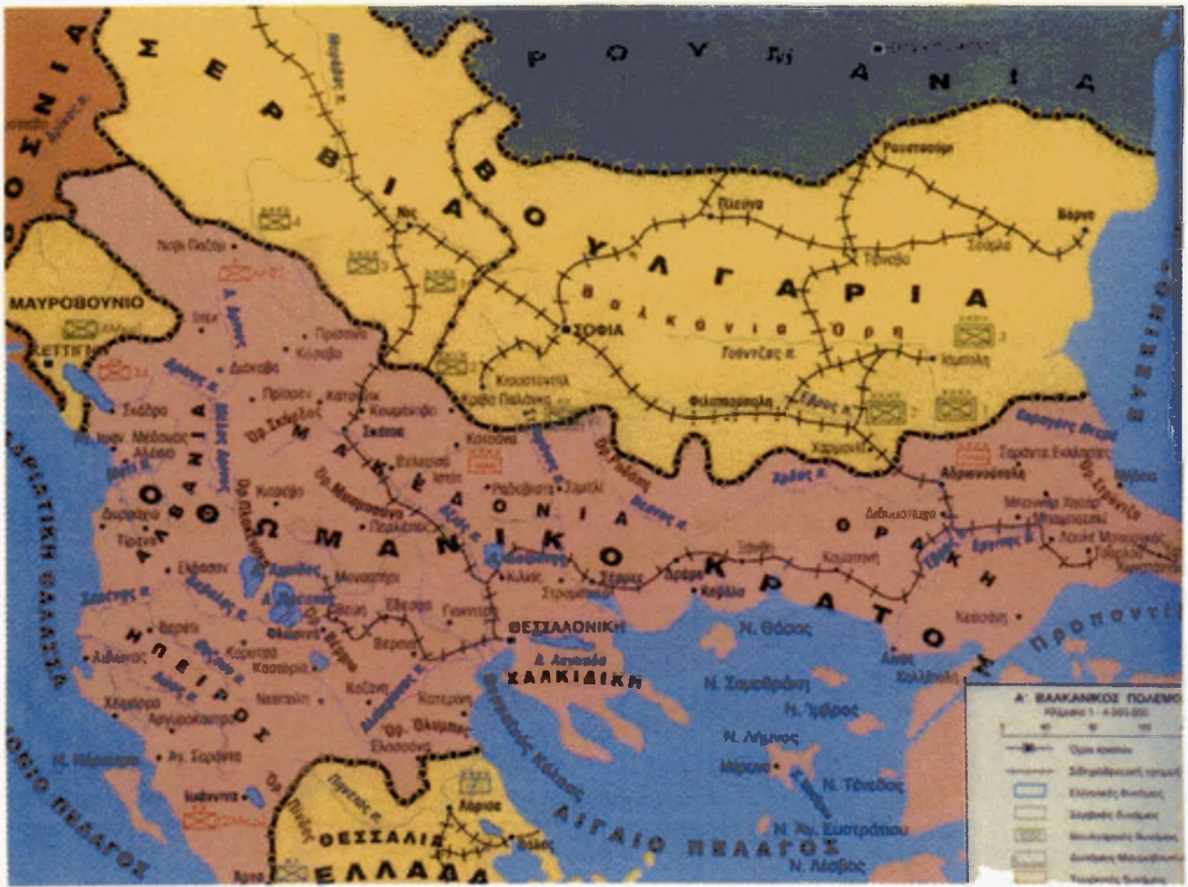
Τα Βαλκανικά Κράτη και η διάταξη των Μεγάλων Σχηματισμών πριν από τον πόλεμο