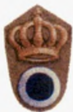
Το εθνόσημο των πληκίων του Ελληνικού Στρατού