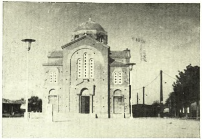
Σοφάδες : Ἡ Ἁγία Παρασκευὴ

Στὸ παραπάνω γεγονός οἱ Σοφαδίτες ἐπέδειξαν κοινὸ πνεῦμα ἀντιμετώπισεως σοβαρῶν γεγονότων, κατανόησι, καὶ μιὰ ἔξαρσι πατριωτισμοῦ σὲ βαθμὸ ἀφθάστου μεγαλείου καὶ ἐντόνου πατριωτικοῦ ἐνθουσιασμοῦ.