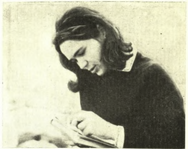
ΕΦΗΣ ΣΤ. ΑΛΛΑΜΑΝΗ

Ἐπὶ ἕξ ἔτη (1796 - 1802) ὑπῆρξε διδάσκαλος τῆς Σχολῆς Ἀμπελακίων τοῦ Κισσάβου, ὅπου ἐδίδασκεν ἀρχαία ἑλληνικὰ, μαθηματικὰ, φιλοσοφίαν καὶ ἰταλικά, τῶν ὁποίων