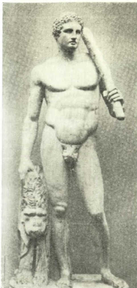
Ἡρακλῆς (Συλλογή Lansdowne)