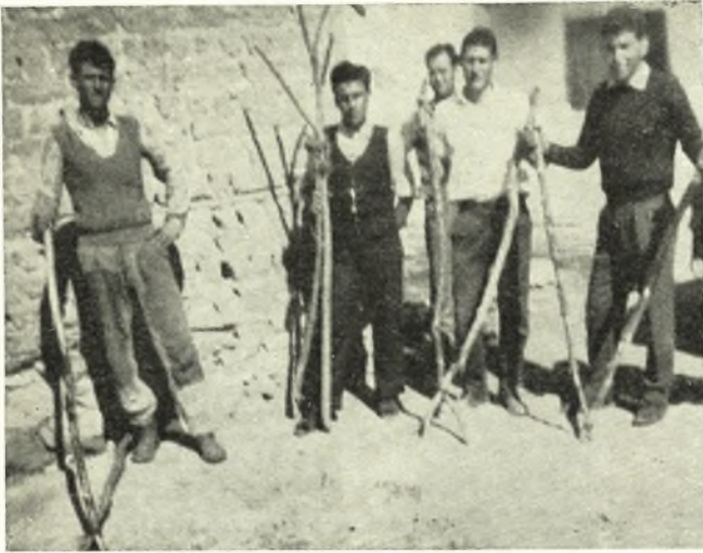
Οί σκυλοφάηδες με τὰ μάγκανα στα χέρια, έτοιμοι για εξόρμηση.