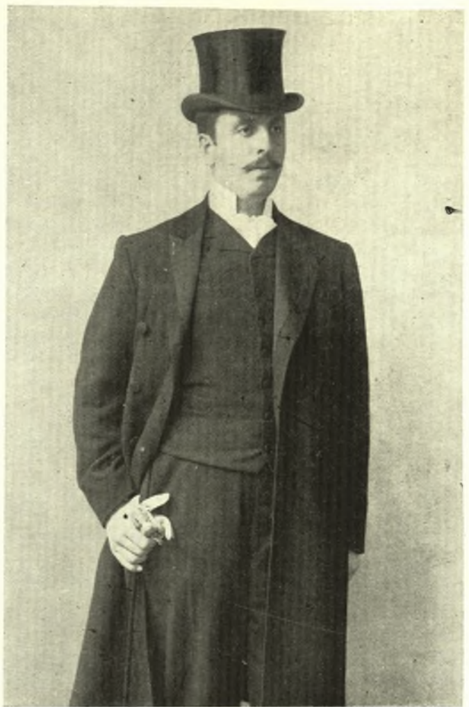
ΑΛΕΞΑΝΔΡΟΣ ΚΑΣΣΑΒΕΤΗΣ 1908. Βουλευτής Βόλου