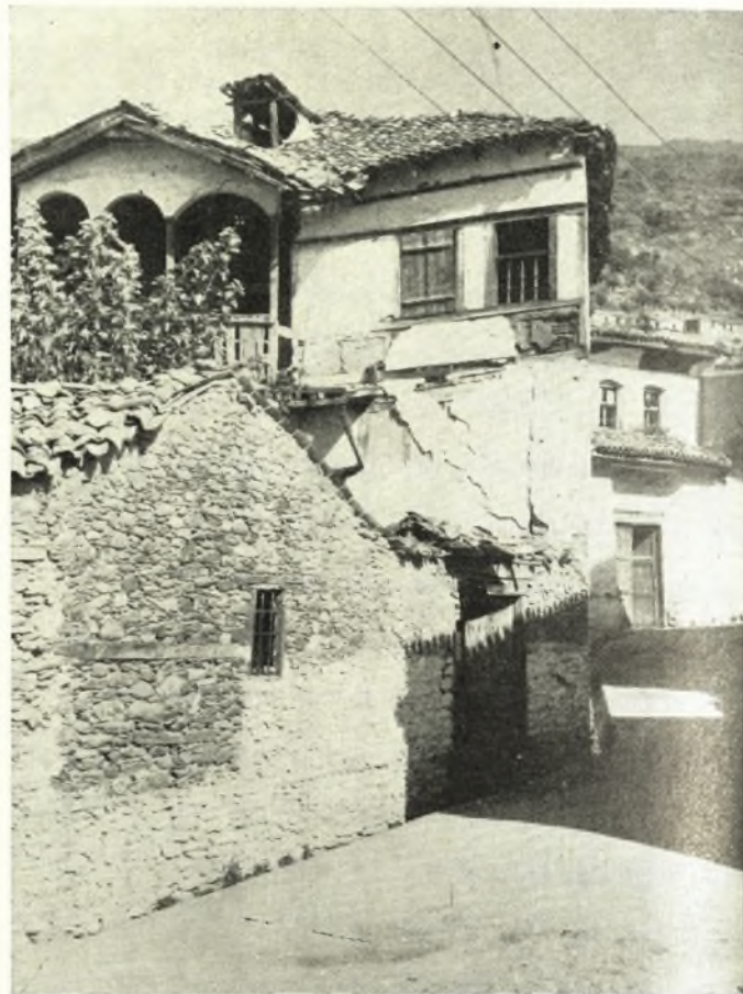
Ἁγία: Παλιὸ Ἀρχοντικό.