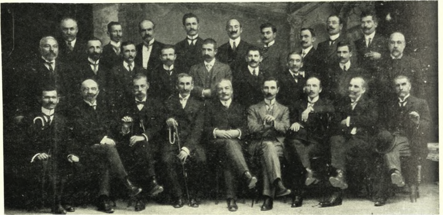
Παλαιοί Θεσσαλοί Βουλευταί