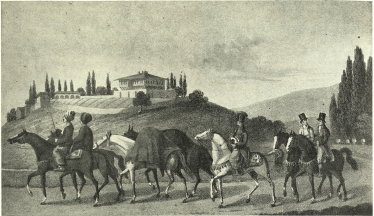
Ξένοι περιηγηταί διατρέχοντες τὴν Θεσσαλίαν.

πολύ. Ὑπῆρχαν ἐπίσης στὸν Τύρναβο σαράντα μιογία τζήδες πού ἔβαφαν σὲ διάφορα χρώματα καὶ δύομιση χιλιάδες ἀργαλειοί, πού ὕφαιναν βαμβακερά· πρέπει νὰ προσθέσωμε ἀκόμα ἑκατὸ περίπου σερβετάδες, πού ἀσχολούνταν μὲ τὴν ὕφανση τοῦ μεταξιοῦ. Σήμερα ἡ γεωργία, ἡ ὁποία ἀνεπαίσθητα ἀπὸ τοὺς Τούρκους περνᾶ στὰ χέρια τῶν Ἑλλήνων, προοδεύει, ἐνῶ ἡ βιομηχανία παρακμάζει. Ὁ Τύρναβος παράγει δύο χιλιάδες ὀκάδες ἀκατέργαστο βαμβάκι περισσότερο ἀπὸ ἄλλοτε, ἐνῶ ἡ παραγωγή κουκουλιῶν εἶναι ἕξι χιλιάδες ὀκάδες. Ἡ πλήρης παρακμὴ τῆς βιομηχανικῆς δραστηριότητος ὀφείλεται σὲ δύο λόγους: στὸ πέρασμα τοῦ στρατοῦ κατὰ τὸν πόλεμο τῆς ἑλληνικῆς ἐπαναστάσεως καὶ στὴν ἐξάπλωση τοῦ εὐρωπαϊκοῦ ἐμπορίου. Ἐπίσης μεγάλες οἰκογένειες Τυρναβιτῶν, πού ἐγκαταστάθηκαν στὴ Βιέννη, ἄρχισαν νὰ μεταφέρουν στὴ Δύση τὴν κατασκευὴ ἀνατολικῶν ὑφασμάτων.