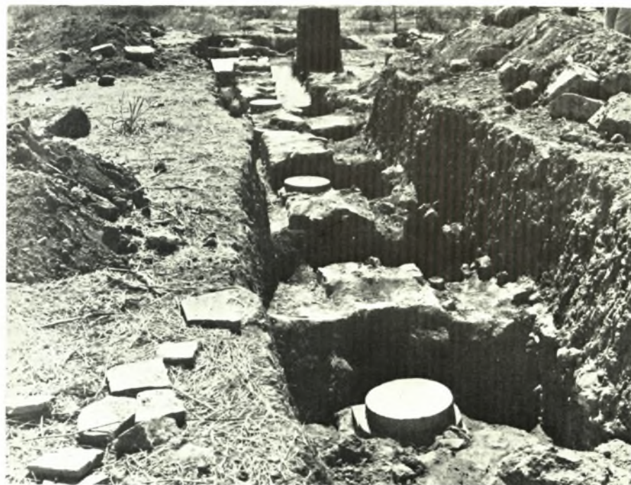
Νέα Ἀγχίαλος: α-β. Τοίχος καί κιονοστοιχία (κάτω) Δ. Στοῦς