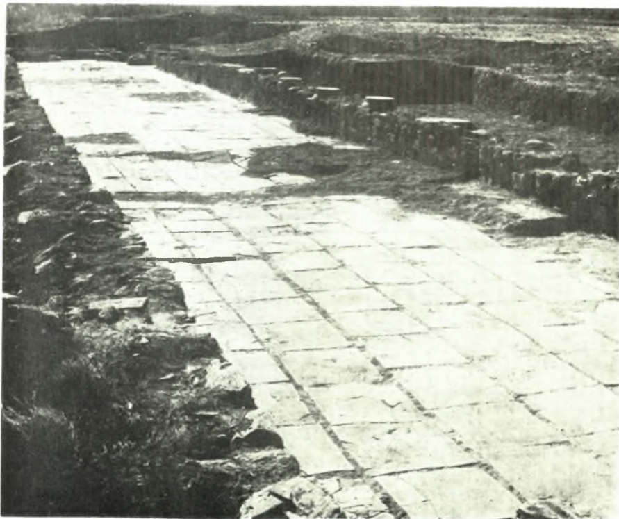
Νέα Ἄγχιαλος: α. Τοιχοποιία β' περιόδου. β. Πλακόστρωσις Ν. Στοῦς