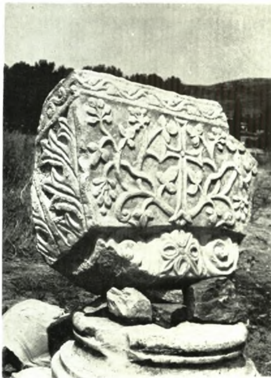
Νέα Ἀγχιάλος. Κιονόκρανα: α. Ἴωνικόν. β. Παλαιοχριστιανικόν μετ' ἐπιθήματος