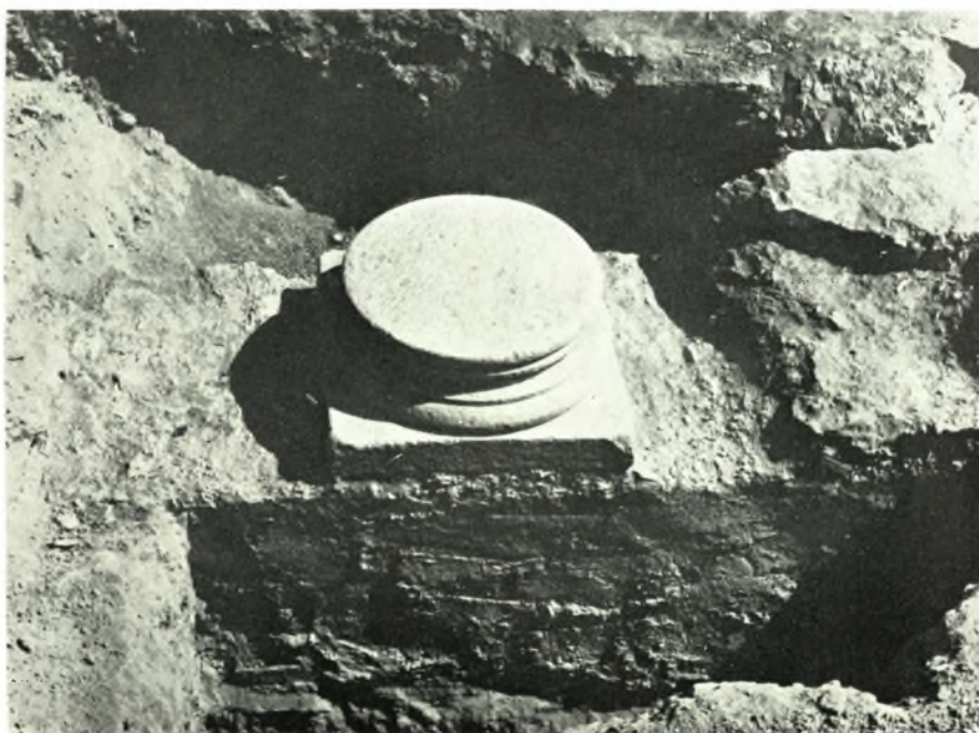
Νέα Ἄγχιαλος: α-β. Βάσεις κίωνων καὶ στυλοβάτης Δ. Στοῦς