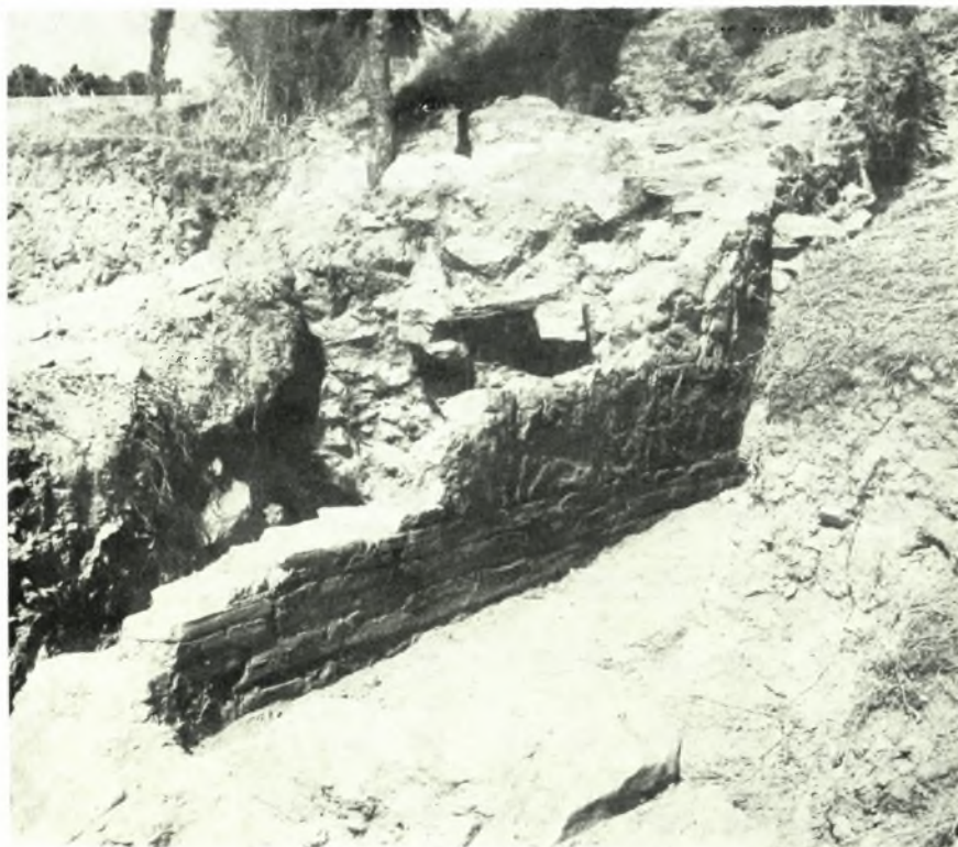
Νέα Άγκιαλος: α-β. Τοίχοι Α. Στοάς