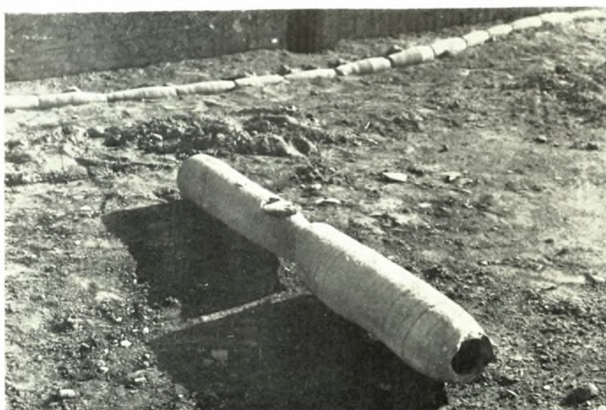
Νέα Ἀγχίαλος: α. Πήλινος ἀγωγός, β. Πήλινοι σωλῆνες