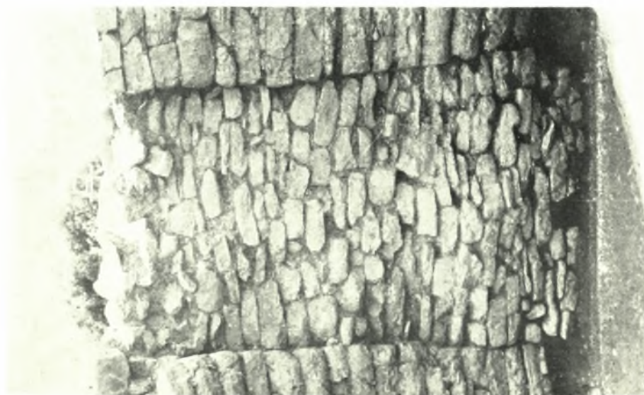
Μεσσηνία. Περιστέρια: Θ. Τ. 2: α. Θύρα τάφου εκ Β. β. Ό τάφος εκ Δ. γ. «Βιμός» έντός τής θόλου