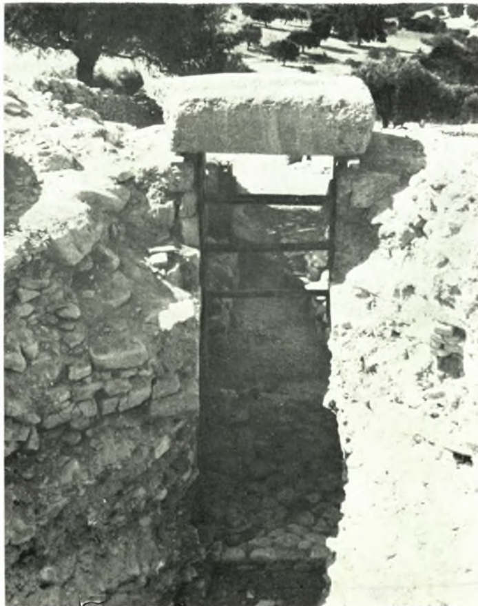
Μεσσηνία. Περιστεριά. Θ. Τ. 1: α. Ἄνωφλιον ἐκ ΒΔ. μετὰ τὸν καθαρισμὸν, β. Ὁ τάφος Ι μετὰ τὴν μετατόπισιν τοῦ ἀνωφλίου. Ὅρατὴ ἡ κατωτάτη σειρὰ τειχίσεως τοῦ στομίου