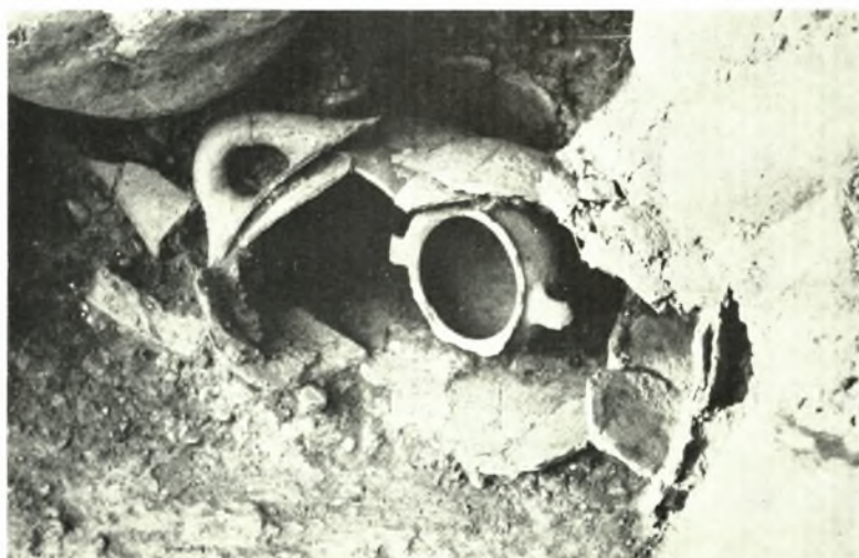
Μεσσηνία. Περιστεριά: Ἄνατολ. Οἰκία: α. ἐκ ΒΔ., β. Τάφος νηπίων, γ. Σκύφος ἐντὸς πίθου ΣΠ. ΜΑΡΙΝΑΤΟΣ