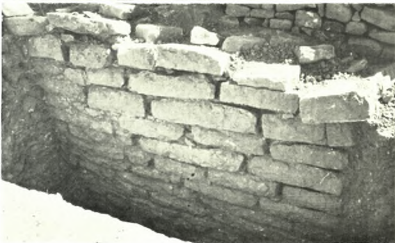
Μεσσηνία. Περιστεριά: α. Θ. Τ. 1. ΥΕ 1 και έλληνικά όστρακα, β-γ. Θ. Τ. 2. Άνατολ. ήμισυ θόλου και ή δεξιά παρειά του δρόμου