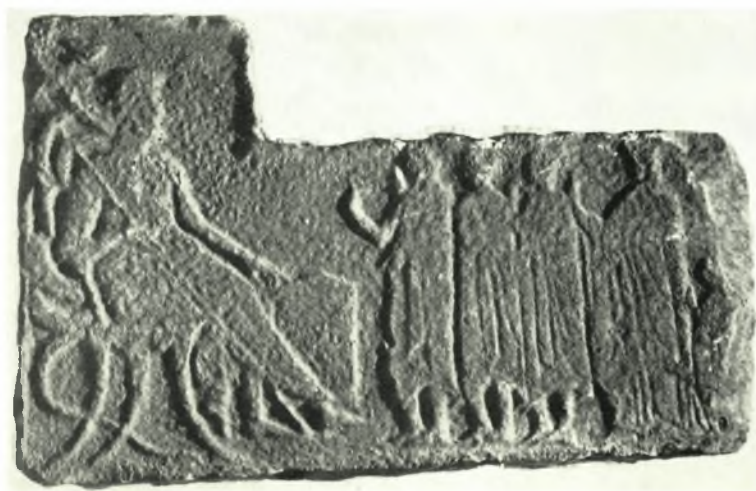
Σπάρτη: α. Τμήμα τῆς ἀνασκαφῆς τῆς Ἀκροπόλεως Σπάρτης, β. Τμήμα τοῦ θεάτρου, τοῦ ὁποῖου καθαρίζεται ἡ ὄρχήστρα, γ. Ἀνάγλυφον τοῦ τύπου τῶν «ἀφηρωισμένων νεκρῶν». Τυχαῖον εὑρημα