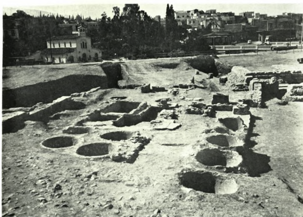
ἼΑθηνα. ἸΑνασκαφαὶ νοτιῶς ἸΑλυμπεῖου: α. Τὰ ἀποκαλυφθέντα ἐπὶ τῶν ἐρείπων τοῦ κλασσικοῦ ναοῦ λείψανα ἐλαιοτριβεῖου βυζ. χρόνων, β. ἸΑγκαταστάσεις ἐργαστηρίων βυζαντινῶν χρόνων πλησίον τοῦ Ῥωμαϊκοῦ ναοῦ