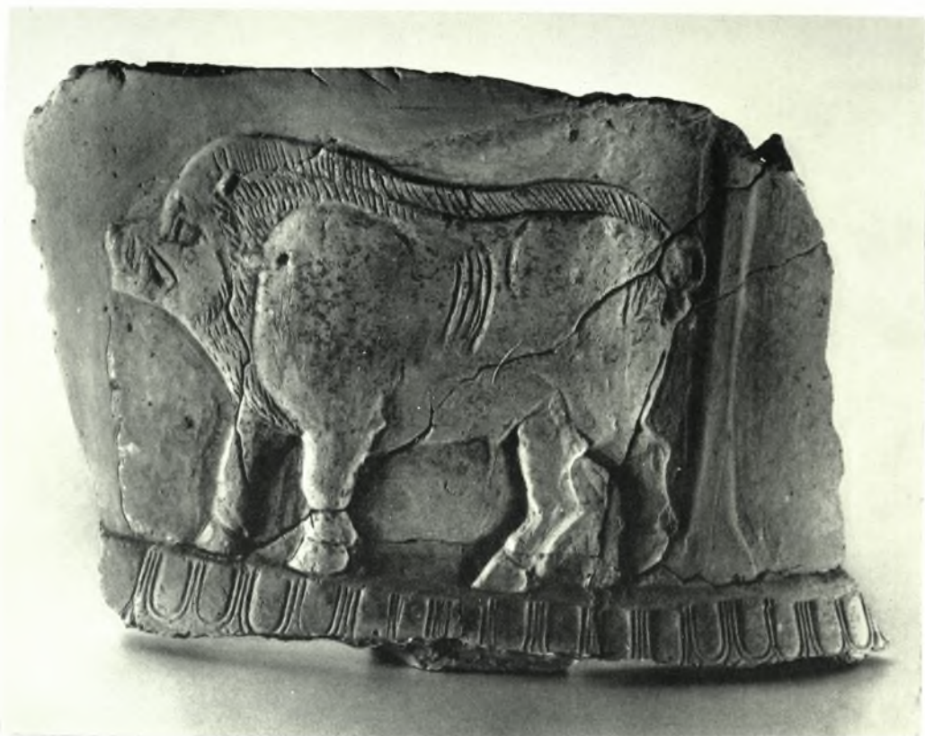
Κρήτη. Συλλογή Μεταξά. Εύρηματα ἐξ Ἀρκάδων: α. Χρυσὴ ψήφος, β. Τμῆμα πίθου μετ' ἀναγλύφου κάπρου