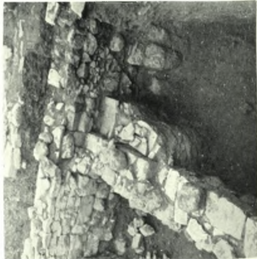
Κέρκυρα. Ἀνασκαφή Εὐελπίδη: α. Οἰκία Α'. Ο τοῖχος Κ ἀπὸ Δ., β. Τμήμα πρώιμου κρατήρος, γ. Ὅστρακον μεταβατικῶς κορινθιακοῦ ἄγγείου, δ. Ἡ ἑσωτερικὴ γωνία τῶν τοίχων Κ καὶ ΗΗ ἀπὸ Ν., ε. Τμήμα ἄγγείου με παρίστειν Βελλεροφόντου καὶ Χίμαρας