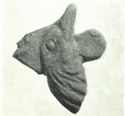
Κέρκυρα. Ίερόν Μον Ρερος: α. Τμήμα έπαστιδος σίμης, β. Υστερογέωμετρικόν χαλκούιν ίππάριον, γ. Όστέινα μικροαντικείμενα, δ. Πηλίνη κεφαλή πετεινού, ε. Τμήμα πηλίνου ειδωλίου θεάς, ζ. Όστρακον ποτηρίου, ζ - η. Έρυθρομορφα όστρακα