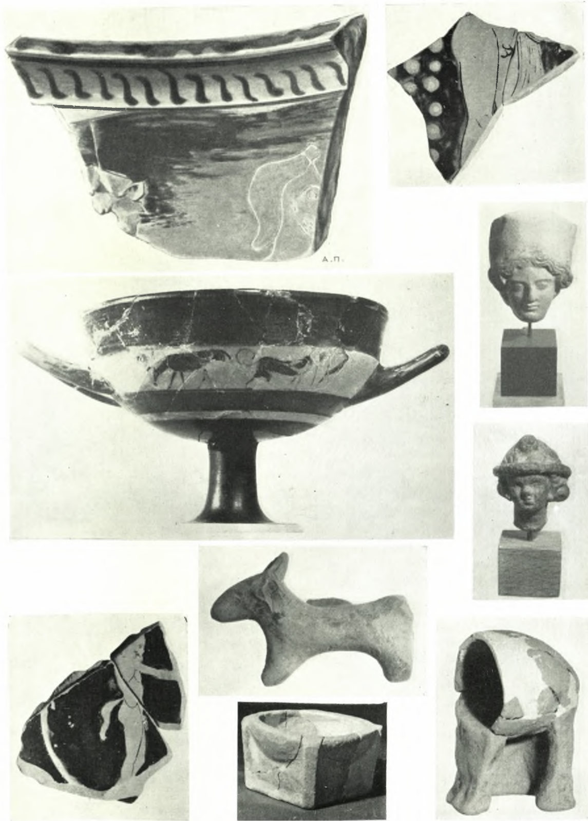
Κέρκυρα. Ἀνασκαφή Ἐδελπίδη: α. Τμήμα ἀγγείου με ἐγχάρακτον ἀνδρικήν κεφαλὴν, β. Ὅστρακον ἐρυθρομόρφου κύλικος, γ. Μελανόμορφος κύλιξ, δ. Κεφαλὴ εἰδωλίου θεᾶς με πόλον, ε. Κεφαλὴ ἑλληνιστικοῦ εἰδωλίου, ζ. Ὅστρακον ἐρυθρομόρφου πινακίου, ζ. Πήλινον κονάριον, η. Πήλινον περιρραντήριον, θ. Μικρὸς πήλινος ἵπνός Γ. ΔΟΝΤΑΣ