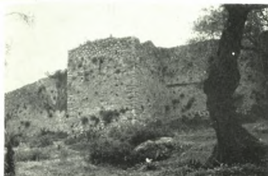
Κέρκυρα: α. Μαρμαρίνη κεφαλή Ἀφροδίτης ἐκ Μεσογῆς, β - γ. Προϊστορικὰ ἐργαλεῖα ἐκ Σπαρτίλλα, δ. Πηγὴ Καρδακίου Κερκύρας. Ἀρχαῖος τοῖχος παρὰ τὴν πηγὴν, ε. Βυζαντινὸν φρούριον Γαρδικίου