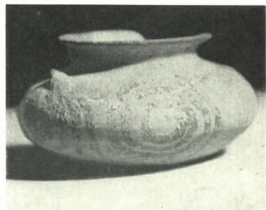
Κέρκυρα: α, γ. Τμήματα ρωμαϊκού αγγείου εκ τῆς ἀνασκαφῆς οἰκοπ. Εὐελπίδῃ, β. Ναὸς Ἀρτέμιδος. Νέον τεμάχιον ἐκ τῆς χαίτης πάνθηρος, δ, ε. Ἄγγεια ἐκ τοῦ θολωτοῦ τάφου εἰς θέσιν «Κλαψίας» Ζακύνθου, ε. Πρόσοψις τοῦ θολωτοῦ τάφου εἰς θέσιν «Κλαψίας» Ζακύνθου