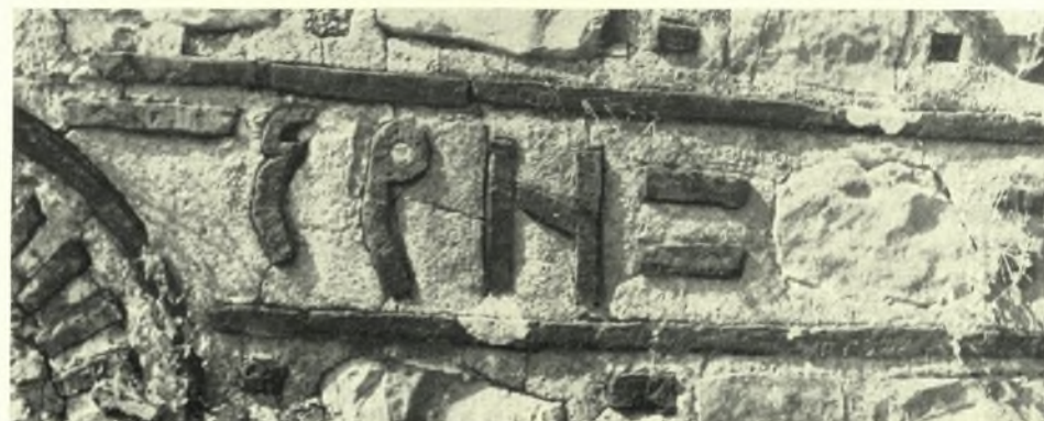
Ἡπειρος. Κυψέλη Θεσπρωτίας: α. Ἡ Τράπεζα τῆς μονῆς Ἁγίου Δημητρίου. ΒΑ. ὄψις, β-γ. Ἡ ἐπιγραφή τοῦ καθολικοῦ τῆς μονῆς Ἁγίου Δημητρίου, τοῦ ἔτους 1242