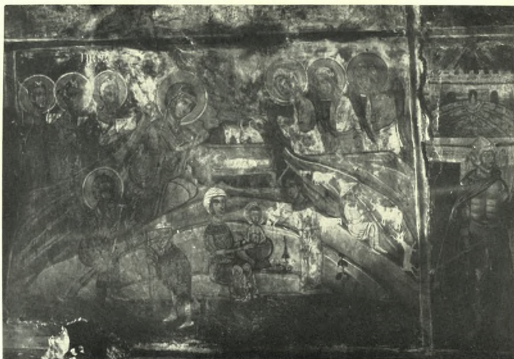
Ἡπειρος. Ν. Ἰωαννίνων: α. Νεγάδες Ζαγορίου. Κοίμησις καὶ Ἀπόστολοι. Τοιχογραφία ἀπὸ τὸν ναὸν Ἁγίου Γεωργίου, 1795, β. Βλαχάτανον. Γέννησις. Λαϊκὴ τοιχογραφία ἀπὸ τὸν ναὸν Ἁγίας Παρασκευῆς, 18ου αἰ.