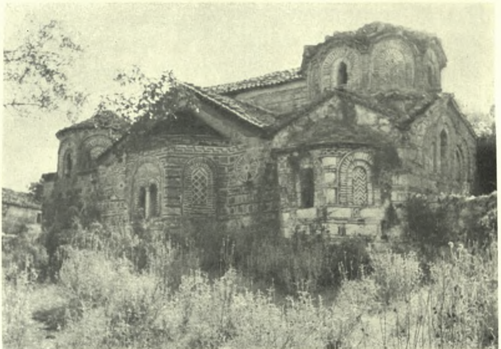
Ἡπειρος. Κυψέλη Θεσπρωτίας: α - β. Τὸ καθολικὸν τῆς μονῆς Ἁγίου Δημητρίου καὶ ΒΑ. ἄποψις αὐτοῦ