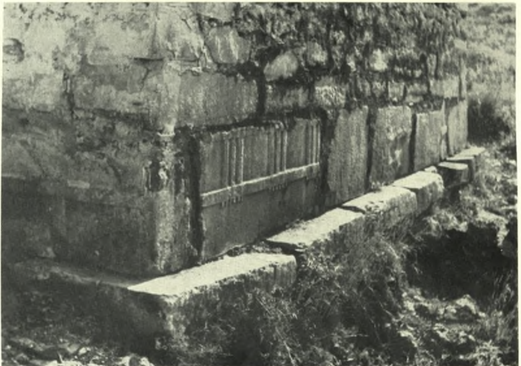
Ἡπειρος: α. Βουλγαρέλιον Ν. Ἔαρτης. Κόκκινη Ἐκκλησιά. Προσωπογραφία Ἰωάννου καὶ Ἄννης Τζιμισκῆ. Τοιχογραφία 13ου αἰ., β. Ζερβοχώριον Θεσπρωτίας. Ἐκκλησιδίων Ἁγίου Δονάτου