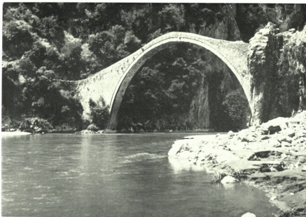
α - β. Ὁ ναός τῆς Ἐπισκοπῆς πρὸ καὶ μετὰ τὴν ἔρευναν, γ. Ἡ γέφυρα Μαρδάχα παρὰ τὰς πηγὰς τοῦ Ἀχελώου