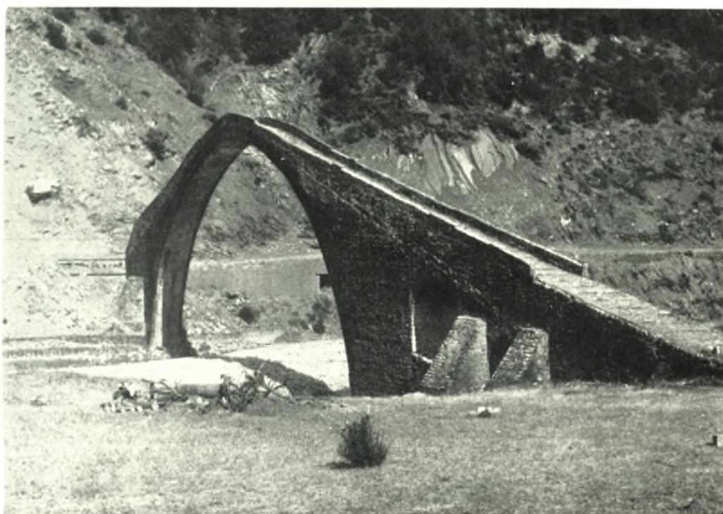
α. Το κατάστρωμα της γεφύρας Μαρδάχας, β. Ἡ γέφυρα τοῦ Μανώλη παρά τὸ Τριπόταμον