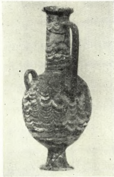
Είχ. 1. - Glass Flask from Amnisos in Heraclion Museum. Left: front view; right: back view.