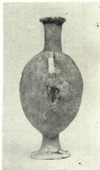
Είχ. 2. - Glass Flask from Phaistos in Heraclion Museum. Left: front view; right: side view.