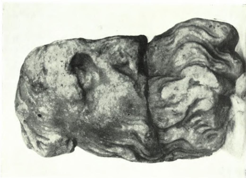
Ρόδος : α. Κεφαλή εξ αναγλύφου ελληνιστικής εποχής, β. Κορμός « αποσανδαλιωμένης » Αφροδίτης