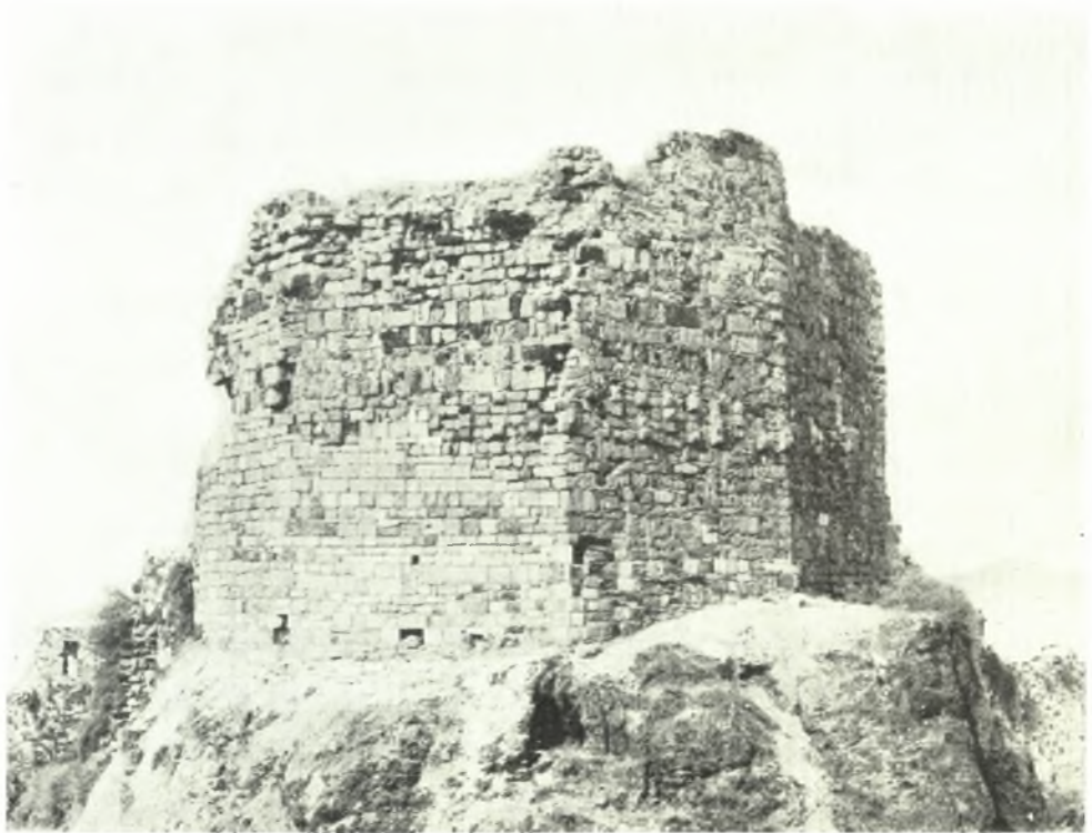
Νίσυρος: α - β. Τὸ μεσαιωνικὸν φρούριον πρὸ καὶ μετὰ τὰς ἐργασίας