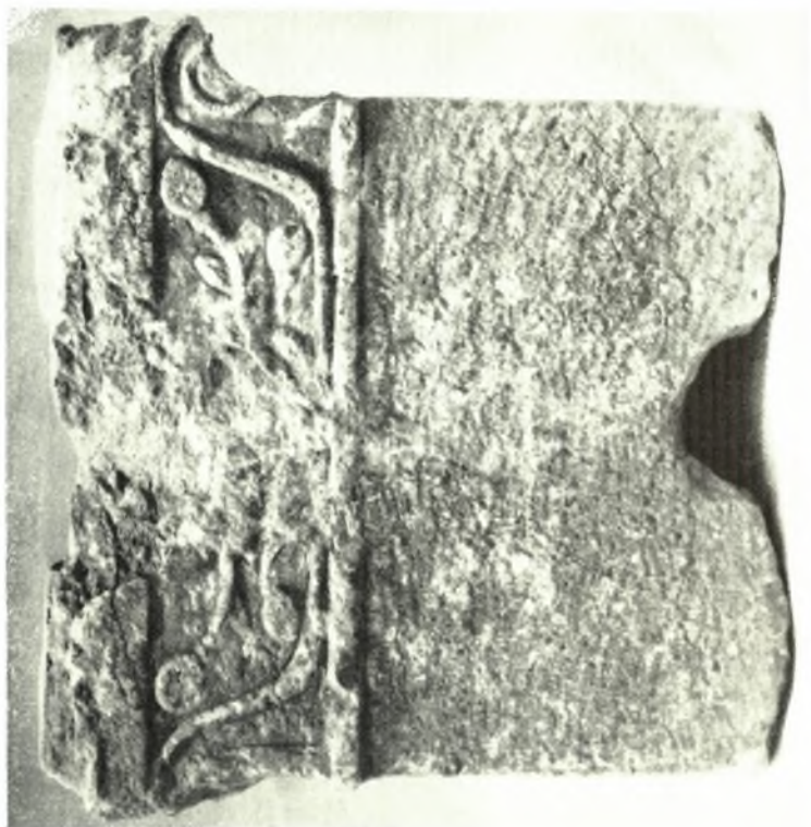
Ρόδος : α. Ἀρχιτεκτονικὸν μέλος ἐκ λαρτίου λίθου, β. Τμήμα ἀρχαίας μαρμαρινῆς στήλης