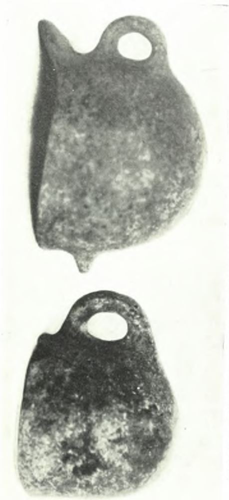
Νίσυρος : α. Μαρμάρινος βομός, β. Μικρά πρόζους νεολιθική, γ. Νεολιθικά άγγεία Γ.Ρ. ΚΩΝΣΤΑΝΤΙΝΟΠΟΥΛΟΣ