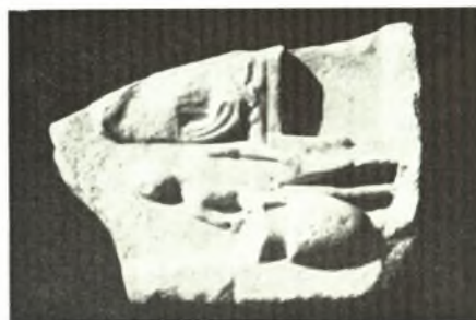
Νίσυρος: α. Τμήμα επιτομβίας στήλης, β. Τμήμα νεκροδείπνου, γ. Κάτω μέρος μαρμαρίνου ανδριάντος