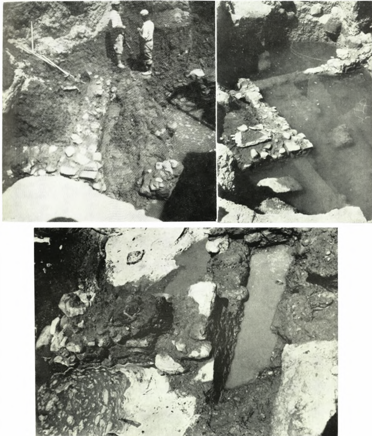
Νάξος. Μυκηναϊκός οικισμός: α. Ήρειπια, β. Κάτω, υπό τὸ ὕδωρ, διακρίνεται τὸ κατώφλιον τοῦ δωματίου Γ, γ. Ἐπάλληλοι τοῖχοι κατὰ τὴν ΒΑ. γωνίαν