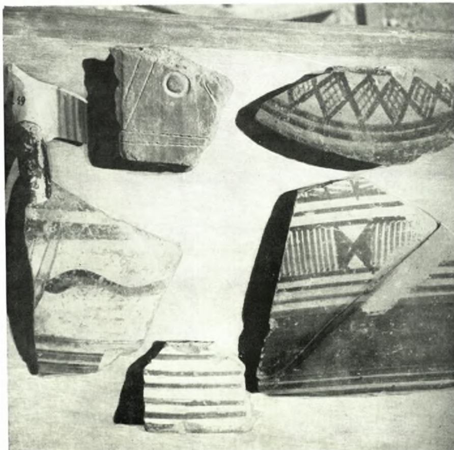
Νάξος: α. Άποψις τής Χώρας, β. Γεωμετρικά όστρακα