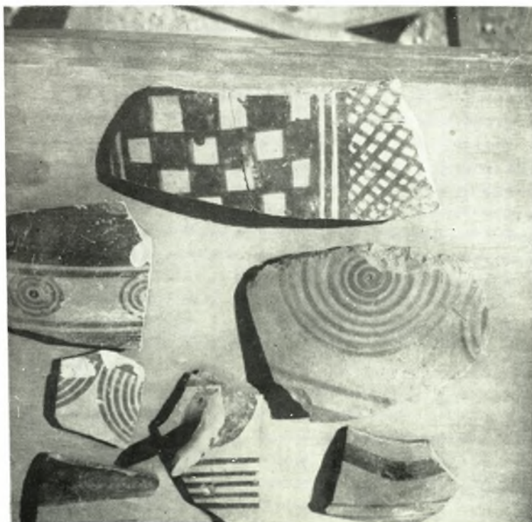
Νάξος: α. Τεμάχια ραμφοστόμου μεσοκυκλαδικής οίνοχης, β. Προτογεωμετρική οίνοχη, γ. Προτογεωμετρικά δοστρακα