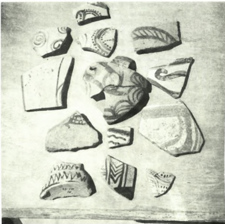
Νάξος: α - β. Μυκηναϊκά όστρακα εκ της πόλεως Νάξου