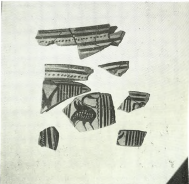
Νάξος: α - β. Ύστερογεωμετρικά ὄστρακα