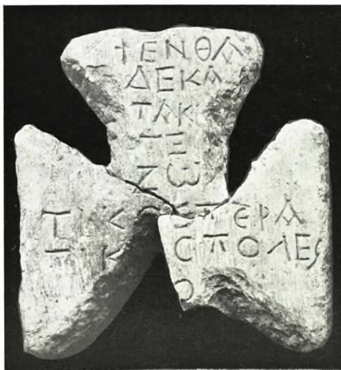
α. «Μεγάλη Πέτρα» του χωριού Μέγα Πιστόν, β. Λιθινή άξινη - πέλεκυς Νέας Στρώμης, γ. Ήνεπίγραφος σταυρός εκ των Ήφαντών Κομοτηνής