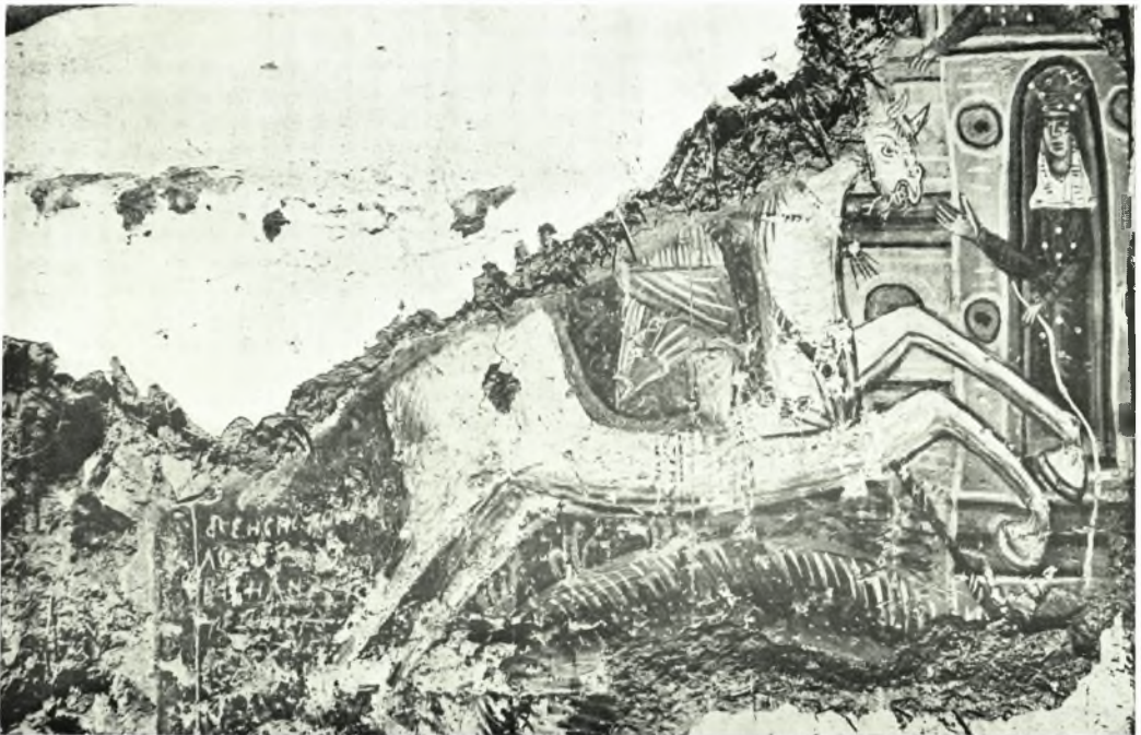
Ναός Ἁγίου Γεωργίου Πρέσπας: α. Τμήμα τῆς ἀποκαλυφθείσης τοιχογραφίας παριστώσης τὴν εἰς Ἄδου κάθοδον, β. Τὸ ἀποκαλυφθὲν τμήμα τοῦ θαύματος (δρακοκτονίας) τοῦ Ἁγίου